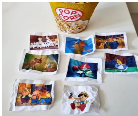
Slika 8. Filmske kokice