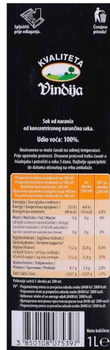
Slika 12. Prikaz hranjivih vrijednosti Vindi 100% juice naranča soka