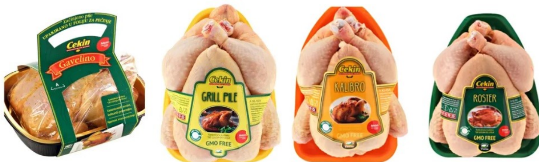
Slika 6. Piletina