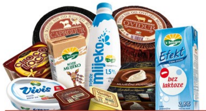
Slika 5. Mliječni proizvodi