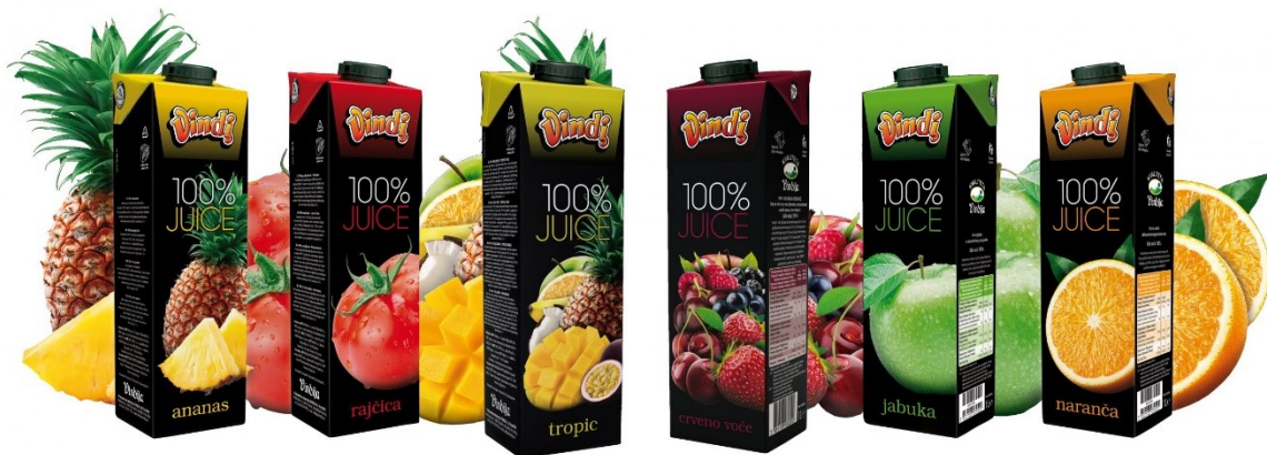
Slika 14. Vindi 100% juice sokovi

Kao i kod proizvoda Choco Loco, Vindija stavlja na tržište te izvozi više okusa stopostotnih sokova.