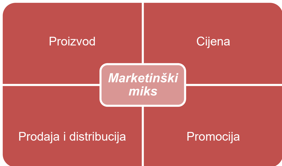
Slika 1. Prikaz marketinškog miksa

Marketinški miks je kombinacija elemenata marketinga u koje spadaju proizvod, cijena, prodaja i distribucija te promocija (Slika 1.). Navedeni elementi marketinga se primjenjuju pri razmjeni proizvoda. Kod usluga kao predmeta tržišne razmjene marketinški miks uz četiri osnovna elementa marketinškog miksa sadrži dodana tri elementa - ljude, fizičke dokaze i proces.