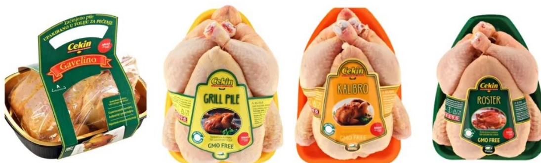
Slika 6. Piletina