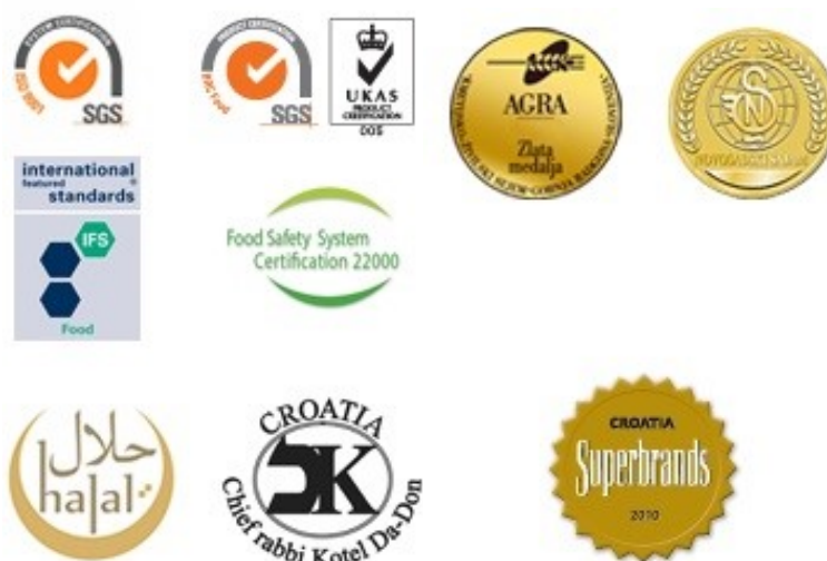
Slika 2. Certifikati i nagrade Vindije

Certifikate koje je Vindija dobila je certifikat za upravljanje kvalitetom ISO 9001:2015, HAACP za kontrolu kritičnih točaka u proizvodnji, SSOP za standardizaciju svih postupaka sanacije (Slika 2.). Također Vindijina pekarnica Latica certificirala je FFSC standard ( Food Safety System Certification ). Uz navedene certifikate, Vindija je uvela i IFS ( International Food Standard ) i BRC ( British Retail Consortium ).