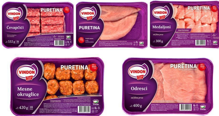
Slika 7. Puretina i pureće prerađevine