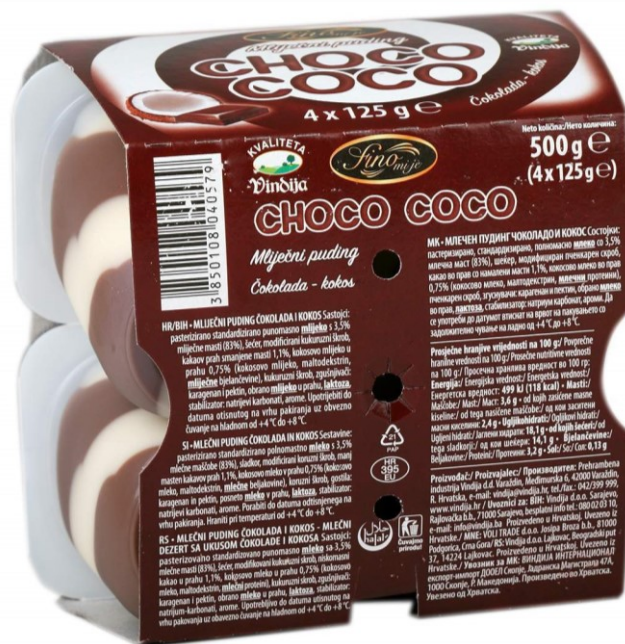
Slika 10. Označavanje i ambalaža Fino mi je Choco Coco mliječnog pudinga