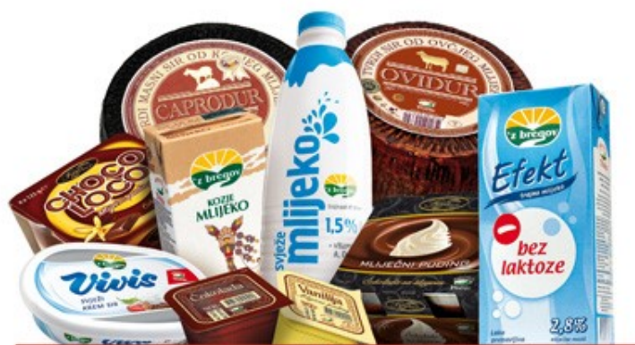
Slika 5. Mliječni proizvodi