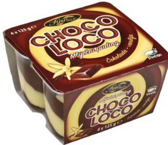
Slika 7. Fino mi je Choco Loco mlijecni puding vanilija i čokolada

kojom je konkretan proizvod svake godine za sva svojstva ocijenjen najvišim mogućim ocjenama. Navedena ocjena je potvrda iznimne kvalitete ovog proizvoda (Slika 7.).