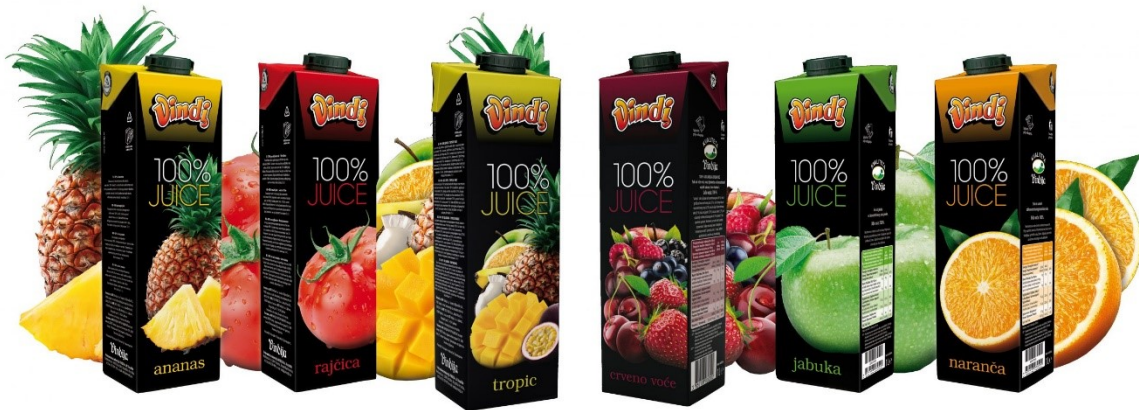
Slika 14. Vindi 100% juice sokovi

Kao i kod proizvoda Choco Loco, Vindija stavlja na tržište te izvozi više okusa stopostotnih sokova.