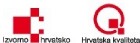
Slika 3. Certifikati Vindije