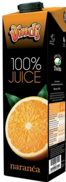
Slika 11. Vindi 100% juice naranča sok