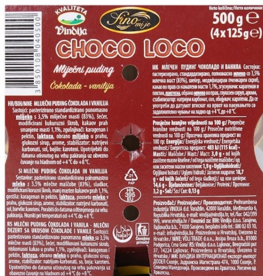
Slika 8. Označavanje Fino mi je Choco Loco mlijecnog pudinga