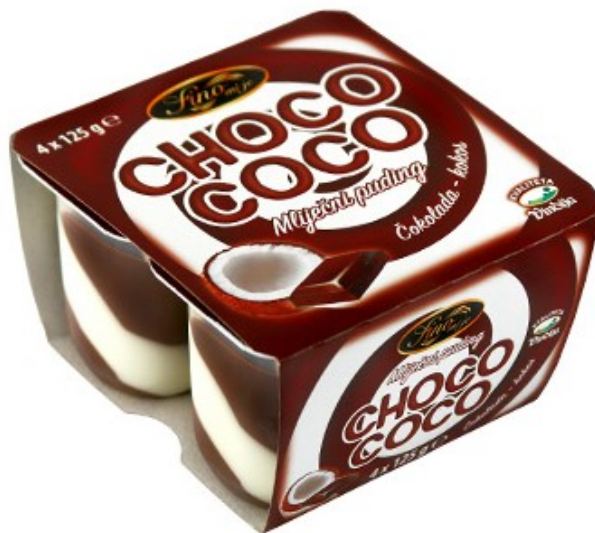
Slika 9. Fino mi je Choco Coco mlijecni puding kokos i čokolada

Osim uobičajenog okusa vanilije i čokolade, Vindija je proizvela i Choco Coco (Slika 9.).