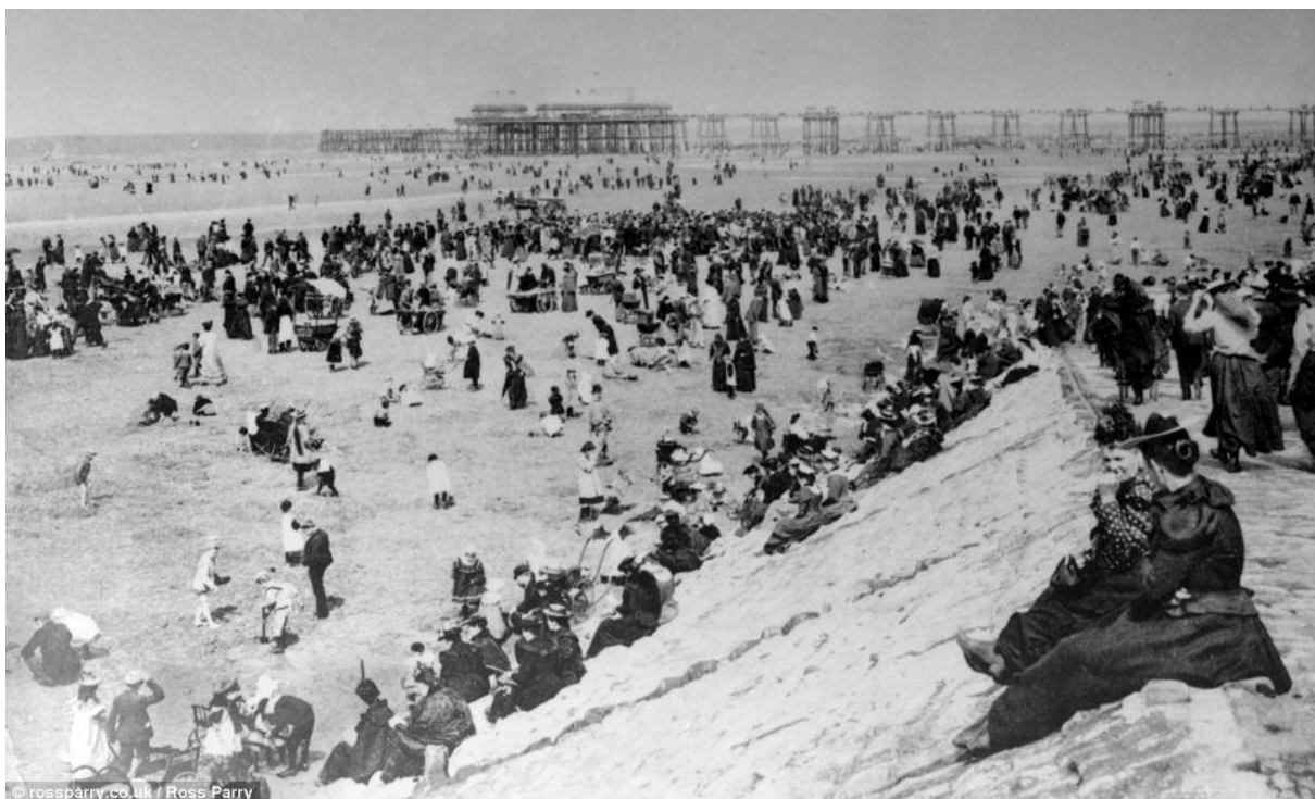
Slika 1. Radničko okupljalište Blackpool 1895. godine