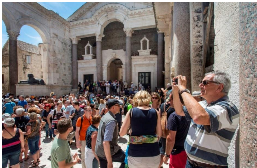
Slika 5.: Turisti ispred Dioklecijanove palače