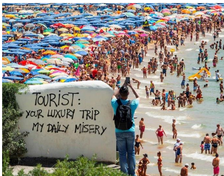
Slika 3.: Antituristički grafit ispred plaže u Barceloni