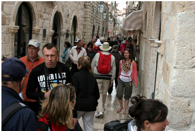
Slika 1.: Turisti u Dubrovniku