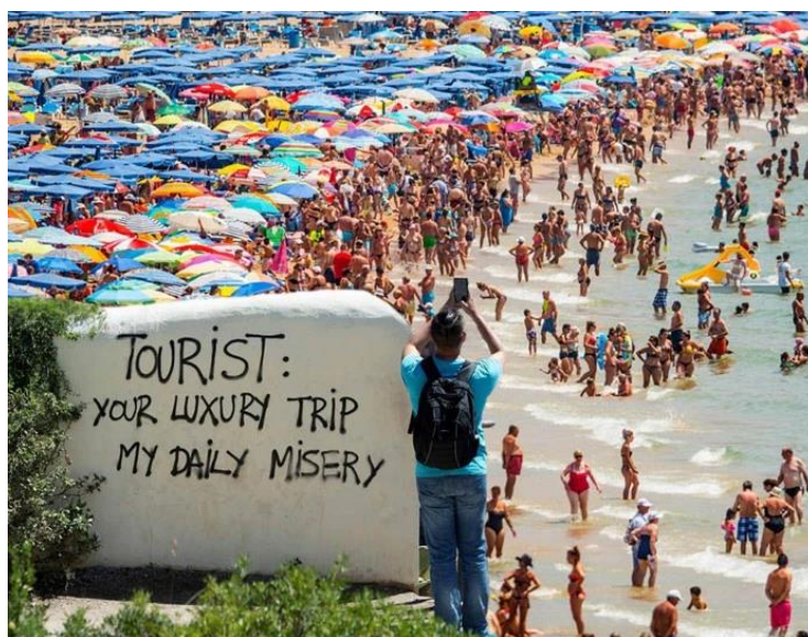
Slika 3.: Antituristički grafit ispred plaže u Barceloni