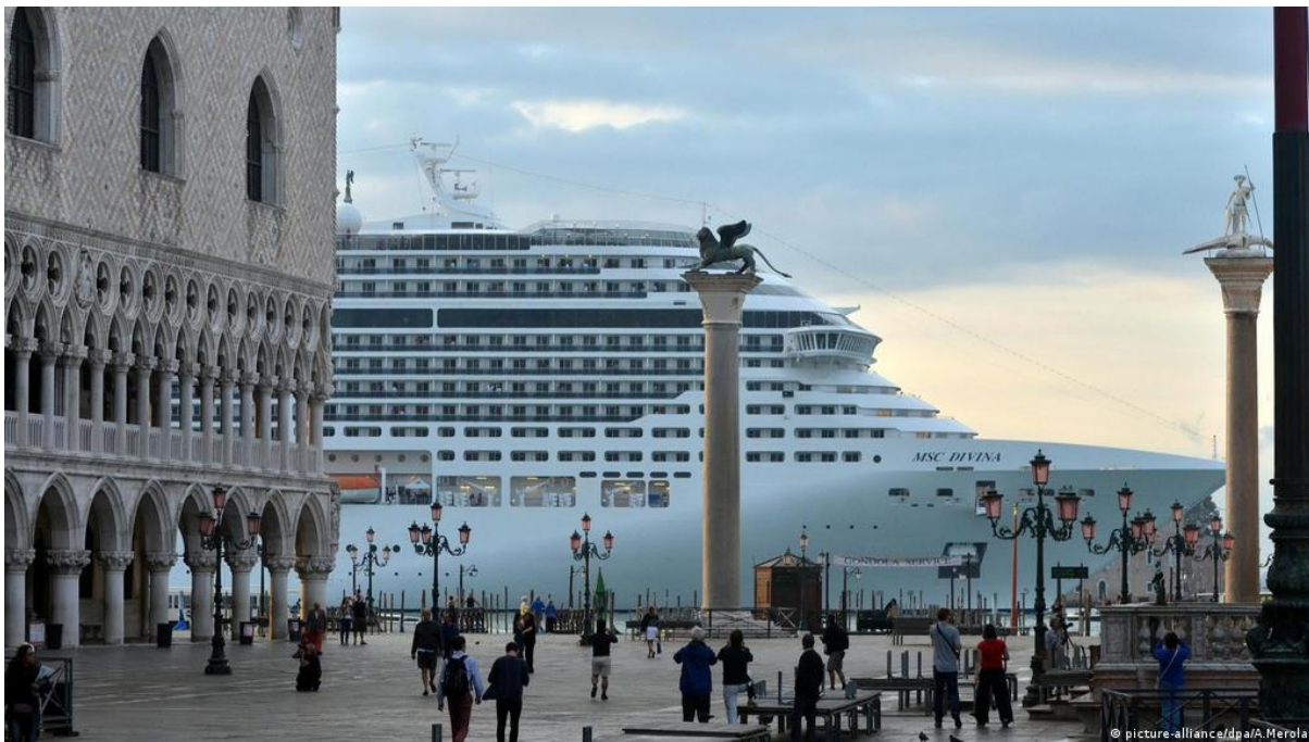
Slika 2.: Prolazak kruzera ispred Trga Svetog Marka