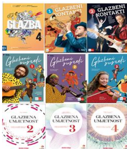
Slika br.4, Udžbenici za Glazbenu umjetnost 17