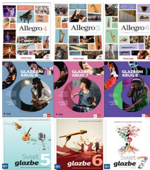
Slika br.2, Udžbenici za Glazbenu kulturu 15