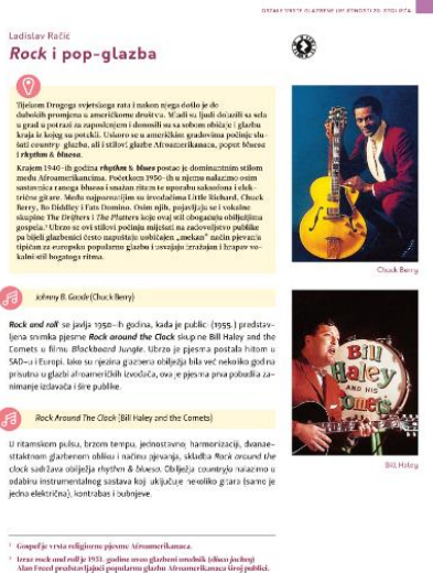
Slika br.3, Poglavlje iz udžbenika Glazbena umjetnost 4 (Školska knjiga) 16

Udžbenici za Glazbenu umjetnost (u četvrtom razredu) sadrže poglavlja posvećena popularnoj glazbi. Osim povijesnog presjeka popularne glazbe, udžbenici sadrže prijedloge za slušanje te osmišljena pitanja, zadatke i dodatne aktivnosti. Svojevrсна problematika su gimnazijski programi, po kojima je obrada popularne glazbe predviđena za kraj četvrtog razreda, koje za učenike maturante predstavlja stresno razdoblje pred maturu.