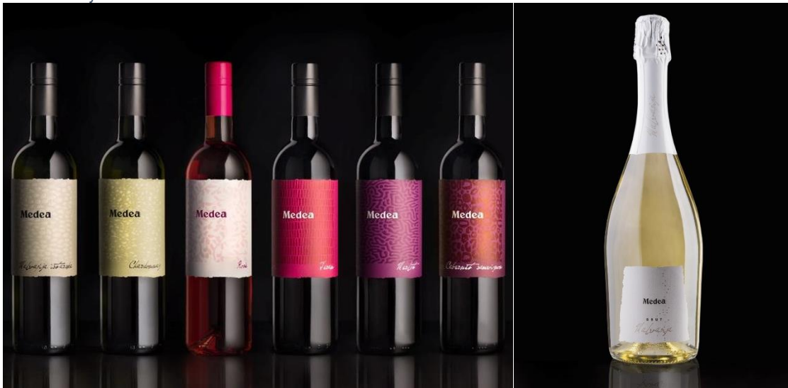
Slika 9. Linija Medea vina