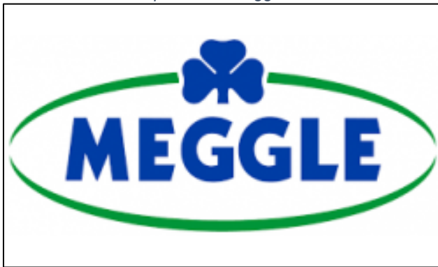
Slika 2. Znak marke poduzeća Meggle