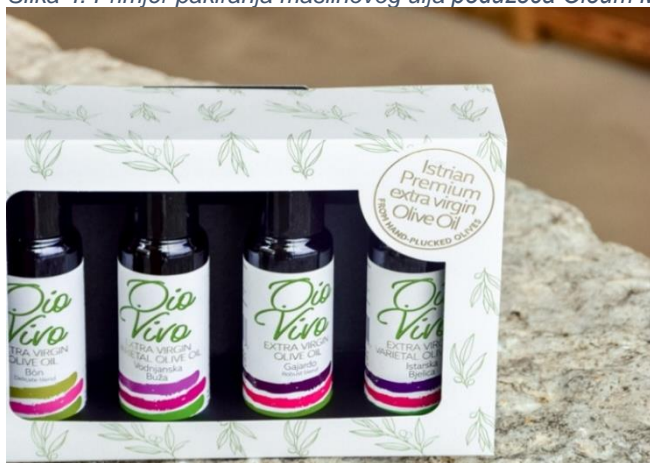
Slika 4. Primjer pakiranja maslinovog ulja poduzeća Oleum Maris

Izvor 5. Budi dobro, "Oio Vivo: istarsko ekstra djevičansko maslinovo ulje koje jača i slavi život u nama", dostupno na: http://budidobro.com/oio-vivo-istarsko-ekstra-djevicansko-maslinovo-ulje/ (pristupljeno 10.04.2022.)