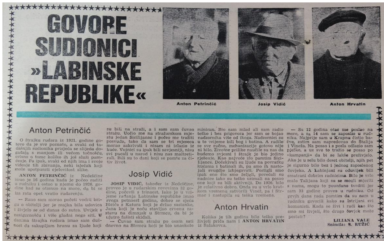
Slika 10. Kolumna "Govore sudionici 'Labinske republike' "