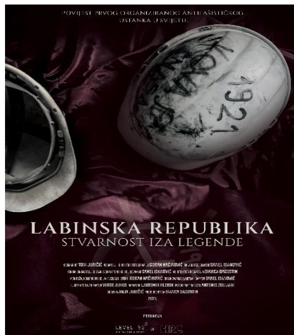
Slika 28. Službeni promotivni materijal za film