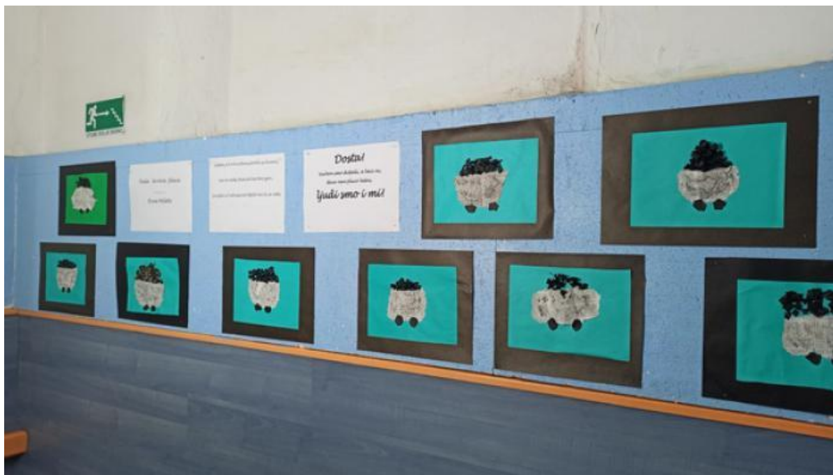
Slika 21. Neki od učeničkih radova na tematiku rudarske baštine

tijekom obljetnice posjećivali mjesta od posebnog značaja za rudarsku prošlost, kao što su tzv. šoht, "Krvova placa" i ostali. Djeca predaka koji su radili u rudniku su prenosila iskustva svojih djedova i pradjedova o kojima su ih učili roditelji te su si kroz kvizove na atraktivan način prenosili saznanja. U školama su se prikazivali dokumentarni filmovi te su često kao gosti predavači bili pozivani entuzijasti i povjesničari upoznati s tematikom Labinske republike i labinskog bazena ugljena.