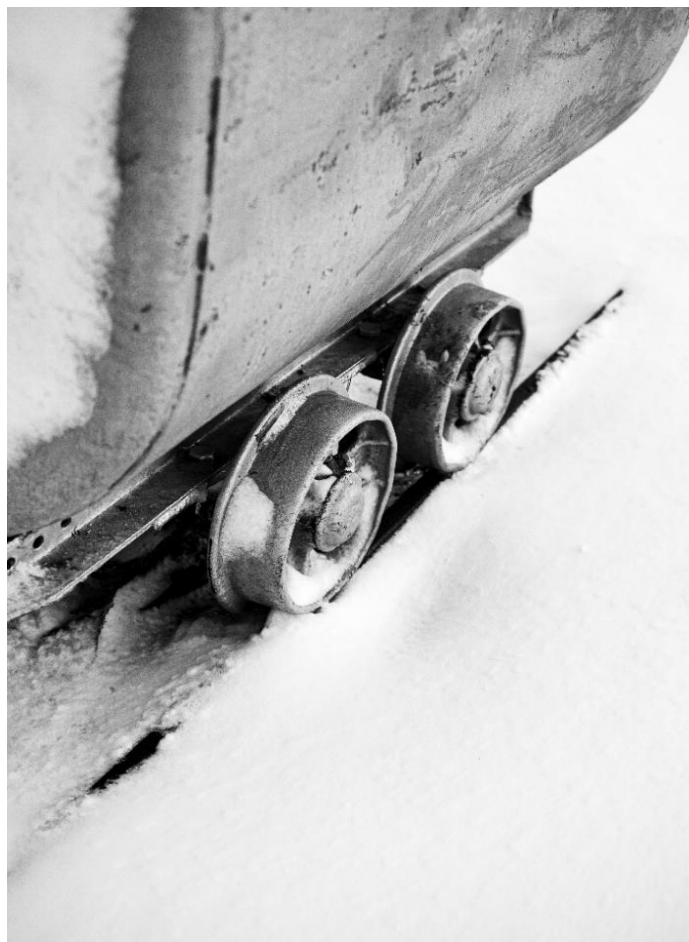
Slika 23. Fotografski doprinos lokalnome natječaju autora diplomskog rada