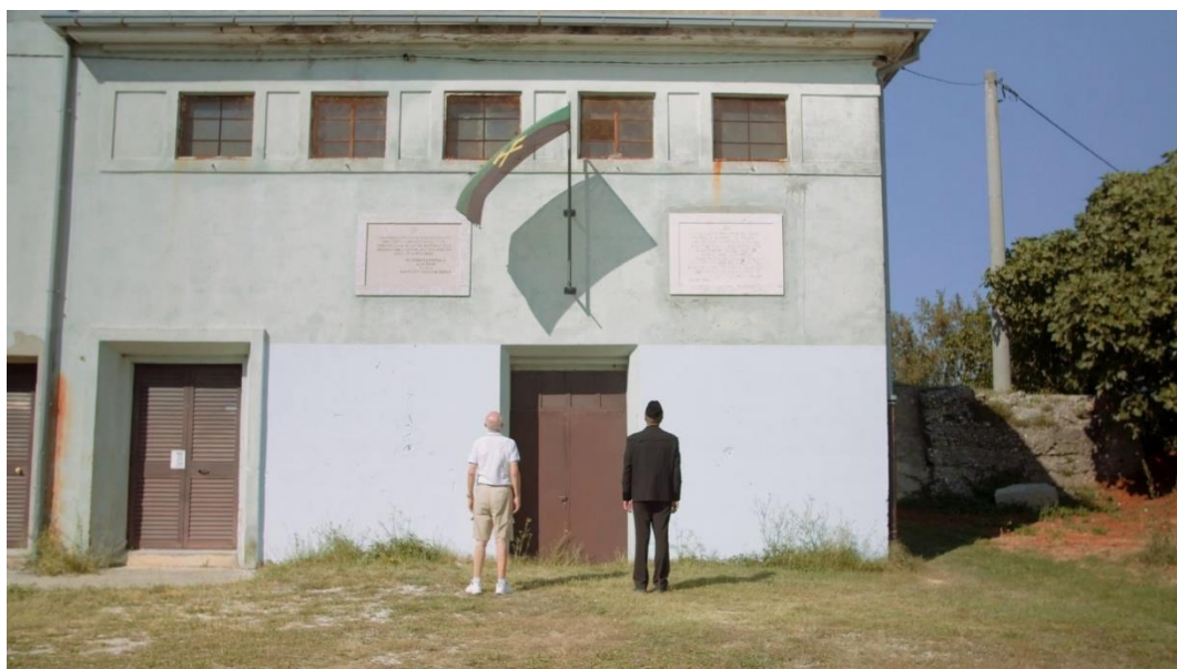
Slika 26. Isječak iz filma "Labinska republika: stvarnost iza legende"

odjednom pojavljuje rudar koji je očito zamišljen kao imaginarna figura kojom je redatelj vjerojatno želio ukazati na autentičnost lokacije otkud je sve počelo (Slika 26.). Nakon uvodne tri minute narativ preuzima Tullio Vorano, umirovljeni povjesničar i autor brojnih publikacija o labinskoj rudarskoj povijesti koji govori o različitim internacionalnim upravama koje su se izmjenjivale u vlasti na području Labina.