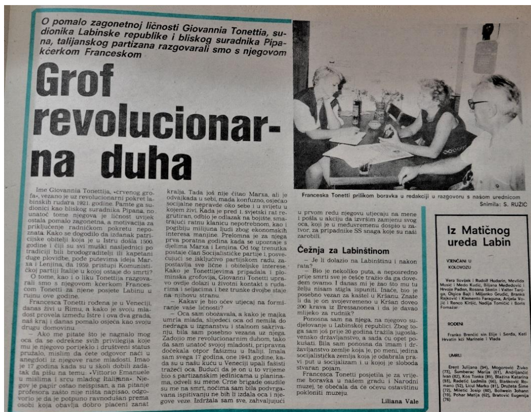
Slika 19. Članak iz broja 76

U broju 76 se za razliku od dosadašnjih sugovornika Liliane Vale koji su bili aktivni sudionici pobune pojavljuje potomkinja jednog od njih i to Francesca Tonetti, kćer "conte rosso-a" 30 kako su zvali Giovannija Tonettija.