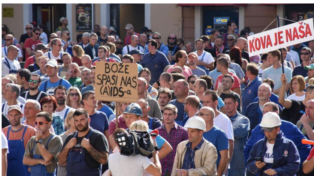
Slika 2. Prosvjed radnika Uljanika. Na fotografiji je vidljiv i natpis "Kova je naša", najpoznatija krilatica pobunjenih rudara iz vremena Labinske republike