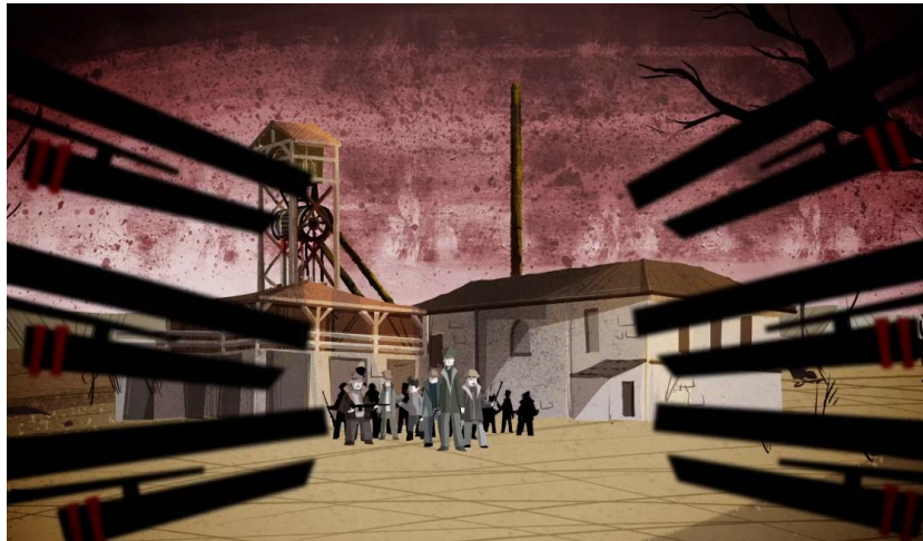
Slika 27. Isječak iz filma "Labinska republika: stvarnost iza legende"

Ispitanik potvrđuje autorovu procjenu kako su građani Labina uglavnom slabo upoznati s rudarskim nasljeđem. Nedovoljno se o tome uči u školama, medijski se poprati uglavnom kod obljetnice Labinske republike i nekakav opći dojam je da među Labinjanima osim kod istraživača i nema nekog pretjeranog interesa za revitalizacijom rudarske baštine.