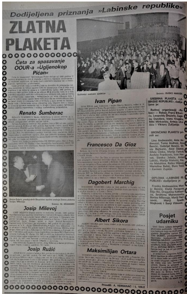
Slika 13. Članak iz broja 65