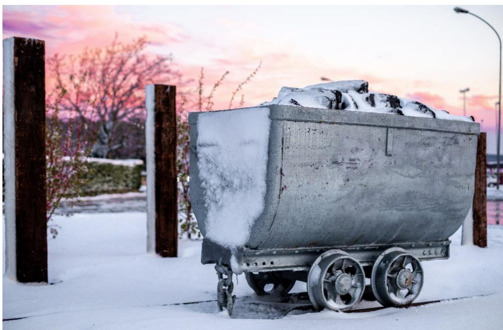
Slika 24. Fotografski doprinos lokalnome natječaju autora diplomskog rada