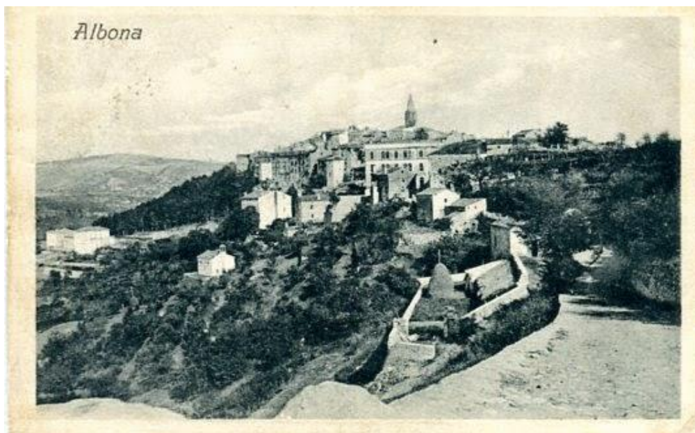
Slika 1. Razglednica s motivom Labina iz razdoblja ranih dvadesetih godina 20.st.