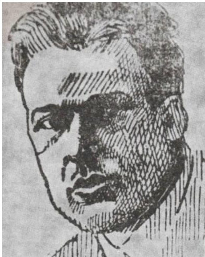
Slika 4. Giovanni Pippan