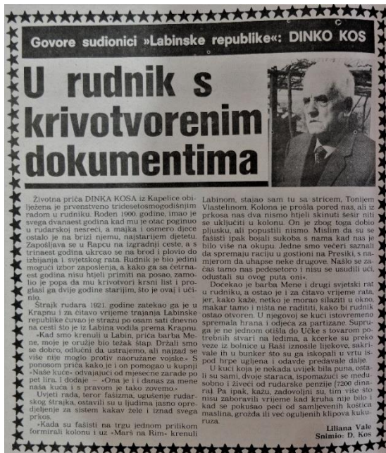
Slika 14. Kolumna "Govore sudionici 'Labinske republike'"