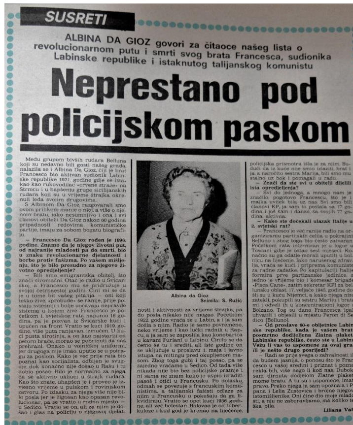
Slika 20. Članak iz broja 77