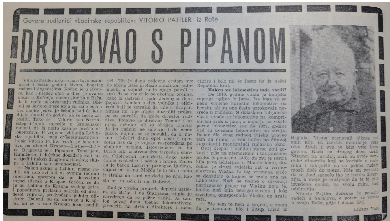
Slika 12. Kolumna "Govore sudionici 'Labinske republike'" br. 64