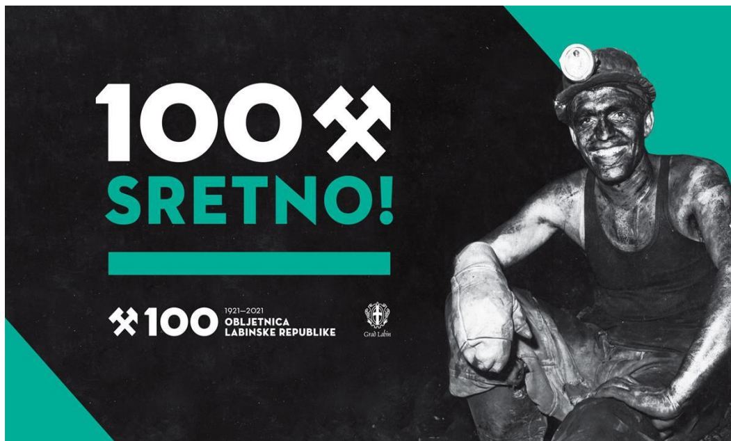
Slika 25. Promo plakat sa službenim sloganom na kojem su vidljive dominantne boje (crna i zelena) po kojima je mnogima poznat labinski identitet