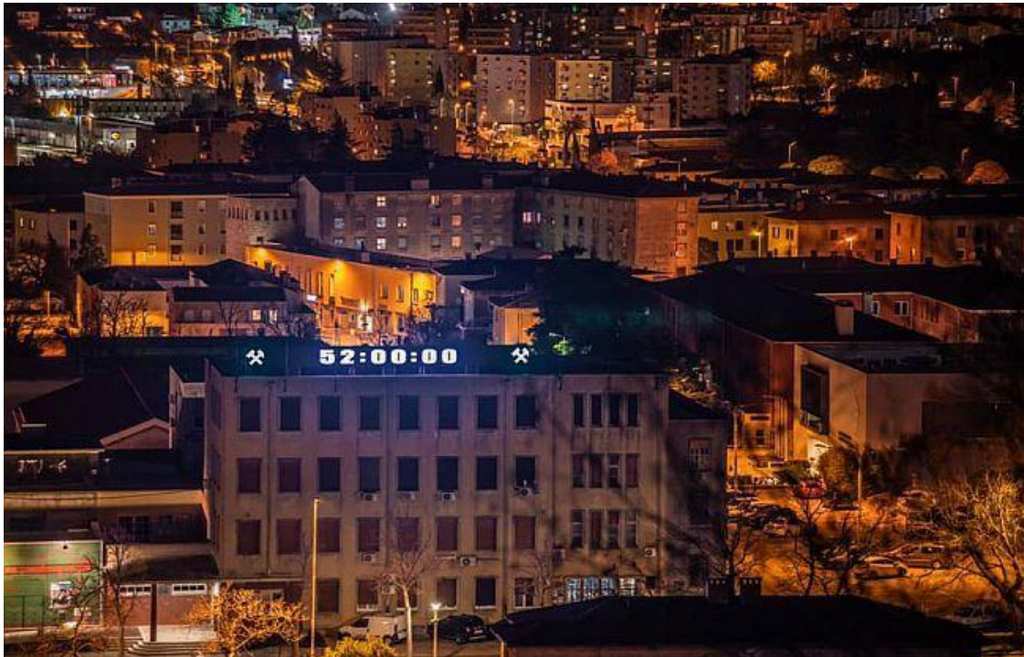
Slika 22. Sat postavljen u Labinu koji je odbrojavao dane do obljetnice