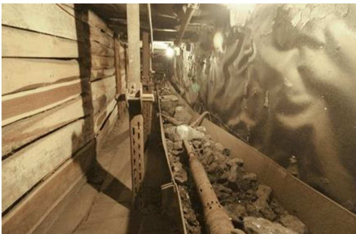
Slika 8. Replika rudarskih hodnika u labinskom muzeju

U zadnjem dijelu rudnika prikazan je primjer starog načina kopanja 19. stoljeća jednostavnim ručnim alatom. Cjelokupnom dojmu pridonose prateći izvorni zvukovi snimljeni u originalnom rudniku." 26