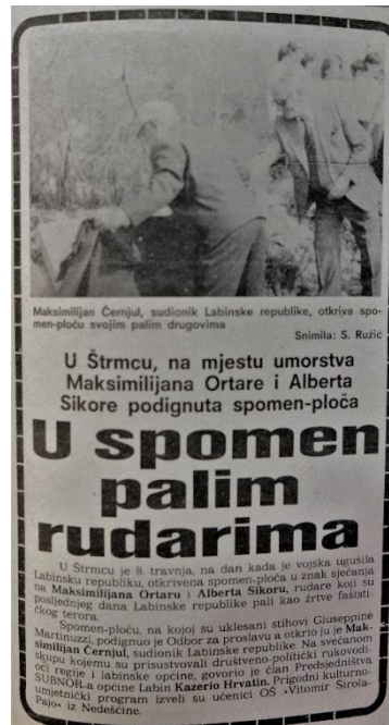
Slika 16. Članak iz broja 67

ubijenih rudara za vrijeme Labinske republike. U članku ispod vidljivo je kako je upravo on otkrio spomen ploču palim suborcima (Slika 16.).