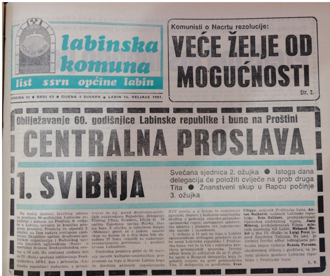
Slika 9. Naslovna strana broja 63