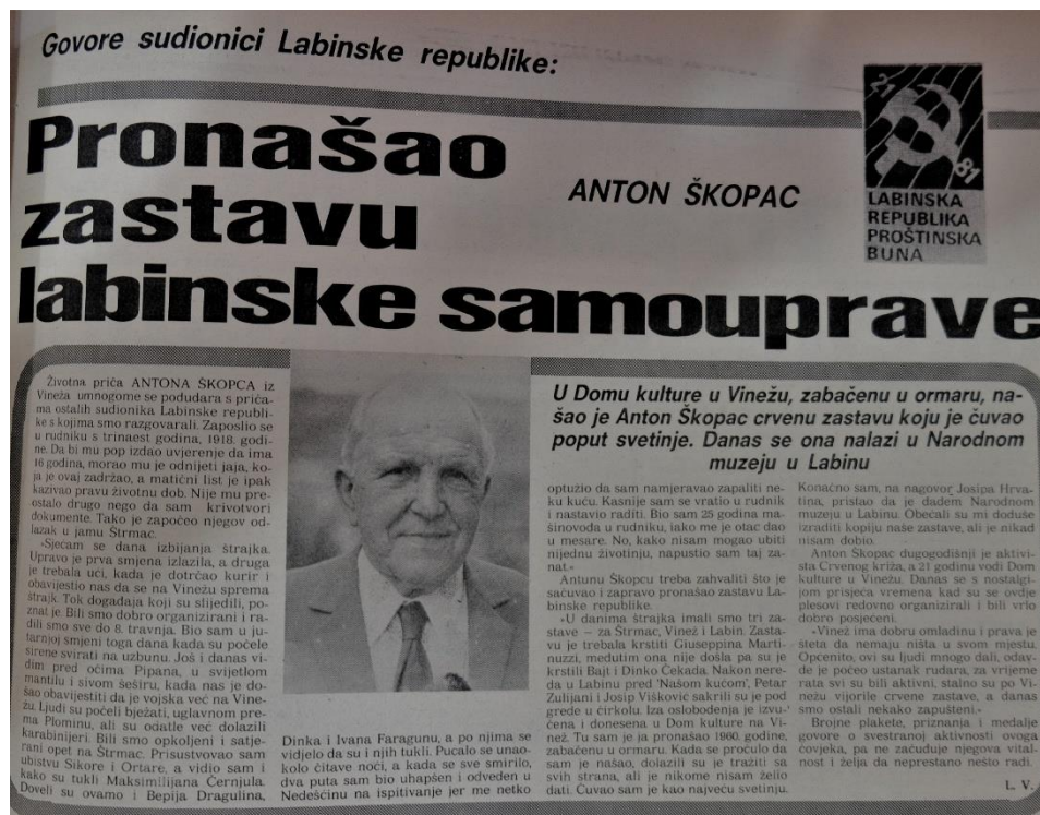
Slika 17. Kolumna "Govore sudionici 'Labinske republike'"