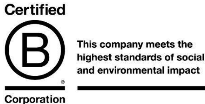
Slika 1 : Oznaka certificirane B korporacije