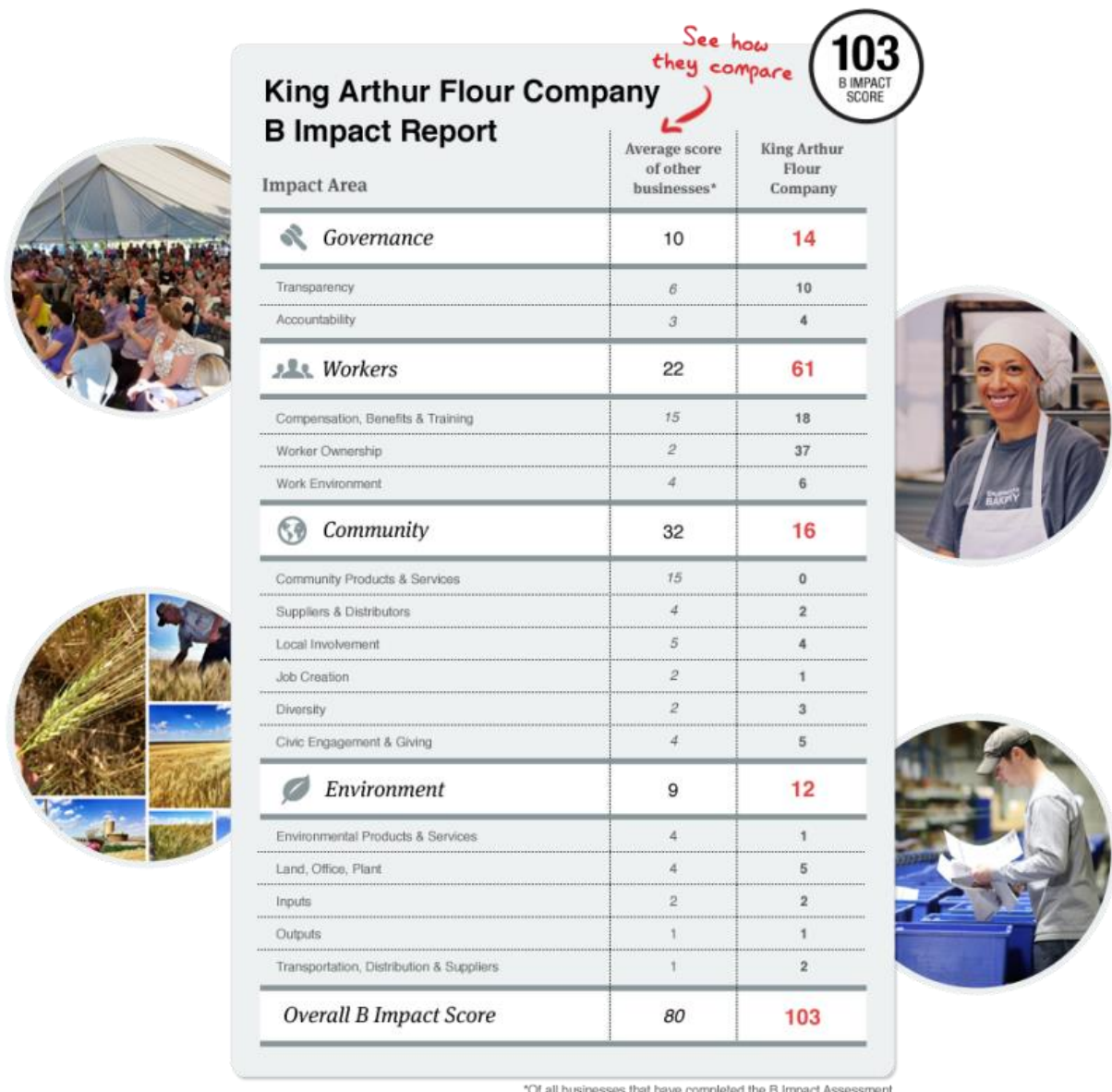
Slika 4 : Usporedba utjecaja korporacije King Arthur koja proizvodi brašno u odnosu na ostale korporacije koje su prošle B Impact Assessment