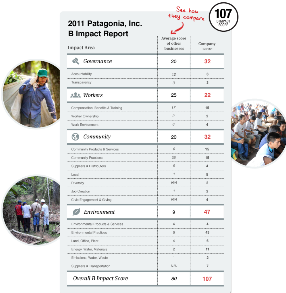
Slika 3 : Primjer izvješća certificirane B korporacije PATAGONIA