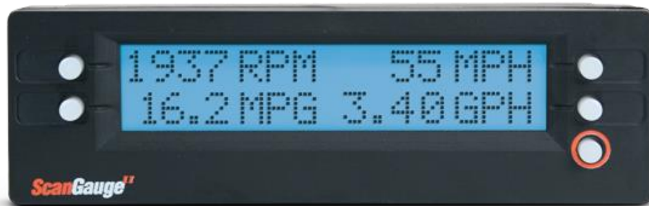
Slika 3 - ScanGauge II

vrijeme bio jedini lako instaliran (putem OBDII 7 ) pribor koji je radio kao putno računalo, 4 istovremena digitalna mjerača i dijagnostički čitač kodova problema. Ovaj uređaj ima na raspolaganju 12 različitih mjerenja koja se mogu koristiti kao 4 digitalna mjerača. Mjerne jedinice se mogu nezavisno odabrati između mi/km, gal/l, °C/°F i PSI/kPa.