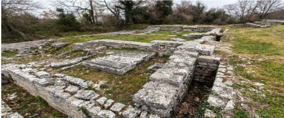
Slika 2.: Nezakcij