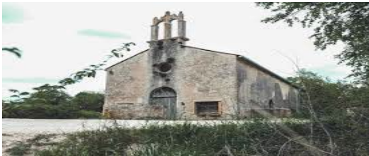
Slika 3.: Svetica (Monte Madonna)