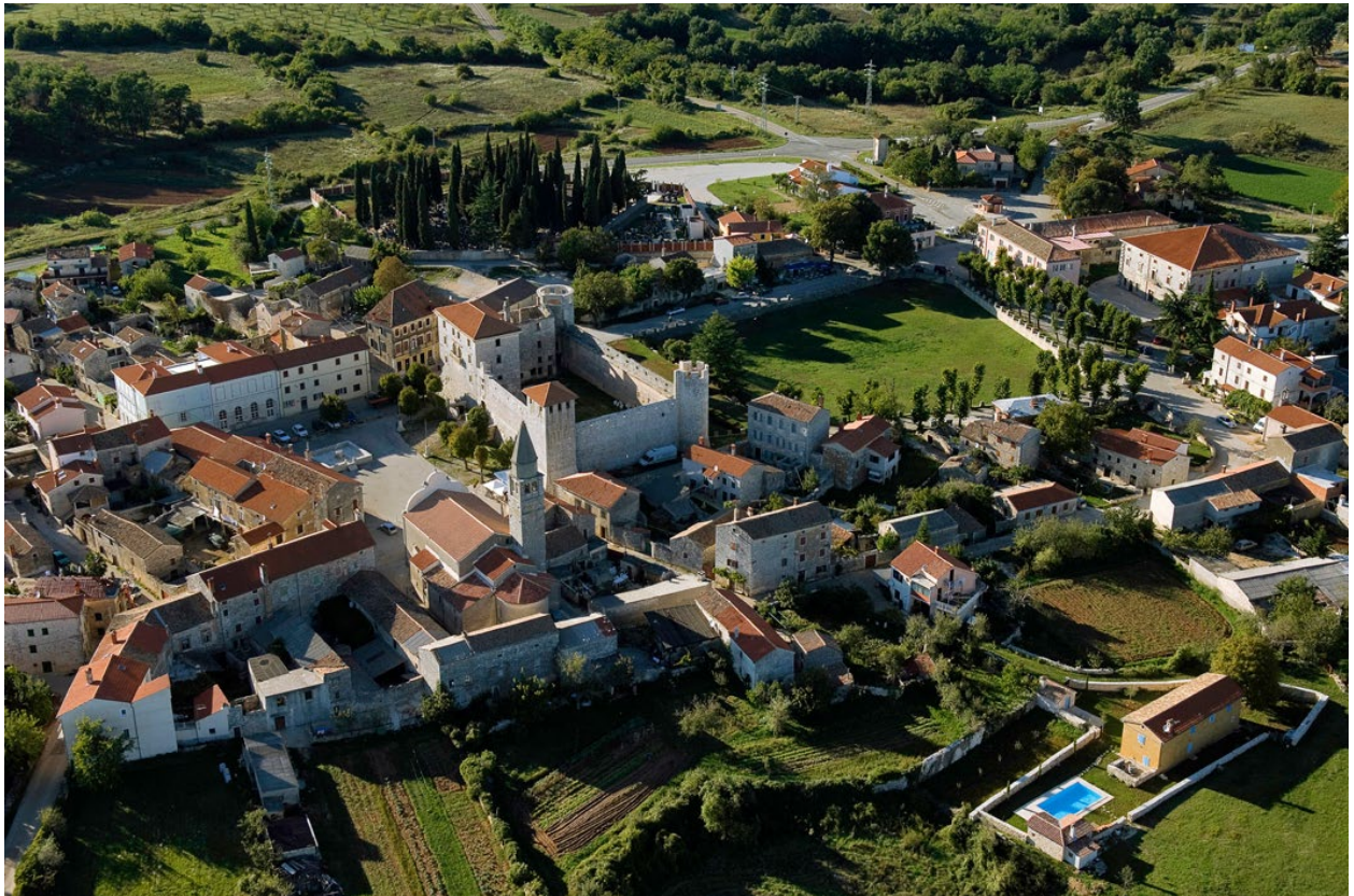
Slika 5. Kaštel Morosini-Grimani