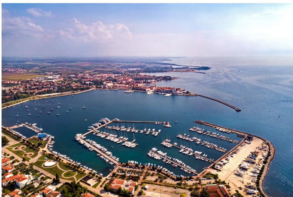
Slika 10. ACI Marina Umag