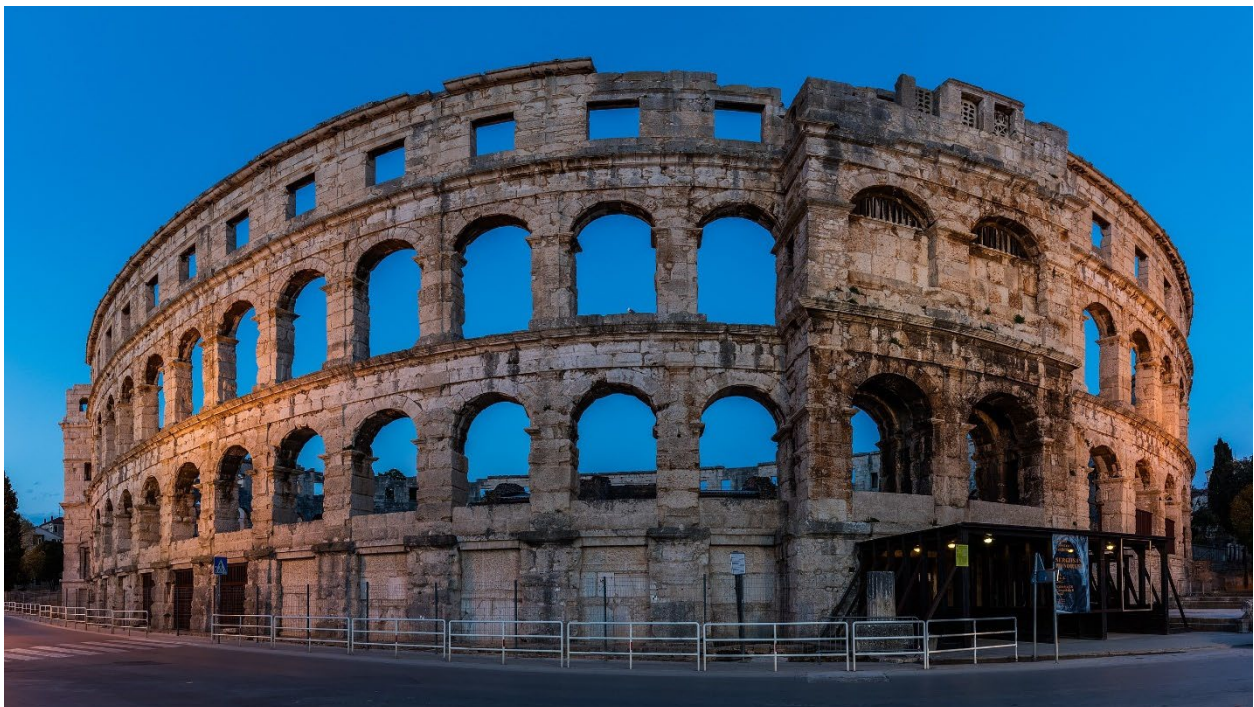
Slika 3.: Amfiteatar u Puli