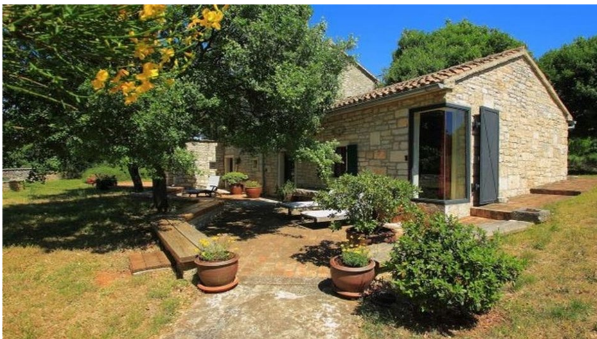
Slika 2. Istarska stancija, Rovinj 0170