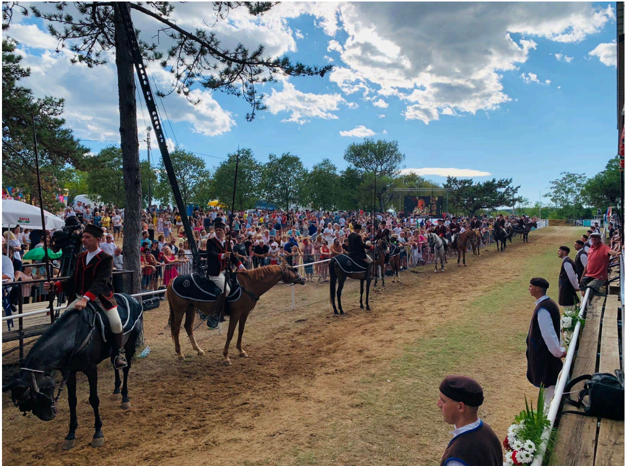
Slika 7.: Trka na Prstenac – Barban