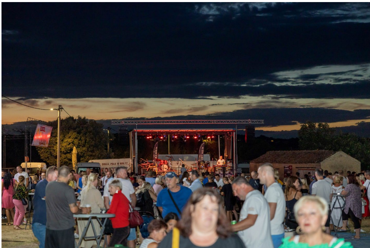
Slika 6.: Ližnjanska noć – 2022.