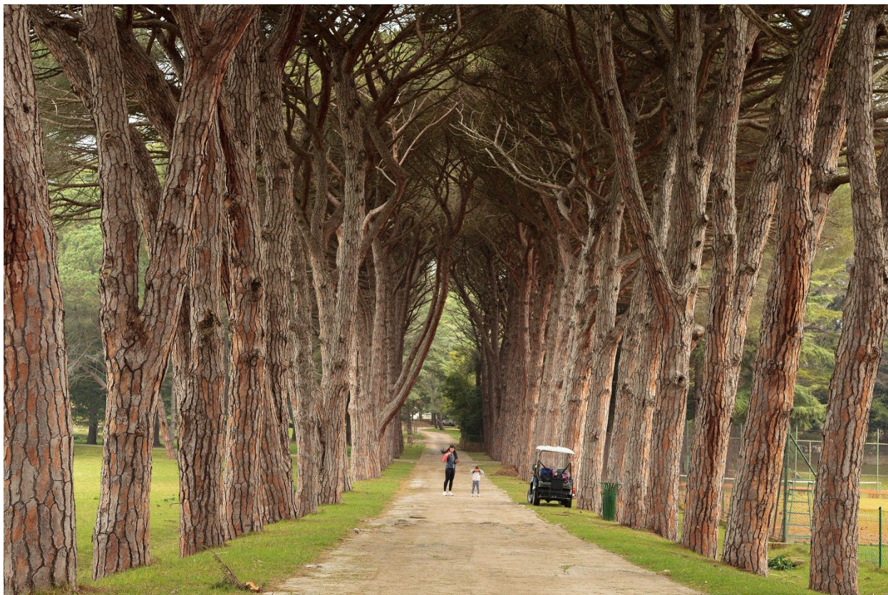
Slika 4.: Drvored borova na Brijunima