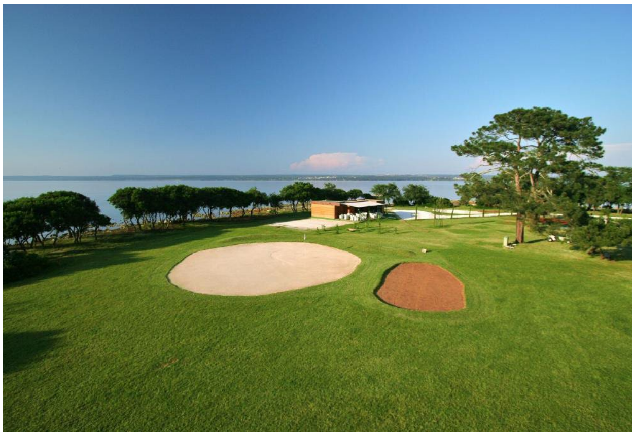
Slika 8. Golf igralište Brijuni