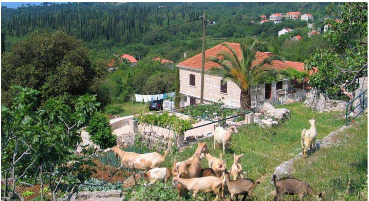
Slika 11.: Agroturizam u Konavlima - Farm Stay Katarina Bakićevo