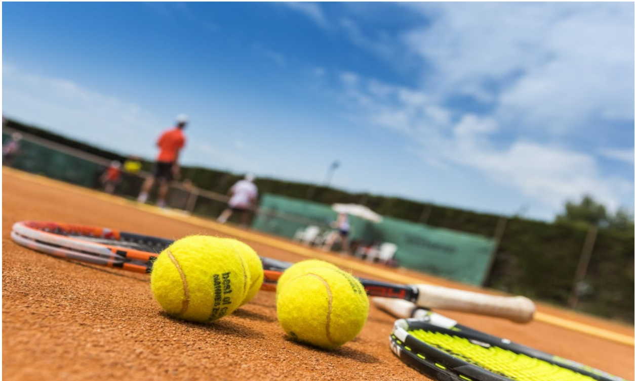
Slika 9. Teniski tereni: Umag