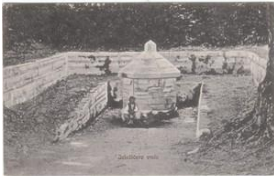
Slika 3. Jelačićevo vrelo

novi razvoj naselja temeljenog na korištenju termalne vode u medicinske svrhe. 32 Francuzi su za kratkog vremena svoje vladavine od 1809. do 1813. nastavili s uređenjem kupki. Franjo I., austrijski i rimsko-njemački car 24. lipnja 1818. posjećuje Topusko i daje lječilištu glavni poticaj odnosno sredstva bečkog dvora iz blagajne Državnog ratnog vijeća u Beču za izgradnju lječilišta te sredinom 19. stoljeća Topusko postaje jedno od najpoznatijih lječilišnih destinacija u Habsburškoj Monarhiji. 33 Medicinska akademija u Beču 1826. potvrđuje ljekovita svojstva vode u Topuskom te mu daju status ljekovitih voda. Koristili su se bazeni i kaptaže iz rimskih vremena, a kupalište se počelo razvijati oko izvora u Spiegelbadu. Sredinom 19. stoljeća raste interes za blatne kupke pa se središte mjesta seli na današnji položaj te se ondje razvijaju novi i veći kapaciteti. Topusko je svoj procvat doživio tijekom Vojne krajine kada je lječilište dobilo novoizgrađene zgrade za smještaj gostiju. Izgrađen je dom I., dom II., blatne kupke, vojne kupke, bistre kupke i lječilišna restauracija. Paralelno s ovom izgradnjom uređene su parkovi, šetnice i vrela. Uređen je park Opatovina s portalom crkve Blažene Djevice Marije te Jelačić vrelo u Velikoj Vranovini, Benkovo vrelo u Hrvatskom selu i Mollinaryjevo vrelo u Topuskom. 34 Jelačićevo vrelo prikazano je na slici broj 3.