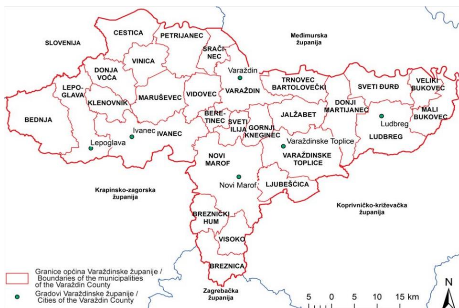
Slika 1: Geografski položaj Varaždinske županije