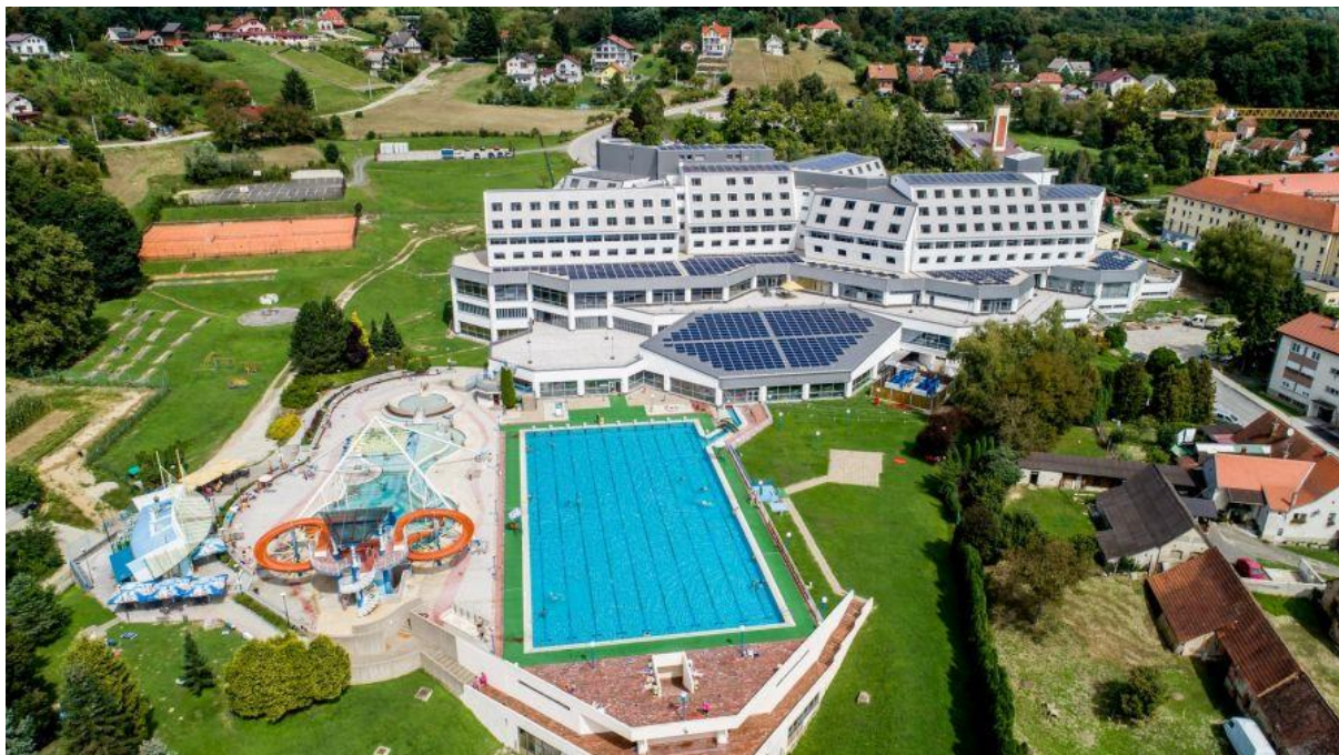
Slika 3: Specijalna bolnica za medicinsku rehabilitaciju Varaždinske Toplice