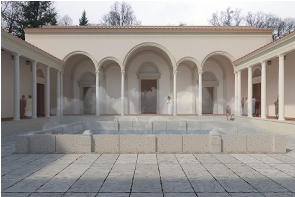
Slika 2: Digitalni prikaz rimske kupališne arhitekture Varaždinskih toplica