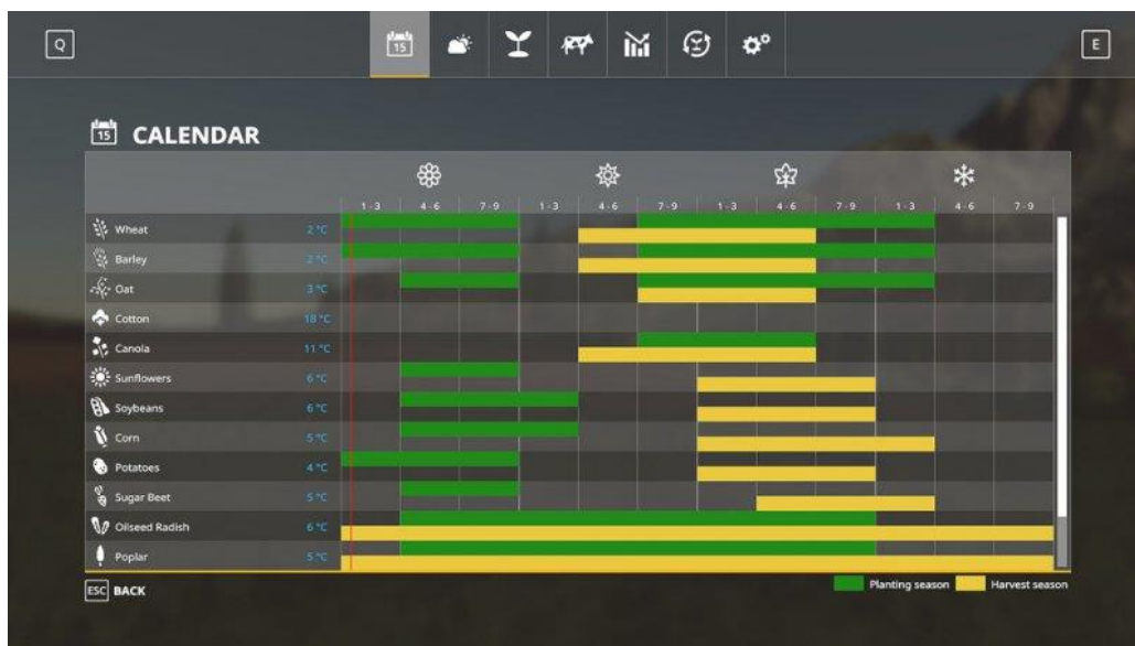
Slika 13. Prikaz kalendara sijenja i žetve

U igri se može posaditi i uzgajati 13 različitih biljaka. Sve biljke se razlikuju po cijeni, vremenu kada se sade te ubiru i također po izgledu, ali sve je moguće uzgojiti, ubrati i prodati za profit. Tržište se mijenja s vremenom, godišnjim dobom te prema tome koliko je prodano usjeva (zato je potrebno saditi razne vrste biljaka kako bi dobit uvijek bila veća). Biljke se mogu saditi, fertilizirati, plijeviti korov oko njih te ubirati. Za početak potrebno je pogledati kalendar na kojem se može vidjeti koja biljka se sadi u koje godišnje doba te kada se može ubrati. Zelena crta pokazuje vrijeme sadenja, a žuta crta vrijeme branja. Kalendar se nalazi na Slici 13.