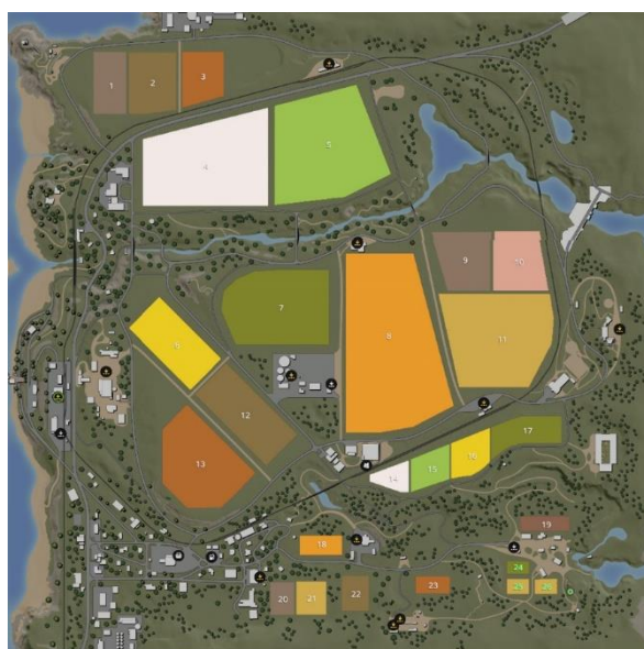
Slika 12. Prikaz mape Ravenport

Mapa je napravljena prema američkom stilu gradnje. Smještena je u jugozapadni dio Sjedinjenih Američkih Država u južnu Kaliforniju. Ravenport se nalazi na ravnici te sadrži nekoliko velikih polja i nekoliko malih. Mapu možemo vidjeti na Slici 12. ispod.