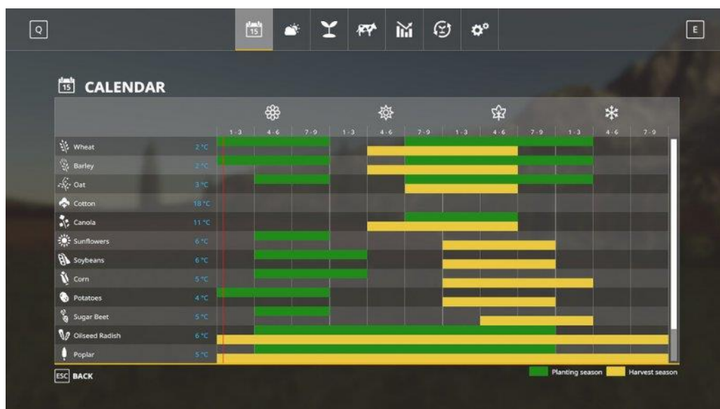
Slika 13. Prikaz kalendara sijanja i žetve

U igri se može posaditi i uzgajati 13 različitih biljaka. Sve biljke se razlikuju po cijeni, vremenu kada se sade te ubiru i također po izgledu, ali sve je moguće uzgojiti, ubrati i prodati za profit. Tržište se mijenja s vremenom, godišnjim dobom te prema tome koliko je prodano usjeva (zato je potrebno saditi razne vrste biljaka kako bi dobit uvijek bila veća). Biljke se mogu saditi, fertilizirati, plijeviti korov oko njih te ubirati. Za početak potrebno je pogledati kalendar na kojem se može vidjeti koja biljka se sadi u koje godišnje doba te kada se može ubrati. Zelena crta pokazuje vrijeme sađenja, a žuta crta vrijeme branja. Kalendar se nalazi na Slici 13.