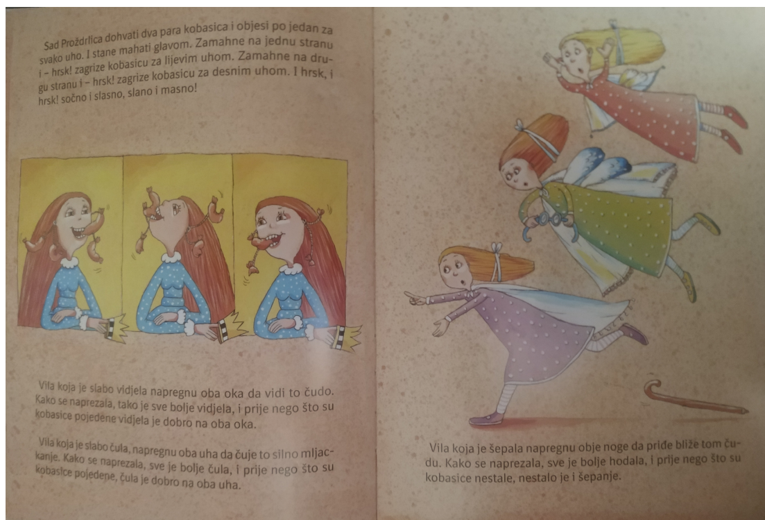
Slika 3. Proždrlica

Umjetnica pojačava prisutnost simbolike brojeva jer često crta po tri predmeta na plohi, npr. nacrtala je troja vrata, koja su naglašena u tekstu, ali je nacrtala i tri ovce iako u tekstu nije naznačen njihov broj. Na jednoj plohi su nacrtane tri vile (slika 3) i nailazimo na tri krune. Na početku možemo pratiti priču gledajući ilustracije, ne čitajući tekst jer nas umjetnica dobro uvodi u bajku.