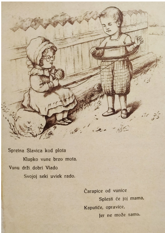
Slika 1. Realistična ilustracija

Majhut i Batinić (2017) ističu da se tek prije početka Prvog svjetskog rata pojavljuju ilustracije koje se očevidno obraćaju djeci. Razvoj tih crteža odvija se tijekom perioda secesije, početkom 20.stoljeća. Radovi postaju jednostavni, nisu akademsko realistični, bitna je konturna linija, odnosno linija koja ocrtava vanjski rub likova ili oblika, npr. livade, lica, kose, odjeće, itd. Trodimenzionalnost objekta i dubina se ukidaju, slika se na plohi ujednačene boje. Ilustracije su bile crtane u nizu i time privlačnije dječjoj publici, a prvi aspekt koji je upućivao na to je ilustracija namijenjena djeci bilo je prevladavanje crteža s likom djece. Za uvidjeti razvoj i razliku između realistične ilustracije (Slika 1) i secesijske ilustracije (Slika 2) priloženi su primjeri iz knjige Hrvatska slikovnica do 1945. autora Majhuta i Batinić (2017).