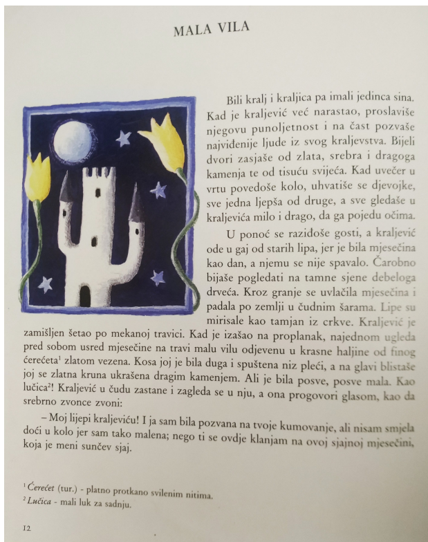
Slika 5. Pejzaž

Sljedeća ilustracija (Slika 6) prekriva cijelu stranicu i prati početni stil. Prevladava tamna boja, prikazani su mjesec i zvijezde, što upućuje na noć. U sredini slike nalazi se djevojka, anđeoskog lica, zlatne, duge kose, obučena u bijelo. Umjetnica prikazuje svoje viđenje Male vile , te upućuje da se vrijeme radnje događa u kasnu noć.