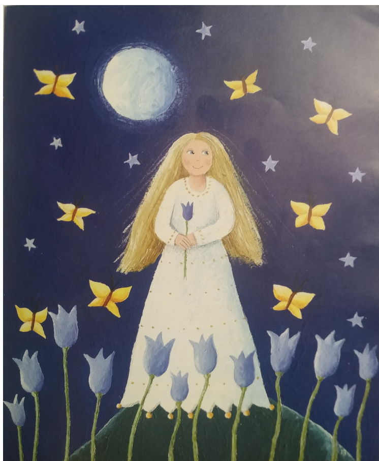
Slika 6. Mala vila

Iako prevladava tama i svijetlo-tamni kontrast, boje su ugodne, a slika pobuđuje toplinu. Tekst se nastavlja na još dvije stranice, gdje su na samom vrhu prikazane slike oblaka i zvijezda. Po ilustracijama, ništa ne upućuje na radnju bajke i bez teksta se bajka ne može razumjeti.