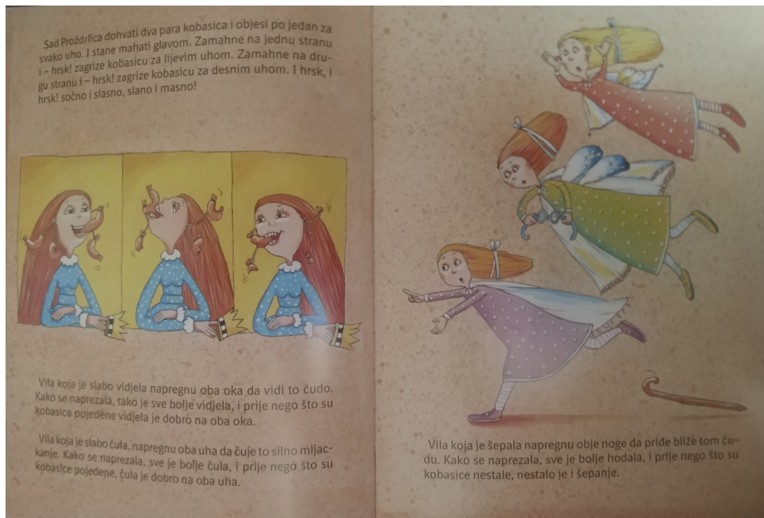
Slika 3. Proždrlica

Umjetnica pojačava prisutnost simbolike brojeva jer često crta po tri predmeta na plohi, npr. nacrtala je troja vrata, koja su naglašena u tekstu, ali je nacrtala i tri ovce iako u tekstu nije naznačen njihov broj. Na jednoj plohi su nacrtane tri vile (slika 3) i nailazimo na tri krune. Na početku možemo pratiti priču gledajući ilustracije, ne čitajući tekst jer nas umjetnica dobro uvodi u bajku.