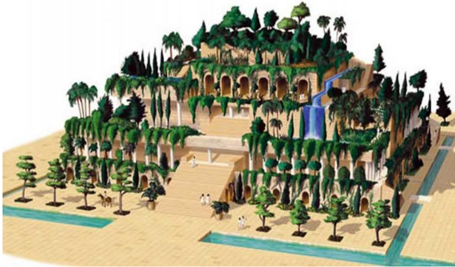
Slika 3. Babilonski viseći vrtovi.

Nakon Nebukadnezarove smrti, perzijski kralj Kir je zauzeo Malu Aziju i opkolio babilonsku državu sa svih strana. Na Iranskom visočju se uzdigla perzijska država. Kralj Kir je uništio babilonsku vojsku. Naime, Babilonci su bili svjesni da je Perzija jaka država i da im je bolje da budu s njome u dobrim odnosima zbog trgovine. Jedne večeri babilonska je vojska bila pozvana na svečanost i u gradu su ostali samo svećenici i trgovci. Kralj Kir je bez problema ušao na otvorena vrata kroz gradske zidine u Babilon i zbog vlastitih interesa svećenici su mu ga predali bez ikakve borbe. 26