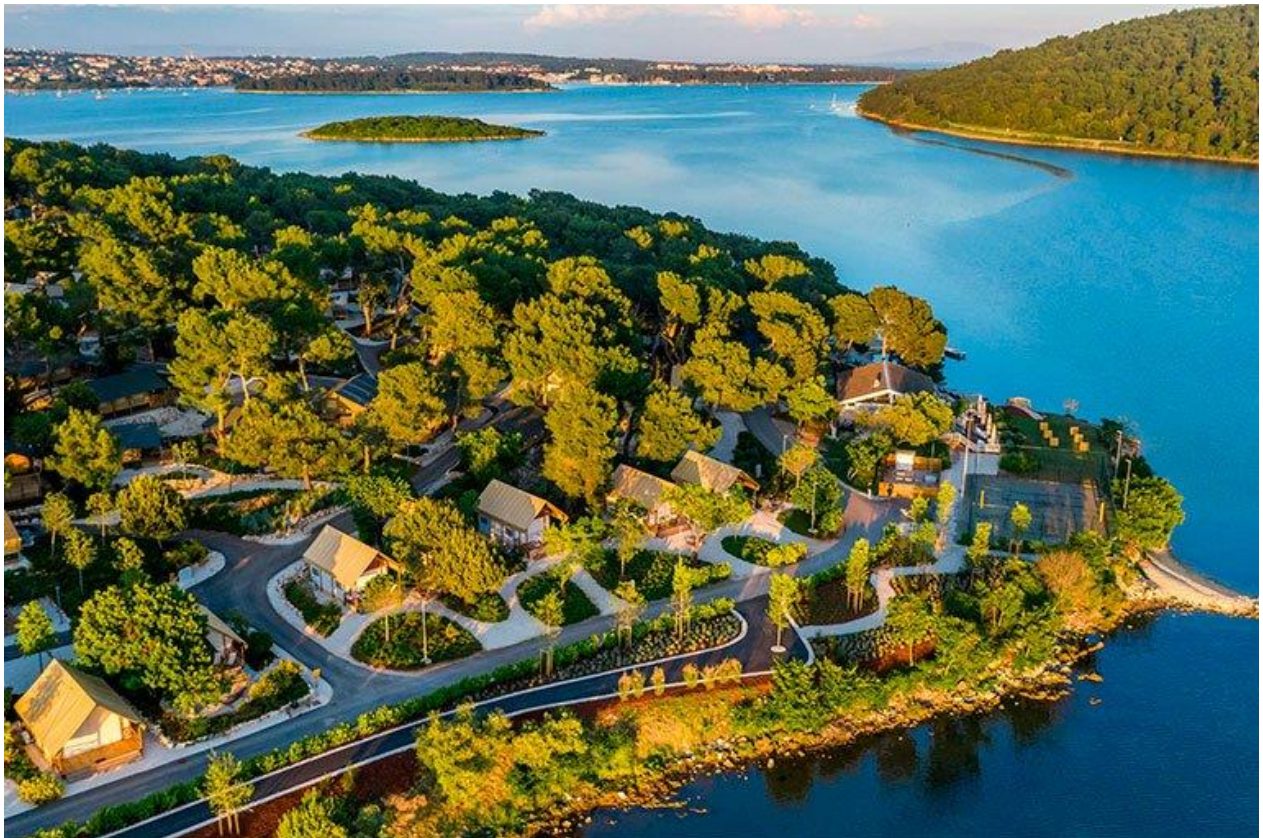
Slika 4 ARENA ONE 99 GLAMPING

3. „Bez obzira na super provedeno vrijeme i super iskustva koja sam prošla, sada u ovom trenutku se i ne bi vratila jer mi trenutačna pozicija i posao odgovara, ali svakako bih preporučila rad u glamping naselju jer je to neki poseban doživljaj i iskustvo koje se može samo tamo dobiti.“