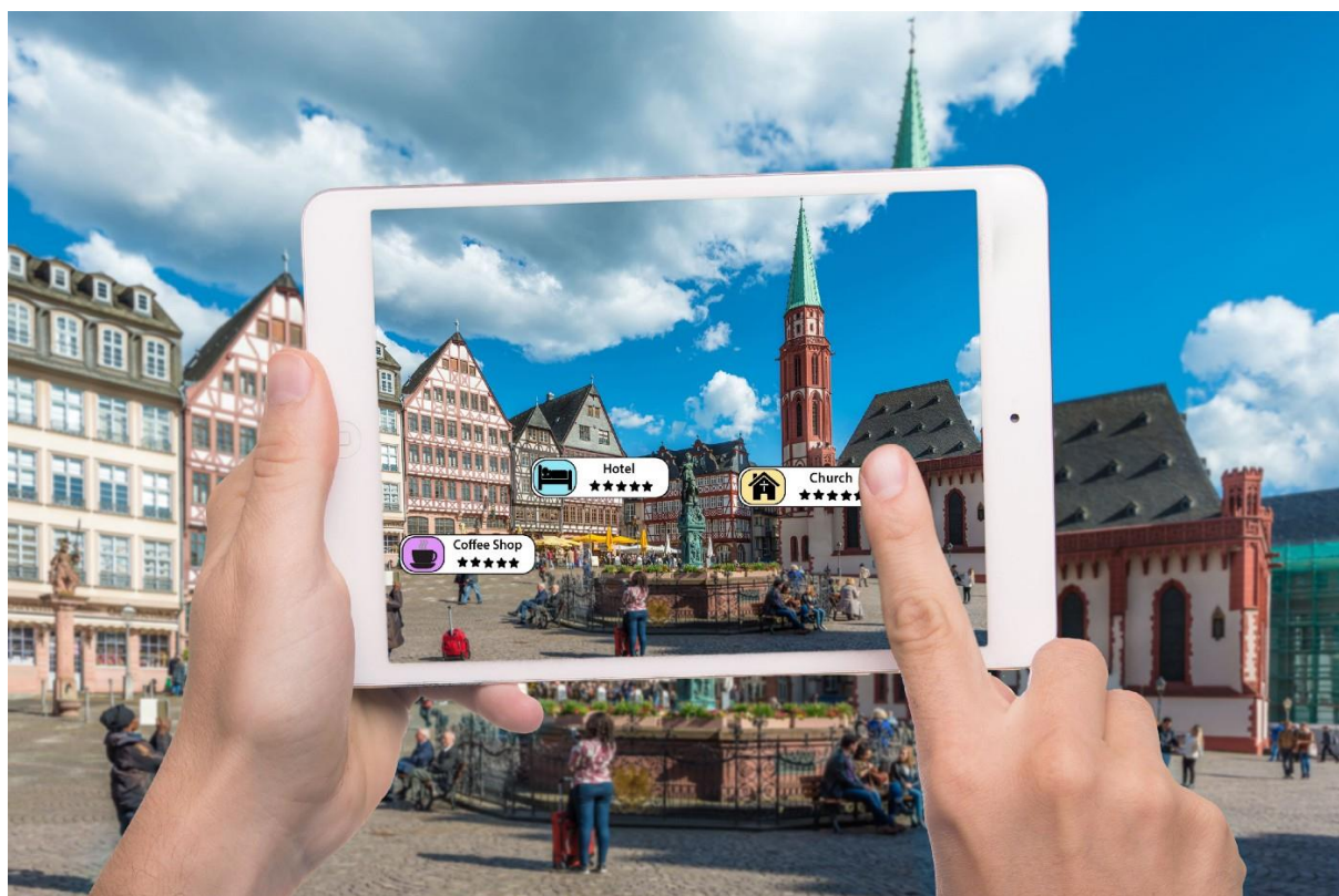
Slika 3 VR i AR promoviranje