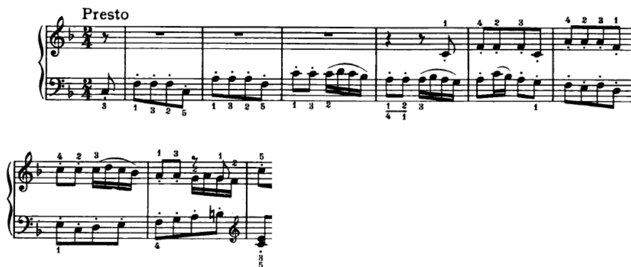
Slika 4.2.2. Tema u basu i imitacija u sopranu

Tema i „odgovor“ ovdje zajedno čine prvu temu ovog stavka koja je u osnovnom tonalitetu (Slika 4.2.2.). Kada nastupi imitacija teme u gornjem glasu, donji glas nastavlja s melodijskom linijom. Ovdje nećemo pričati o kontrasubjektu zato što takva karakterizacija ove melodijske linije nije potrebna, jer kako je već spomenuto ovdje se ne radi o baroknoj fugi. Naravno da u ovom trenutku liniju u desnoj ruci treba naglasiti jer je sada tema u gornjem glasu.