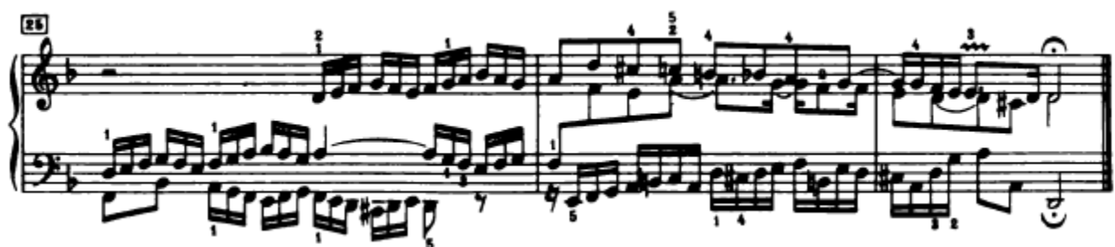
Slika 4.1.16. Završni dio fuge

Završni dio fuge traje samo tri takta (Slika 4.1.16.). Ovaj završni dio započinje izlaganjem teme u altu u osnovnom tonalitetu (d-mol). I ovdje je tema nepotpuna odnosno javlja se samo prvi dio teme, a za to vrijeme se u tenoru javlja taj isti prvi dio teme ali u inverziji. I u ovom završnom dijelu fuge javlja se tema u streti . Nakon što je alt donio ovaj prvi dio teme, slijedi nastup teme u sopranu, iako se tako zvučno ne čini – također u nepotpunom obliku. Za ovo vrijeme tenor ima liniju kontrasubjekta, također izmijenjenu (26. – 27. takt). Triler u zadnjem taktu nerijetko se javlja u završetcima Bachovih skladbi. Izvodi se od gornje note, a šesnaestinka nakon trilera se svira kraće od same njene vrijednosti, odvojeno od trilera koji joj prethodi.