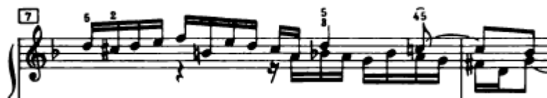
Slika 4.1.5. Motiv u altu

Razvojni dio fuge počinje u 8. taktu. On započinje malim međustavkom izgrađenim od jednog motiva koji se prvi put javlja u altu u 7. taktu na trećoj dobi (Slika 4.1.5.). Ovaj motiv je vrlo bitan jer se javlja i u daljnjem tijeku fuge.