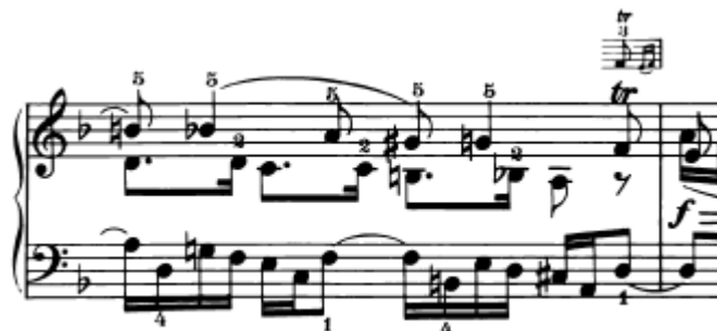
Slika 4.1.12. Triler s mordentom

zapisa pa tako i interpretacije ovog trilera. U nekim verzijama na ovom je mjestu označen triler s mordentom pa se u tom slučaju tako i interpretira (Slika 4.1.12.).