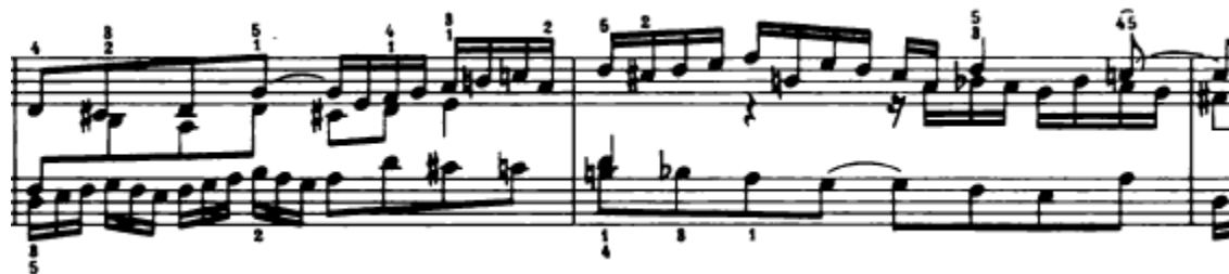
Slika 4.1.4. Treći nastup teme

Nakon toga u 6. taktu slijedi treći nastup teme u tenoru, u osnovnom tonalitetu (Slika 4.1.4.). Za to vrijeme u sopranu se javlja kontrasubjekt.