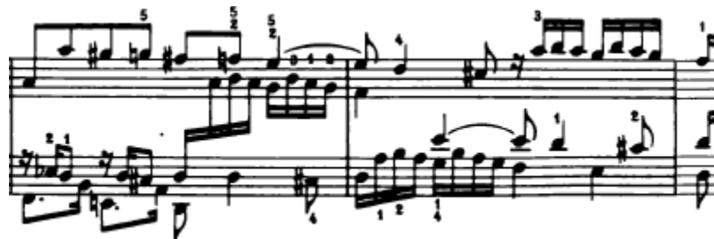
Slika 4.1.8. Drugi međustavak

Slijedi još jedan međustavak (12. – 14. takt) koji je građen od istog tematskog materijala kao prvi međustavak (Slika 4.1.8.).