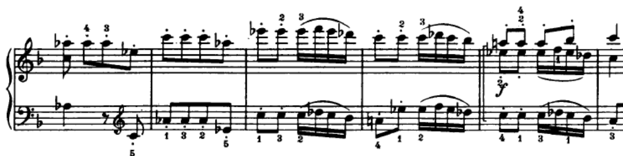
Slika 4.2.7. Prividna streta

Ovdje svakako treba spomenuti jednu zanimljivu melodijsku liniju koja se javlja u nastavku ovog razvojnog dijela. U 41. taktu u desnoj ruci imamo prvu temu, a u 42. taktu u basu se također javlja ta ista tema. Ovdje dolazi do prividne strete , jer glasovi kreću s izlaganjem teme u streti , no tad se u basu tema gubi odnosno skraćuje te se u nastavku poklapa s temom u gornjem glasu (Slika 4.2.7.).