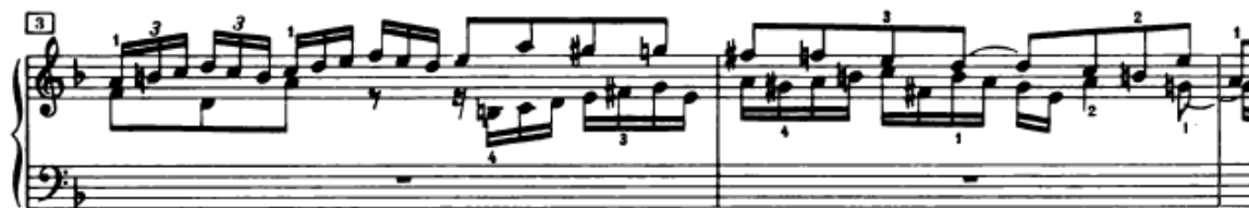
Slika 4.1.2. Realni odgovor u sopranu

Nakon izlaganja teme u altu slijedi realni odgovor u sopranu, u 3. taktu (Slika 4.1.2.). Za to vrijeme u altu se javlja kontrasubjekt, koji će se ponavljati i u daljnjem tijeku fuge, ali najčešće u nepotpunom ili promijenjenom obliku. Ovdje treba obratiti pozornost na početak dionice soprana u desnoj ruci. Prvi ton je a 1 , koji je ujedno i posljednji ton na kraju drugog takta, u lijevoj ruci. Od velike je važnosti da ovdje ne dođe do prekida odnosno pauze u melodijskoj liniji. Ovo će se postići na način da se zadnji ton u lijevoj ruci izdrži do zadnjeg trenutka, a prvi ton u desnoj ruci odsvira odmah nakon završetka trajanja prethodnog tona.