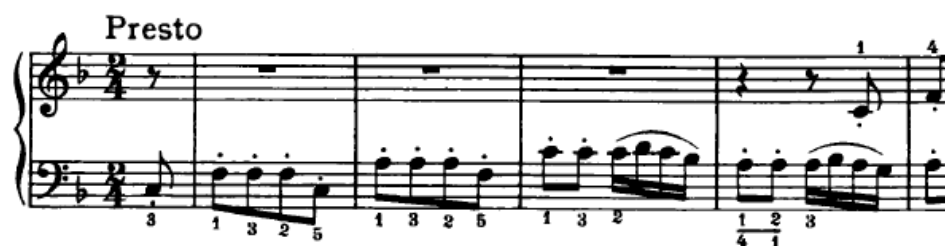
Slika 4.2.1. Polifona tema u basu

Ekspozicija traje od 1. – 32. takta. Stavak počinje s temom polifone građe koja kreće u basu i traje četiri takta (Slika 4.2.1.). Dinamika je mezzopiano , a način izvođenja staccato . Budući da se ovdje radi o polifonoj temi koja će biti prisutna i u daljnjem tijeku stavka, vrlo je važno da se osminke u staccatu izvode točno i precizno, kako ovdje tako i pri svakom sljedećem nastupu teme.