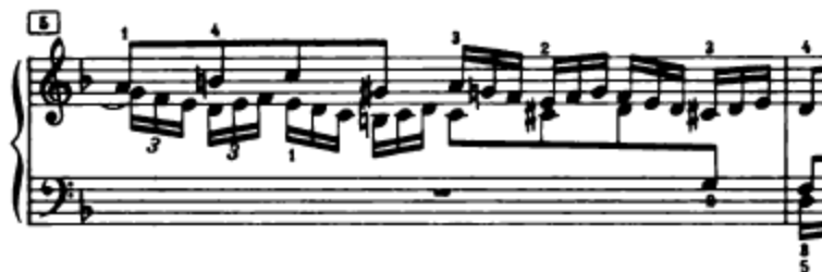
Slika 4.1.3. Codetta

Poslije teme i odgovora slijedi codetta u 5. taktu, a ona je izgrađena od prvog dijela teme u inverziji (Slika 4.1.3.). Ovdje se odvija modulacija iz a-mola u d-mol.