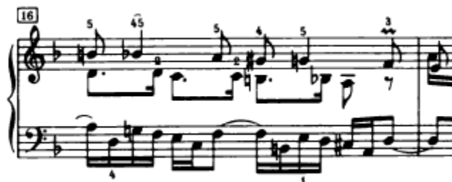
Slika 4.1.10. Triler u sopranu

U nastavku interpretativnog dijela ove analize ovdje svakako treba spomenuti i triler u sopranu u 16. taktu (Slika 4.1.10.).