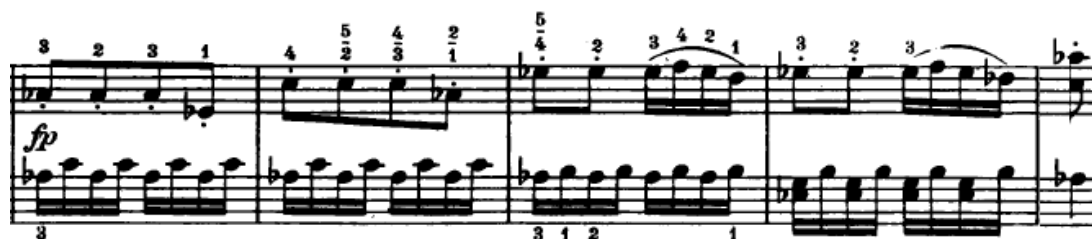
Slika 4.2.6. Tema u homofonom slogu

U nastavku se u desnoj ruci javlja izmijenjena tema s početka stavka, ovaj put u homofonom slogu jer linija u lijevoj ruci ovdje ima ulogu pratnje (Slika 4.2.6.). Dakle, može se zaključiti da je jedna od karakteristika ovog stavka i izmjena polifonije i homofonije. To je sasvim logično jer kako je već navedeno, radi se o dijelu sonatnog ciklusa iz razdoblja klasicizma – homofoni stil, a koji je građen na temi u polifonom stilu.