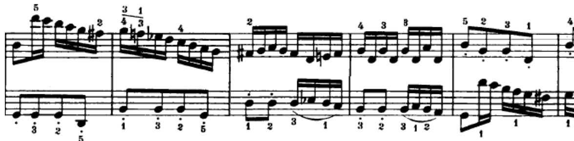
Slika 4.2.10. Most

Odmah nakon izlaganja prve teme javlja se most koji se nadovezivao na prvu temu i u ekspoziciji (Slika 4.2.10.). Tonalitet je g-mol.