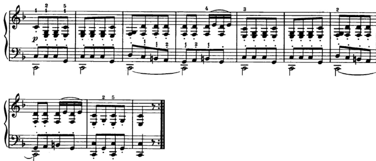
Slika 4.2.4. Druga tema

Poslije mosta slijedi druga tema, u dominantnom tonalitetu (23. – 32. takt). Cijela tema izgrađena je na pedalnom tonu (Slika 4.2.4.). U sonatnom obliku druga tema u pravilu podrazumijeva donošenje novog tematskog materijala te kontrastiranje prvoj temi. Kao što se odmah može vidjeti, ovdje druga tema ima sličan materijal od kakvog je građena i prva tema, što nije izuzetak: „...u starijim sonatnim oblicima (Ph. E. Bach, Haydn, i drugi) često su prva i druga tema građene od istog materijala. I kod Beethovena se katkad sreće melodijska srodnost tema, ali tako da one ipak zadržavaju svoju individualnost.“ 24 Na kraju druge teme nalazi se znak za ponavljanje ekspozicije, a to je uobičajena praksa u sonatnom obliku.