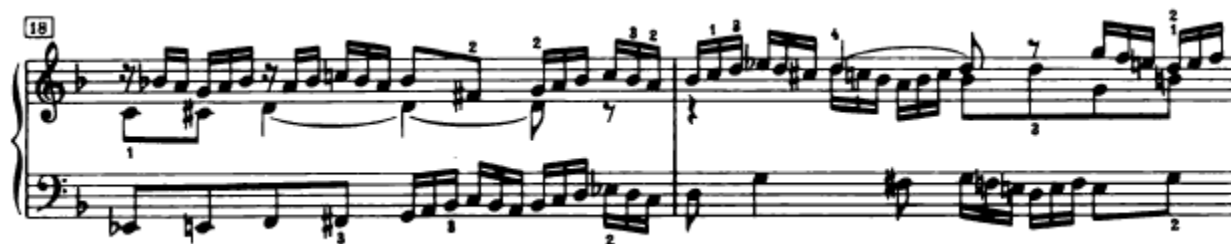
Slika 4.1.14. Tema u streti

Odmah nakon ovog nastupa teme u inverziji u tenoru, isti glas nastavlja s novim izlaganjem teme u 18. taktu, ovaj put u osnovnom ali nepotpunom obliku (g-mol). Slijedi još jedna streta na oktavi, također u razmaku od samo jedne dobe gdje sopran donosi temu, također nepotpunu (Slika 4.1.14.).