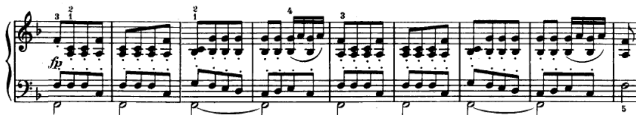
Slika 4.2.11. Druga tema u osnovnom tonalitetu

Nakon mosta slijedi razrada tematskog materijala iz prve teme, što nas dovodi do nastupa druge teme, ovaj put u osnovnom tonalitetu (F-dur) (Slika 4.2.11.).