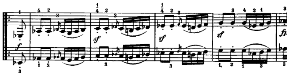
Slika 4.2.5. Početak provedbe

Nakon završetka druge teme u ekspoziciji slijedi razvojni dio (33. – 86. takt). U razvojnem dijelu se uglavnom razrađuje tematski materijal iz prve teme. Početak razvojnog dijela je u As-duru. Lijeva i desna ruka sviraju istu melodijsku liniju s motivom prve teme (Slika 4.2.5.).