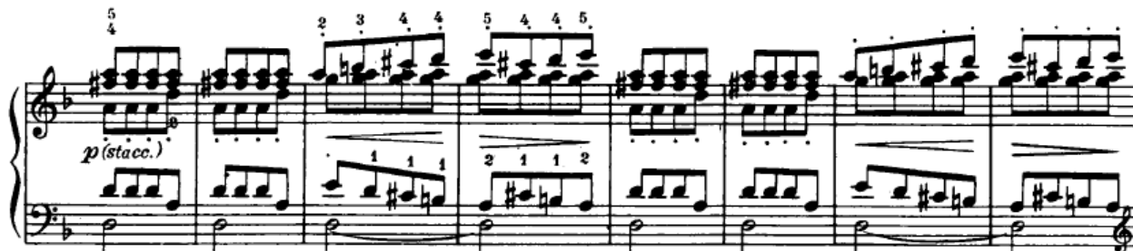
Slika 4.2.8. Motiv druge teme

Na početku analize razvojnog dijela bilo je riječi o tome da se u ovom dijelu stavka uglavnom razrađuje tematski materijal iz prve teme, što je vidljivo i u prethodnim primjerima. Ipak, u 69. taktu po prvi se put u razvojnog dijelu javlja i druga tema, u variranom obliku (Slika 4.2.8.). Tonalitet je D-dur.