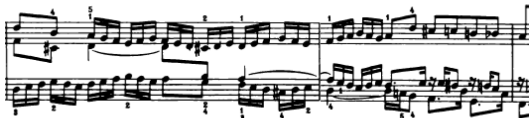
Slika 4.1.7. Prividna streta

Nakon malog međustavka u 10. taktu javlja se tema u tenoru, ali u nepotpunom obliku. Za to se vrijeme u sopranu javlja prvi dio teme u prividnoj streti (Slika 4.1.7.). Ova streta nije sasvim jasna jer se već kod pojave teme u sopranu gubi tema u tenoru, odnosno prekida te nastavlja s drukčijom melodijskom linijom. Tonalitet je d-mol.