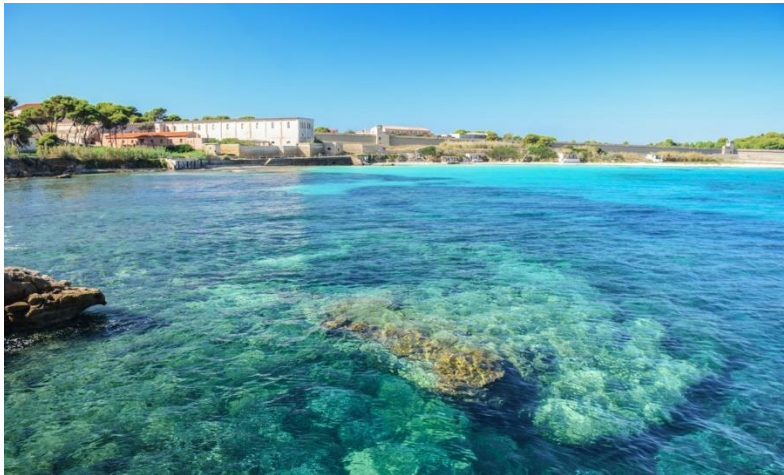
Fotografija 12. Otok Pianosa