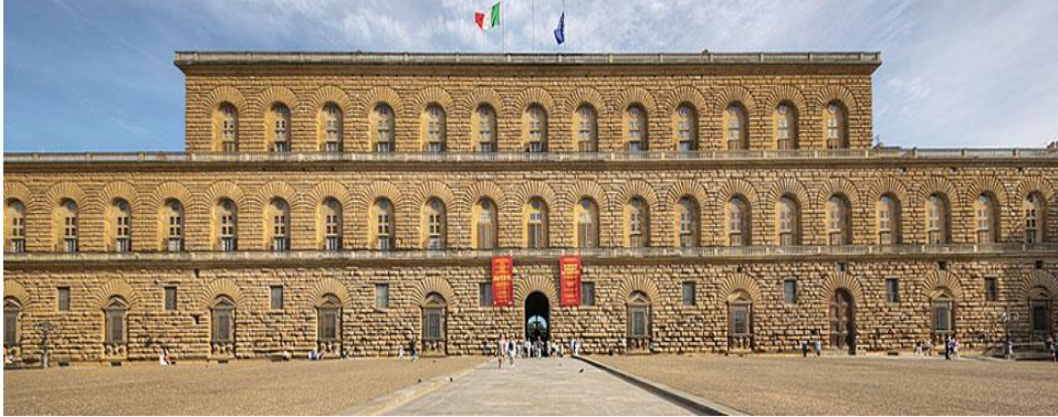
Fotografija 19. Palača Pitti

(Izvor: Museums in Florence http://www.museumsinflorence.com , 21. 6. 2022)