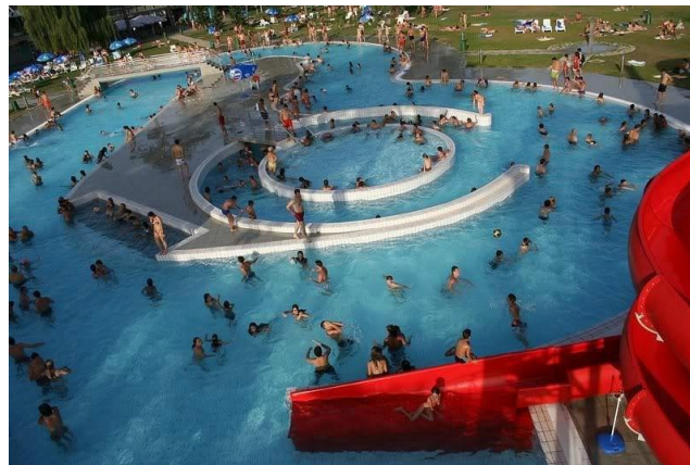
Slika 11. Aquana d.o.o., Banja Luka