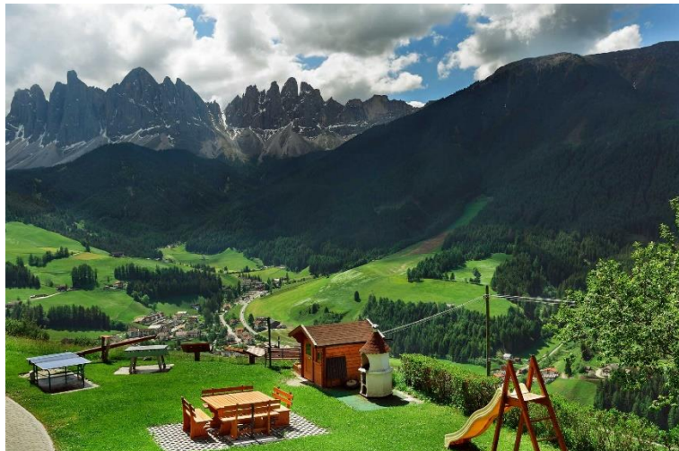
Slika 7. Seoski turizam