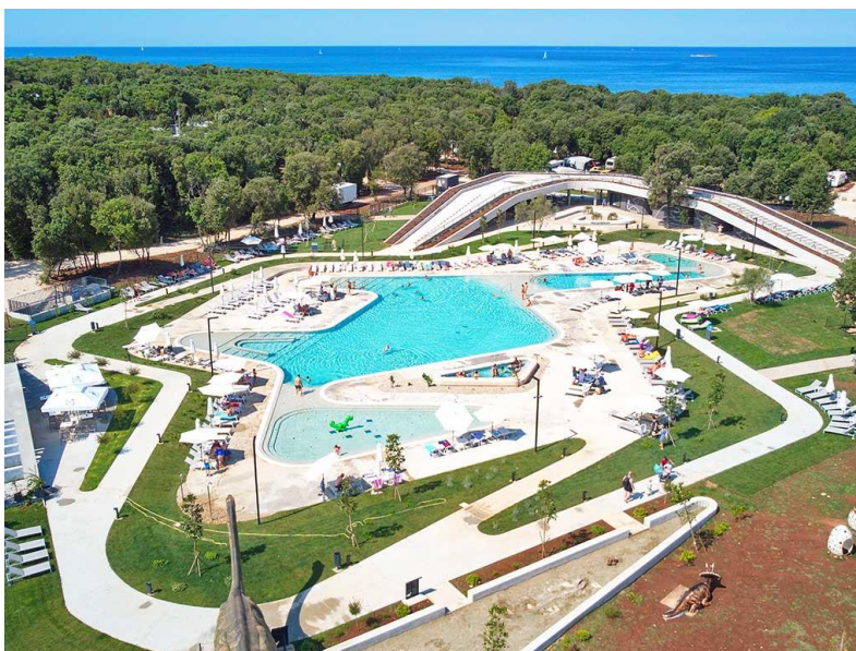
Slika 8. Kamp “Mon Perin”, Bale