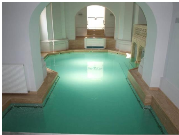
Slika 9. Specijalna bolnica za medicinsku rehabilitaciju, Stubičke toplice

Stubičke toplice – Krapinsko-zagorska županija. Stubičke toplice su naselje, ali i lječilište i kupalište koje se nalaze u Krapinsko-zagorskoj županiji. Što se tiče javno – privatnog partnerstva i konkretnih primjera u Republici Hrvatskoj, Stubičke toplice zaista vrijedi spomenuti prilikom ove teme jer je projekt JPP – a “Stubičke toplice” najveći zdravstveno-turistički projekt u Hrvatskoj (Slika 9).