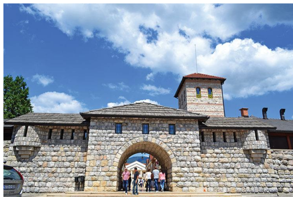
Slika 10. Andrićgrad, općina Višegrad