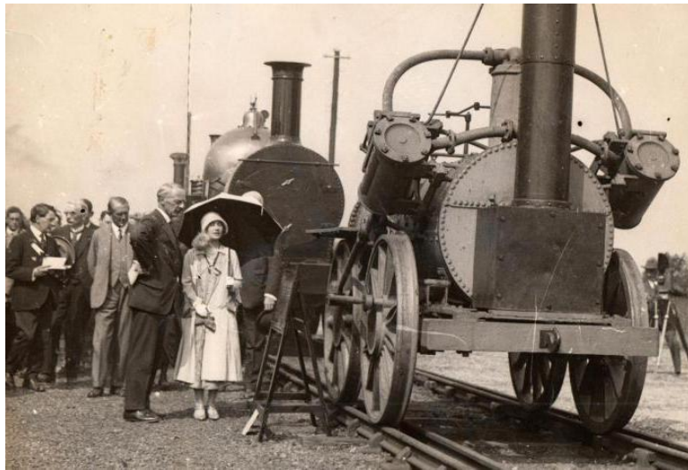
Slika 3. Prva svjetska željeznica