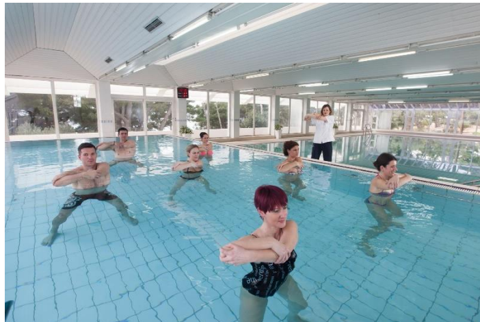
Slika 6. Zdravstveni turizam