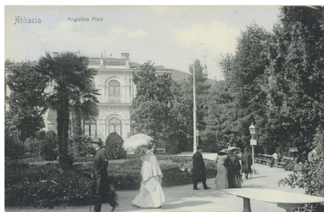
Slika 5. Villa Angiolina