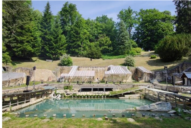
Slika 4. Varaždinske Toplice