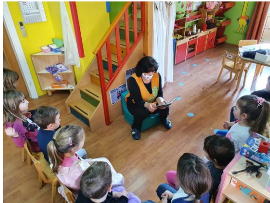
Slika 1. Čitanje bajke djeci.