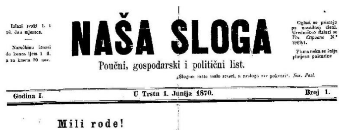
Slika 4 Naša sloga