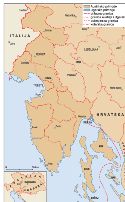
Slika 2 Austrijsko primorje

Nakon što je donesena Listopadska diploma, a nakon nekoliko mjeseci i Veljački patent, u Monarhiji dolazi do reorganizacije uprave i nove teritorijalne podjele države. Tim aktima ukinuto je Istarsko okružje sa sjedištem u Pazinu koje je djelovalo od 1825. do 1860. godine 10 te je sada teritorijalno Istra, zajedno s otocima Krkom, Cresom i Lošinjom činila Markgrofoviju Istre, jednu od 21 autonomne pokrajine u Monarhiji. Markgrofovija Istra, zajedno s pokneženim Grofovijama Goricom i Gradiškom te gradom Trstom činila je Austrijsko primorje koje je svoje Namjesništvo imalo u Trstu (koje nije izravno utjecalo na rad pokrajinskih sabora u Poreču, Gorici i Trstu), čije su granice ostale nepromijenjene i nakon krizne 1867. godine kada se provodi Austro-ugarska nagodba te Markgrofovija Istra postaje dijelom cislajtanijskog austrijskog dijela Monarhije. 11