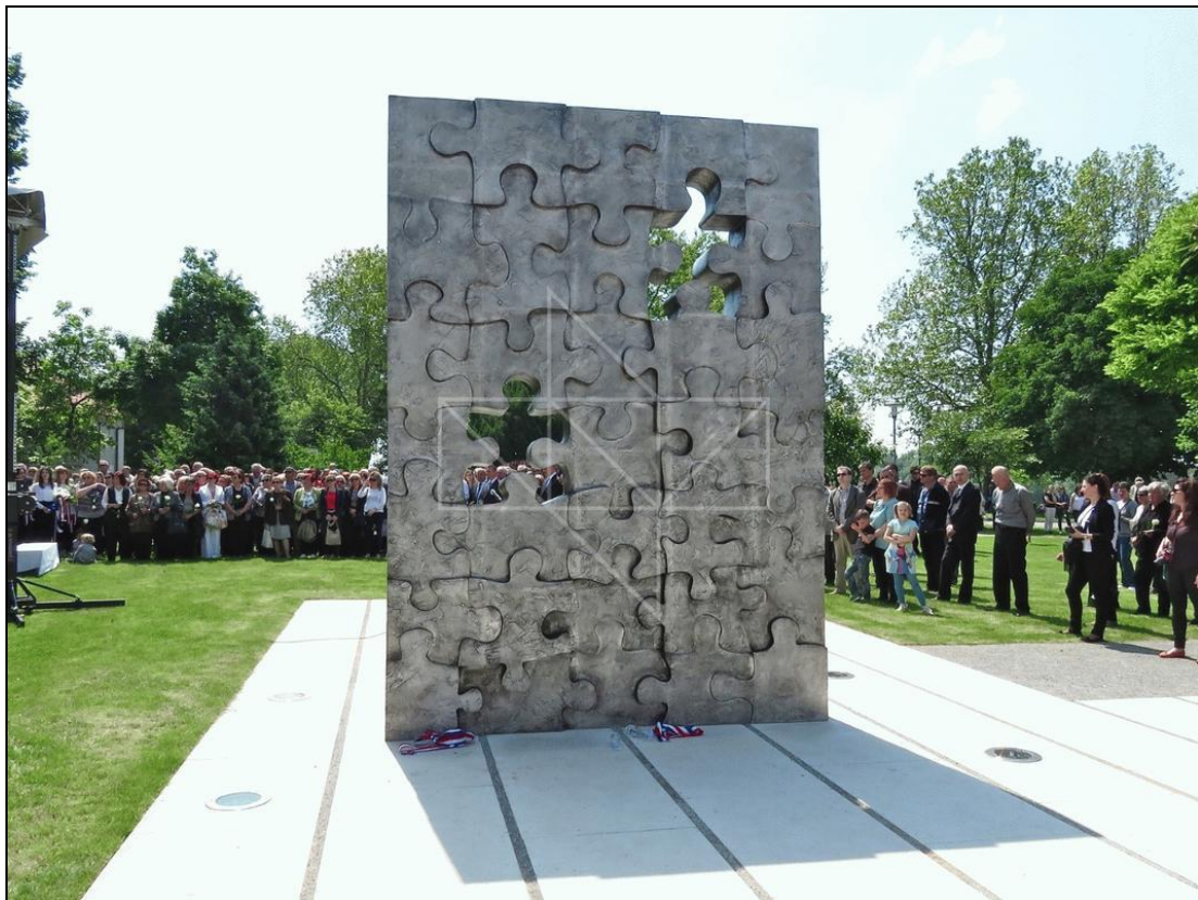
Slika 11. Spomenik poginuloj djeci Domovinskog rata

Nakon 24 godine od pogibije djevojčica i dječaka tijekom Domovinskog rata, 21. svibnja 2016. godine u Slavanskom Brodu otkriven je spomenik Prekinuto djetinjstvo (Slika 11.), kao podsjetnik na 402 djece iz Slavanskog Broda, Dubrovnika, Zadra, Siska, Osijeka, Pakraca i ostalih mjesta diljem Hrvatske. Spomenik je izrađen prema idejnom rješenju Petra Dolića i Petre Tončić Lipovščak pod nazivom Prekinuto djetinjstvo, a nalazi se u parku na slavansko-brodskom Šetalištu Braće Radić. Spomenik podsjeća na nedovršenu slagalicu, na zaustavljenu dječju igru i prekinute snove. 76