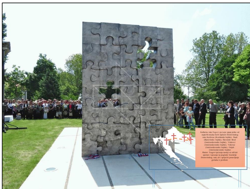
Slika 14. Primjer ploče postavljene uz spomenik poginuloj djeci Domovinskog rata u Slavonskome Brodu