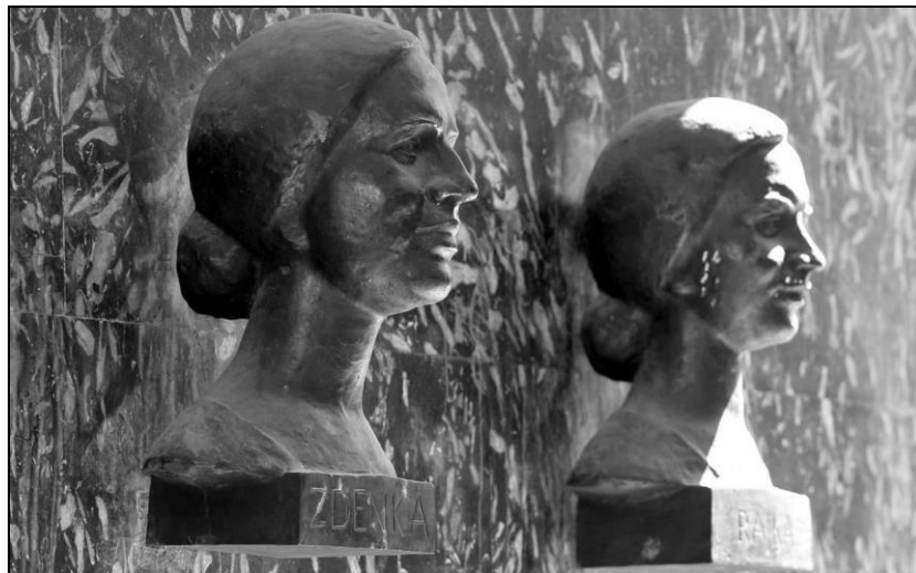
Slika 1. Spomenik sestrama Baković

Priča je započela 1990-ih godina u Zagrebu kada raspadom Jugoslavije započinje početak hrvatske borbe za neovisnost a s njom i još jedan krvavi rat. Time cjelokupno naslijeđe povezano s Jugoslavijom postaje neželjenom baštinom, a u tom kontekstu spomenik sestrama Baković, podignut i slavljen za vrijeme Jugoslavije, postaje neželjenim (Slika 1.). 16