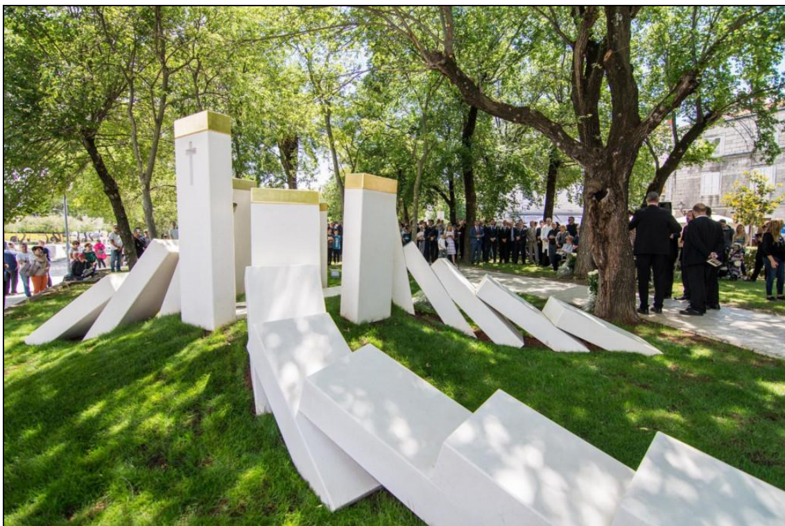
Slika 12. Spomen-obilježje Trogirska kruna