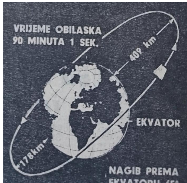
Slika 7 Prikaz obilaska Zemlje (Vjesnik, 1964)

Skepticizam koji je postojao oko leta Sputnika 2 u potpunosti je ovoga puta zamijenjen euforijom i slavom sovjetskog svemirskog programa. Ako je i postojalo različitih razmišlja, ovdje ona nisu objavljena. Osim što hvale program, imaju i izrazito optimističnu viziju budućnosti unatoč tome što su detaljne informacije Sovjeti uvijek zadržavali za sebe.