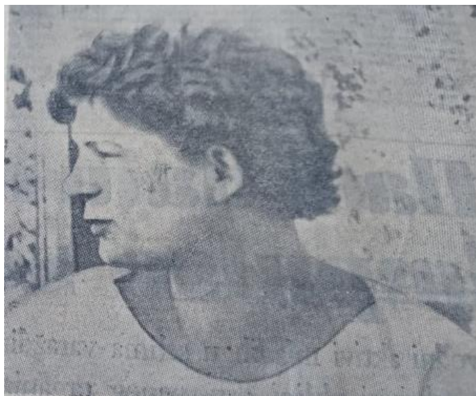
Slika 6 Fotografija Valentine Tereškove, (Novi list, 1963)

Godine 1964. odlučeno je da će se lansirati tri astronauta u jednoj letjelici. Ovom novom misijom testirana je sposobnost tročlane posade da djeluju unutar uskog prostora. Iako su Sovjeti mogli izgraditi veću letjelicu nego što je to bio Vostok, umjesto toga ugrađena su tri sjedala i ograničeno je kretanje astronauta. Za razliku od prethodnih misija, ovoga je puta bilo pet puta manje prostora i zraka po članu. 127 Novi je projekt nazvan Voskhod (hrv. Izlazak sunca). Zadatak medija sada je bio uvjeriti javnost kako se radi o sasvim novoj letjelici, a ne o modificiranom Vostoku. Za novu misiju izabrana su tri muškarca iz različitih područja: Vladimir Komarov kao pilot, Konstantin Feoktistov kao inženjeri i Boris Yegorov kao prvi doktor. Lansiranje rakete s posadom dogodilo se 12. listopada 1964. te je ova kratka misija od jednog dana prošla bez većih incidenata. Dan nakon povratka na Zemlju osim što su astronauti trebali dati izvješće o svome letu, također su se trebali i obratiti novom vođi Sovjetskog Saveza, Leonidu Brežnjevju. 128