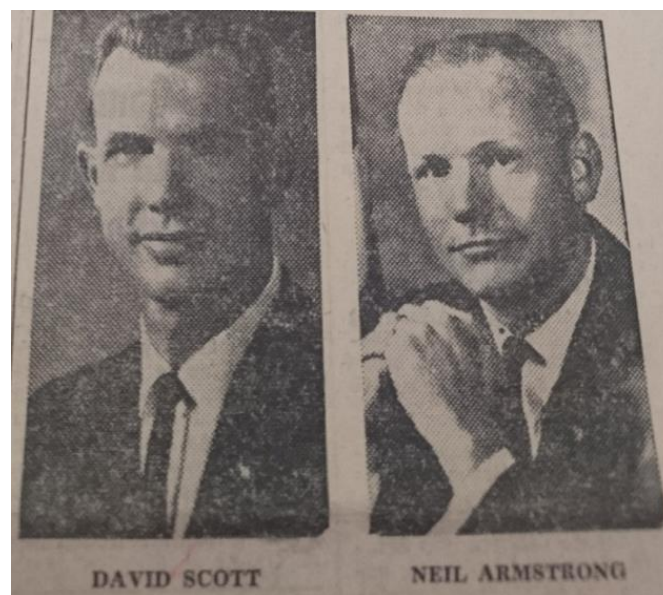
Slika 11 Fotografije Davida Scotta i Neila Armstronga ( Novi list , 1966)

U nastavku komentira izjave američkih reportera koji su rekli kako se u glasu Armstronga osjetila panika. On ga potom brani i tvrdi kako se našao u novoj situaciji koju astronaut još nikad nije prije iskusio. Zato je, prema riječima novinara, to bila „izvanredna prisutnost duha i visok nivo lične hrabrosti“. Iako je zbog problema s vozilom došlo do ranijeg spuštanja na Zemlju, urednik je ispunjen optimizmom u vezi leta. Tvrdi da unatoč tome što to nije u formalnom smislu bila uspješna misija, snalažljivost astronauta u opasnoj situaciji pokazala je kako je njegov let bio dvostruko značajan. 203 Novi List isto je tako izvijestio na naslovnici o događaju, dajući joj podosta prostora. Uz osnovne informacije i sliku astronauta može se uočiti i skroz na vrhu stranice naslov „Johnson: čovjek na mjesecu prije 1970“. Ovdje, u par rečenica, se prenosi mišljenje američkog predsjednika kako će upravo Amerikanac biti prvi čovjek na Mjesecu i to prije nego što desetljeće završi. 204