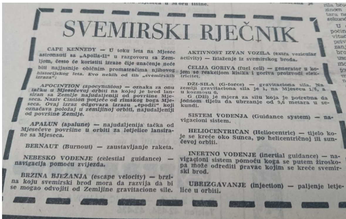
Slika 14 Objašnjenje izraza korištenih tijekom leta Apolla 11 (Novi list, 1969)

Novi list nije propustio obavijestiti svoje čitatelje kako će biti izvanrednih emisija povodom lunarnog programa. Nakon što su stranice ispunili raznim sadržajem o Apollu 11, na 14. stranici odlučili su objaviti informacije vezane uz televizijski studio-Zagreb. Tako su najavili da će se osim prijenosa leta emitirati i emisija o letu čovjeka na Mjesec. Na toj će se emisiji okupiti raznoliki stručnjaci, od inženjera do umjetnika te političara i trajat će do direktnog uključivanja prilikom pristajanja mjesečevog modula na mjesečevu površinu. Potom, kad i to završi, će ispitivati stanovnike Zagreba, Dubrovnika i ostalih gradova o njihovim stavovima. Druga emisija će biti o izlasku Armstronga iz modula. Za kraj, spomenuli su kako „TV-Zagreb danonoćno dežura, kako bi se u svakom trenutku, u slučaju potrebe, ovaj studio mogao uključiti u međunarodne veze“ da bi pritom prenijeli gledateljima što se novog odvija u svemiru. 240 Pet dana nakon leta, Glas Istre prenio je kroniku leta i nazvao ga „velikim povijesnim činom“. Također su objavili i izreke s plakete koju su astronauti ponijeli sa sobom a glasi „Ovdje ljudi s planete Zemlje stavili su nogu na Mjesec 21. jula 1969. Došlo smo u miru za cijelo čovječanstvo.“ 241