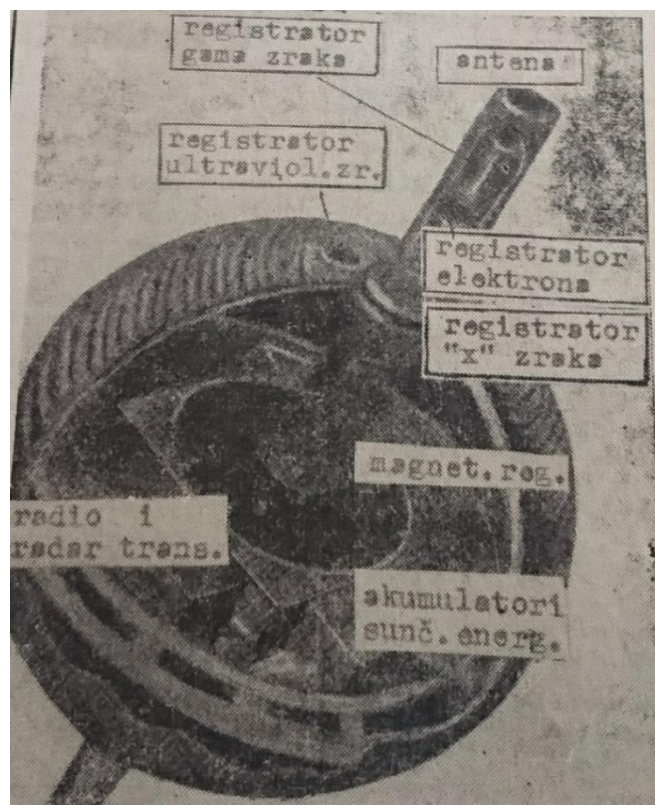
Slika 2 Presjek umjetnog Zemljinog satelita ( Slobodna Dalmacija , 1957)

usmjerili na tehnički aspekt satelita, navodeći njegove karakteristike. Sputnika nazivaju samo riječima „umjetni satelit“. Može se primijetiti kako su novine neutralne oko svojih stajališta, no zato navode što strani mediji govore. Pažnju urednika najviše je odvušla reakcija Sjedinjenih Država, gdje je bilo različitih mišljenja vezanih uz lansiranje Sputnika. Tako je Slobodna Dalmacija obavijestila čitatelje o kritikama na račun američke vlade upućene od strane novina u New Yorku i Washingtonu. Mediji u SAD-u, prije svega New York Herald Tribune , kritizirali su vladu zbog poraza u utrci izbacivanja prvog satelita. 86 Praćenje novosti oko Sputnika nastavilo se i tijekom sljedećih dana, dodajući neke nove informacije o satelitu. Isto tako nastavljeno je prenošenje američkih komentara, pa je tako dan nakon prve objave o satelitu naslov Slobodne Dalmacije nosio izreku „To je trijumf čovjeka nad prostorom“, citirajući time New York Herald Tribune . 87 Skice dijelova satelita priložene su u novinama.