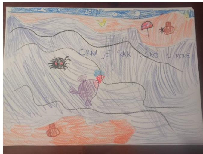
Slika 2. Prva stranica slikovnica