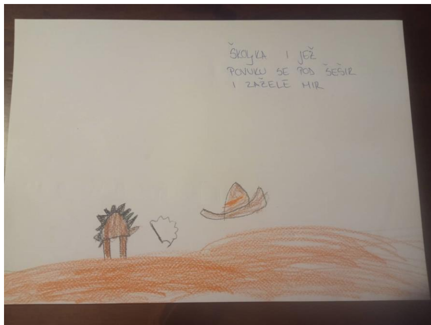
Slika 7. Šesta strana slikovnice