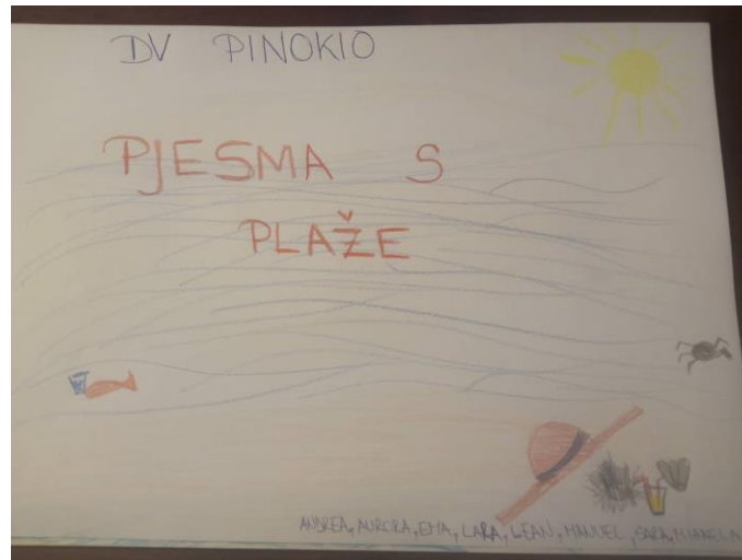
Slika 1. Naslovnica slikovnice