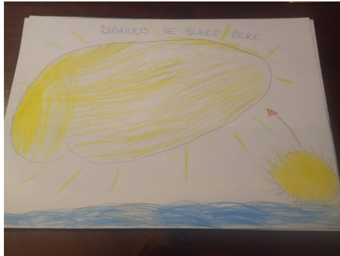
Slika 3. Druga stranica slikovnice