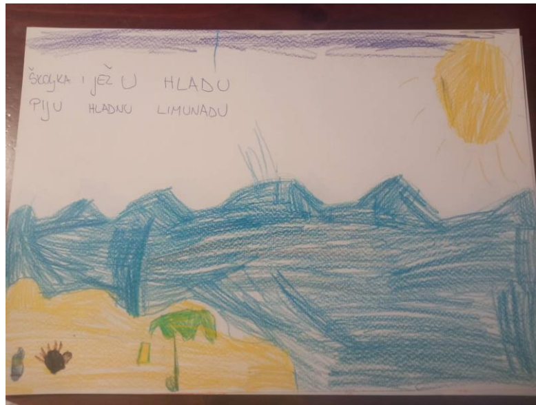
Slika 5. Četvrta stranica slikovnice