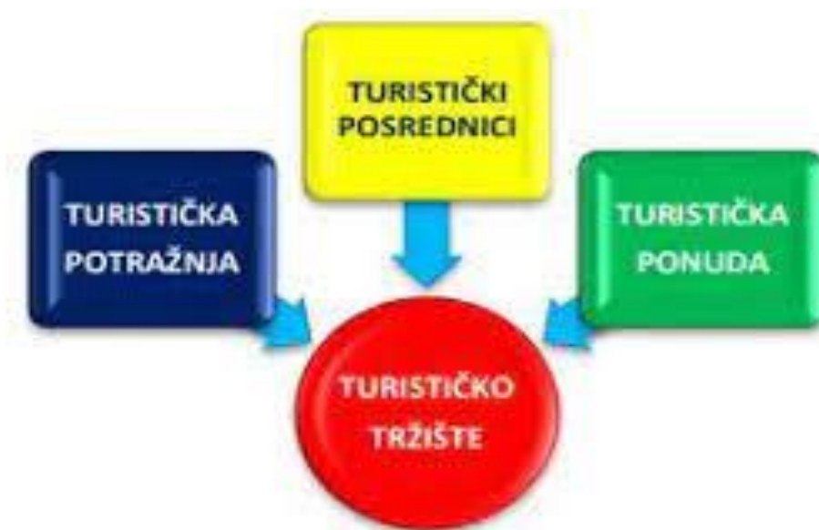
Slika 2: Subjekti turističkog tržišta