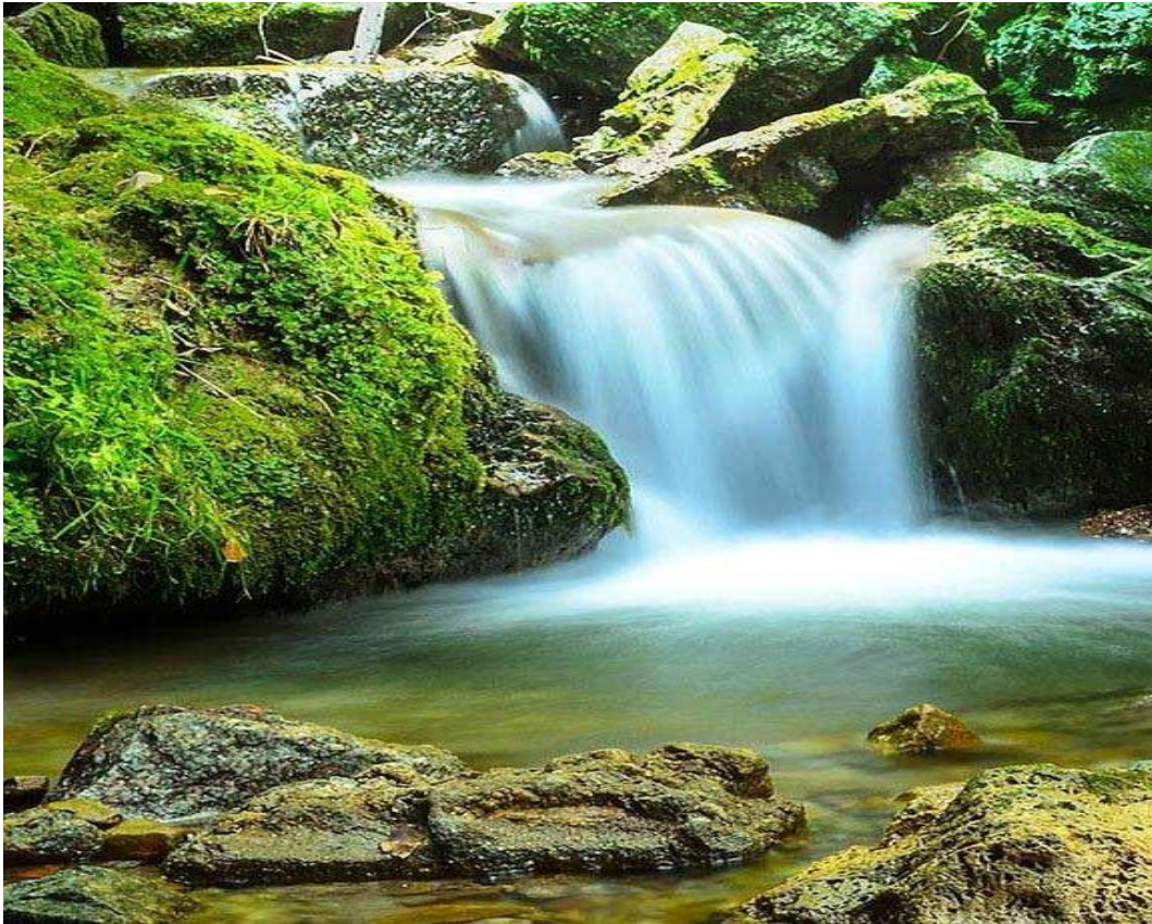
Slika 4: PP Papuk