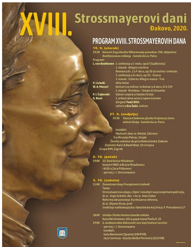
Slika 6. Program XVIII. Strossmayerovih dana