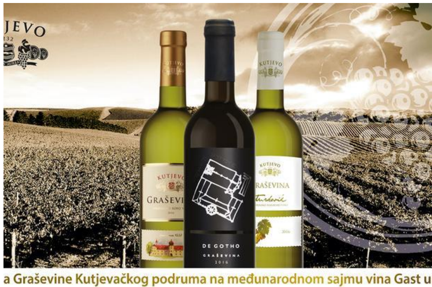
Slika 7: Kutjevačka vina