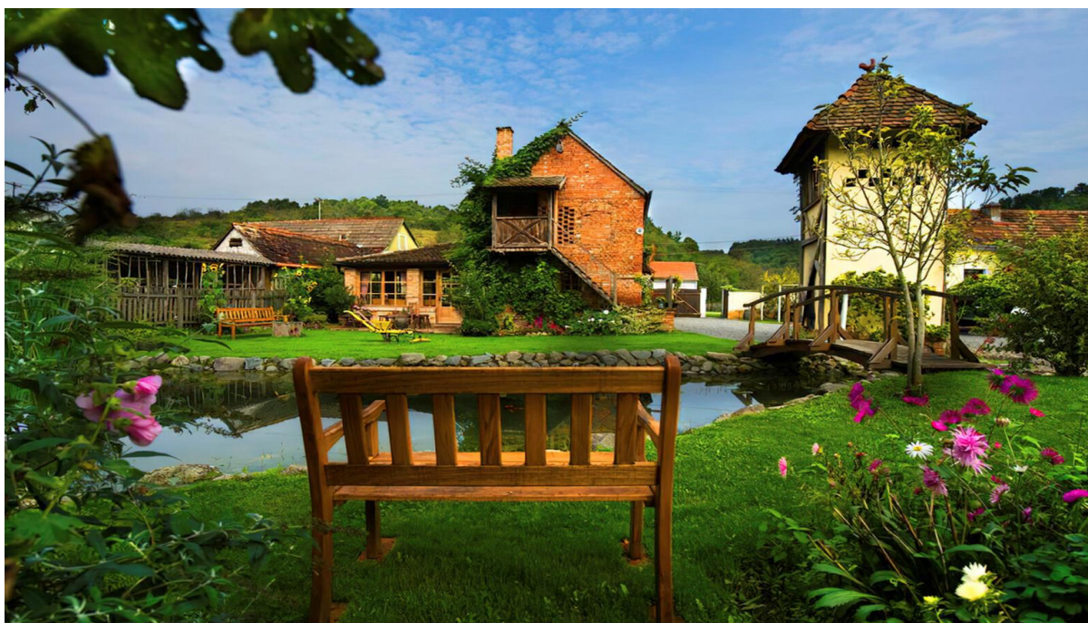
Slika 5: Etno-eko selo Stara Kapela