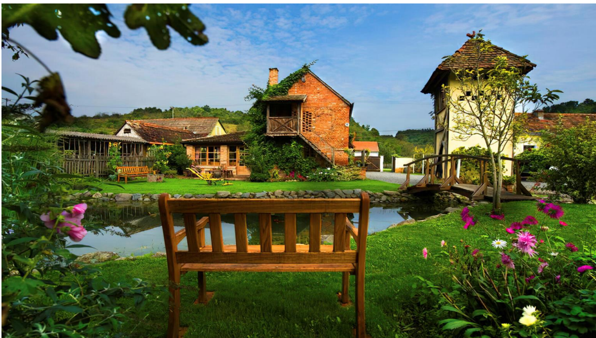
Slika 5: Etno-eko selo Stara Kapela