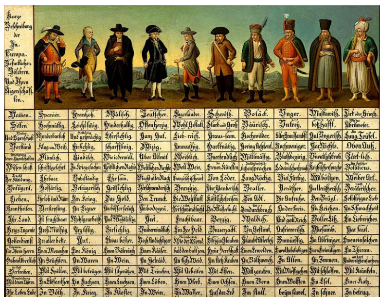
Slika 2. Völkertafel 49