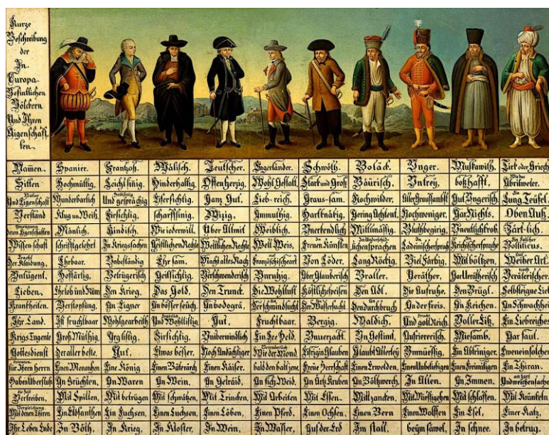
Slika 2. Völkertafel 49