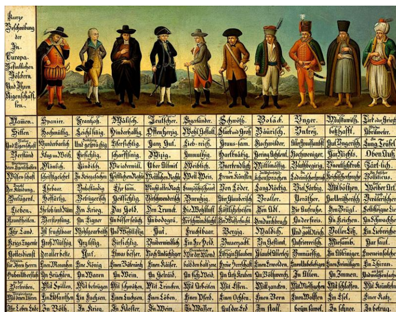
Slika 2. Völkertafel 49