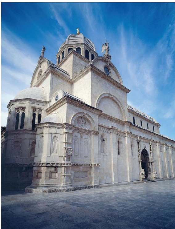
Slika 5. Katedrala svetoga Jakova u Šibeniku

Kad je riječ o graditeljskoj baštini, posebno se ističu fortifikacije i katedrala svetoga Jakova, čijoj gradnji je sudjelovao već spomenuti kipar Juraj Dalmatinac te sagradio neke od najljepših dijelova katedrale, tri apside, stupove s kapitelima te sakristiju i krstionicu. 9 Od staroga dijela grada ističu se i biskupska palača sagrađena u 15. stoljeću u gotičkom stilu, u čijem se dvorištu nalazi veliki kip svetog Mihovila – simbol zaštitnika grada (sl. 5). 10