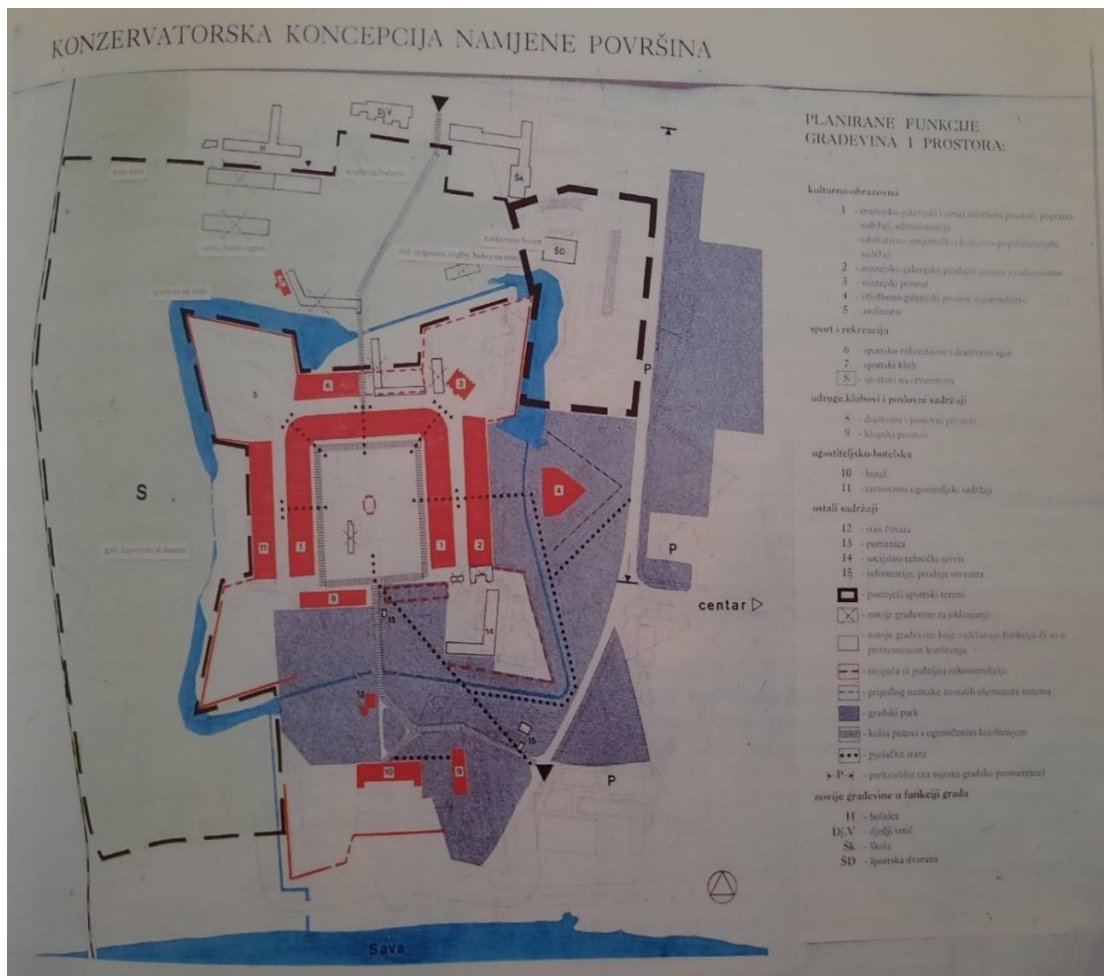
Slika 11. Prikaz konzervatorske koncepcije namjene površina