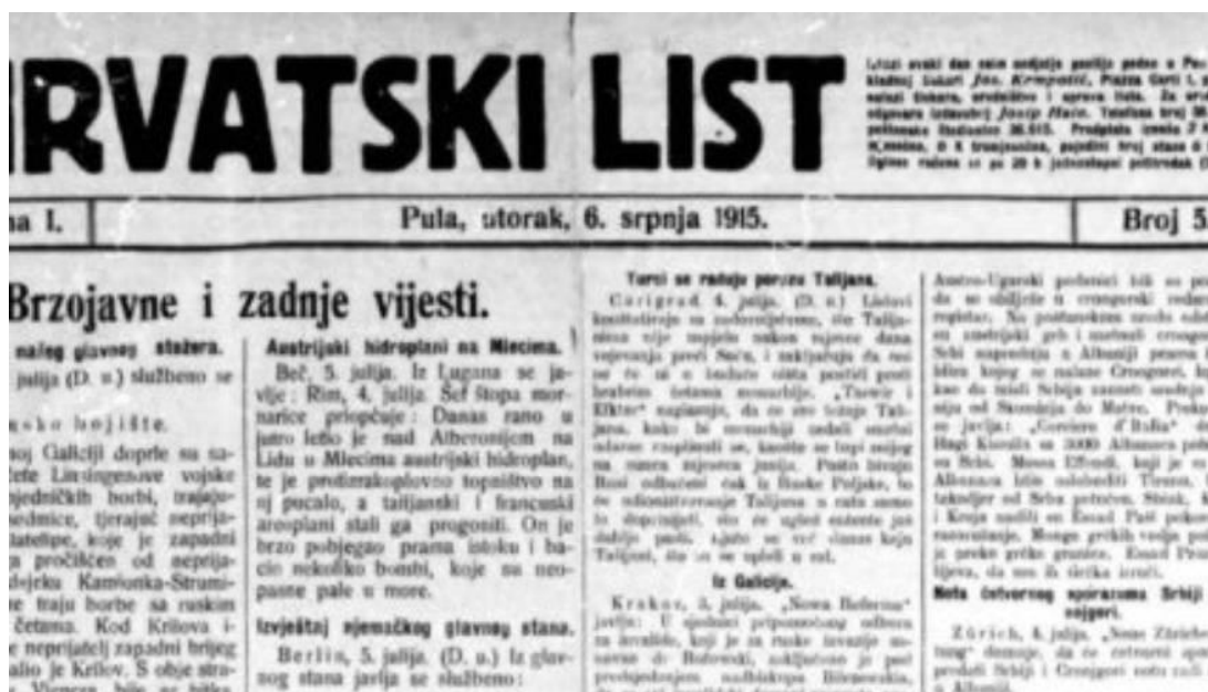
Slika 6.: Primjer Hrvatskoga lista