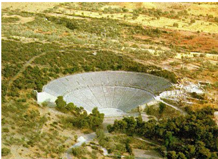
Slika 3: Kazalište u Epidauru

Jedna od najpoznatijih knjižnica u helenističkom razdoblju nalazila se u Pergamu, a posjedovala je oko 200 000 svitaka. Pergam je prema arheološkim istraživanjima bilo helenističko središte koje se sastojalo od donjeg grada gdje su bile tržnice, srednji grad su bila svetišta Demetre i Here, a gornji grad koji je bio na terasama i s posebnim ukrasima smjestila se knjižnica. 53