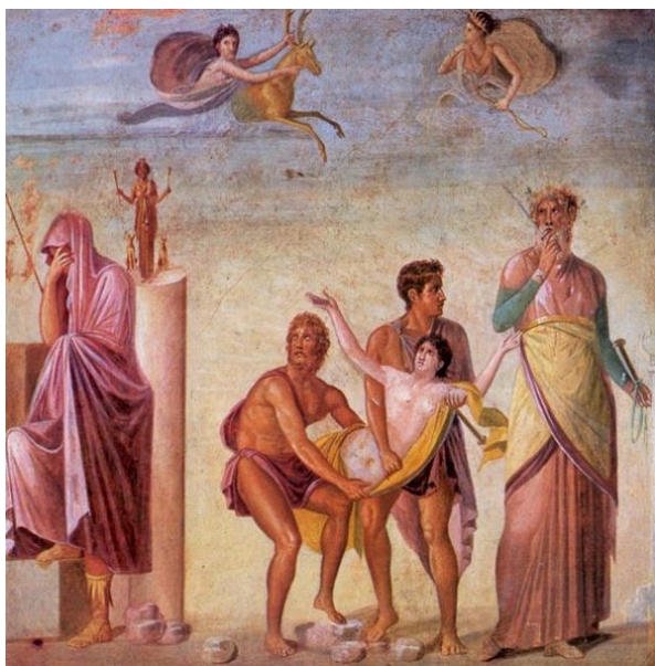
Slika 6: Žrtvovanje Ifigenije

Za razliku od jonske škole, atička škola ima tri predstavnika. Prvi je Aristid Stariji poznat po djelima Majke na umoru sa novorođenčetom , Borba Grka protiv Perzijanaca . Nikija je poznat po Zavjeri mrtvaca , Jo i Argus , Perzej i Andromeda , Odisej i Kalipso . Filoksen je poznat po svojem djelu Bitka Aleksandra Velikog s Darijem . Sikionska škola je imala dva majstora. O Eupompu se jako malo zna, dok se nešto više zna za Pamfila, koji je ujedno i utemeljitelj slikarstva u gradu. Njegovo poznato djelo je Bitka kod Filijunta . 58