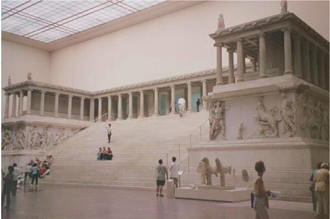
Slika 4: Rekonstrukcija Zeusova oltara u Berlinu

Razvoj se odvijao i u arhitekturi ovoga razdoblja koje je postalo mnogo ugodnije za stanovanje, kuće su i dalje bile jednostavne, a svoje unutrašnje dvorište bilo je ukrašeno kolonadama. Postojale su dvije prostorije koje su sve ljepše građevine imale, a to su primaća soba te soba koja je služila i za kuhinju, kupaonicu, ali i radni prostor. 55