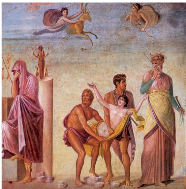
Slika 6: Žrtvovanje Ifigenije

Za razliku od jonske škole, atička škola ima tri predstavnika. Prvi je Aristid Stariji poznat po djelima Majke na umoru sa novorođenčetom , Borba Grka protiv Perzijanaca . Nikija je poznat po Zavjeri mrtvaca , Jo i Argus , Perzej i Andromeda , Odisej i Kalipso . Filoksen je poznat po svojem djelu Bitka Aleksandra Velikog s Darijem . Sikionska škola je imala dva majstora. O Eupompu se jako malo zna, dok se nešto više zna za Pamfila, koji je ujedno i utemeljitelj slikarstva u gradu. Njegovo poznato djelo je Bitka kod Filijunta . 58