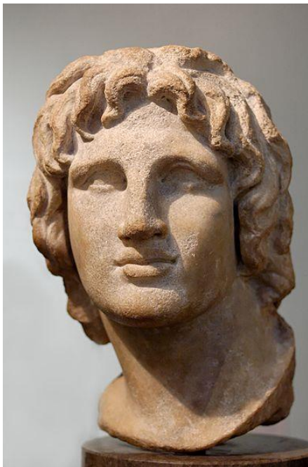
Slika 1: Aleksandar Veliki

Buran život je oslabio Aleksandra Velikog te se vratio u Babilon, u grad kojeg je proglasio glavnim gradom svoga carstva. Umro je u svojoj 33. godini od groznice, što je bilo trinaest godina nakon što je postao kralj. Sahranjen je u Aleksandriji u zlatnom lijesu. 13