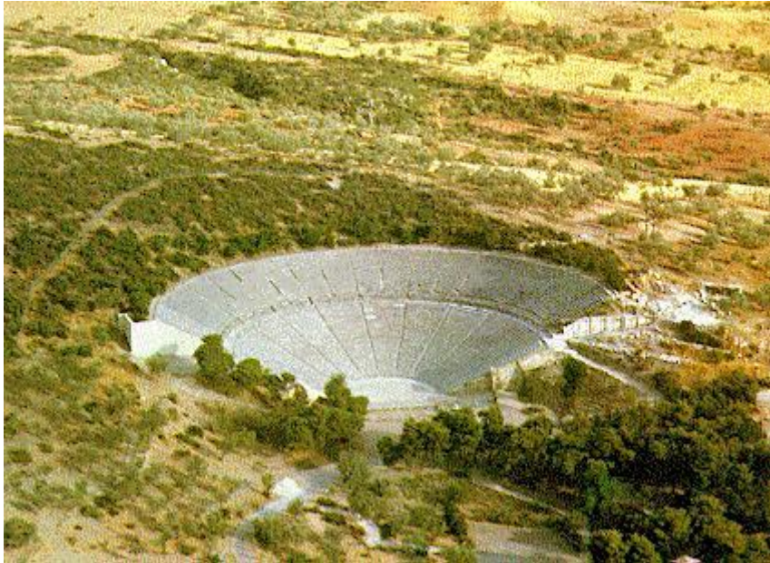
Slika 3: Kazalište u Epidauru

Jedna od najpoznatijih knjižnica u helenističkom razdoblju nalazila se u Pergamu, a posjedovala je oko 200 000 svitaka. Pergam je prema arheološkim istraživanjima bilo helenističko središte koje se sastojalo od donjeg grada gdje su bile tržnice, srednji grad su bila svetišta Demetre i Here, a gornji grad koji je bio na terasama i s posebnim ukrasima smjestila se knjižnica. 53