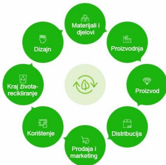
Slika 6: Kotač ekodizajna

dobiti trajnije i inovativnije proizvode koji će povećati kvalitetu života i dugoročno im uštedjeti. Kotač ekodizajna pomaže ugraditi održivost u svaku inovaciju. Današnji izazovi su najvjerojatnije vrlo slični problemima s kojima je već mnogo puta suočavano i na koje je odgovoreno. Srećom, dizajneri, inženjeri, znanstvenici i mislioci prošlosti sakupili su zajedničke pristupe njihovom rješavanju. Izvorno razvijen od strane Brezeta i van Hemela još 1997. godine, Kotač ekodizajn je jedan takav okvir koji je danas relevantniji nego ikad. 50 Ovaj pristup ističe potencijalne strategije tijekom cijelog životnog ciklusa bilo kojeg proizvoda. Strateški kotač ekodizajna može biti koristan kontrolni popis ili vodič za brza poboljšanja dizajna i rješenja u ključnim fazama životnog ciklusa proizvoda. To je pristup koji obuhvaća izbor materijala i proizvodnih procesa, distribuciju, energetske učinkovite upotrebe tijekom životnog vijeka i razmatranja na kraju životnog vijeka kao što su rastavljanje, ponovna uporaba ili recikliranje. Pomaže u razmatranju utjecaja životnog ciklusa proizvoda, usluge ili sustava. Kotač ekodizajna pruža korisne upute i fokus za pomoć u osmišljavanju kreativnih načina kako bi projekti bili održiviji.