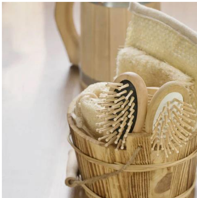
Slika 3: Drvena četka

Najjednostavniji primjer zelenog dizajna može biti drvena četka. Drvene četke za kosu uglavnom su izrađene od 100% prirodnih materijala, od drške do tijela, dlake i vrha dlake. Drška je uvijek ergonomska i udobna za držanje.