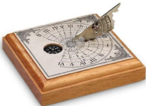
Slika 7: Sunčani sat Santa Cruz