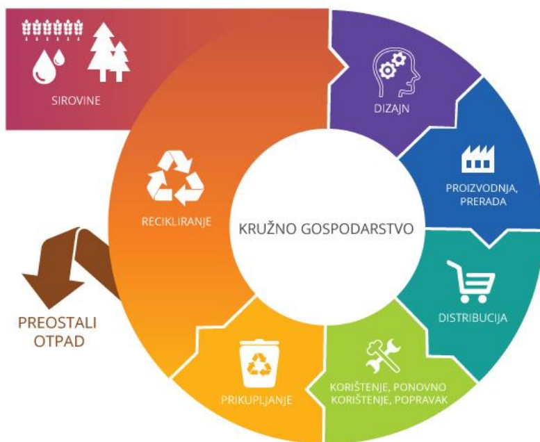
Slika 5: Kružna ekonomija