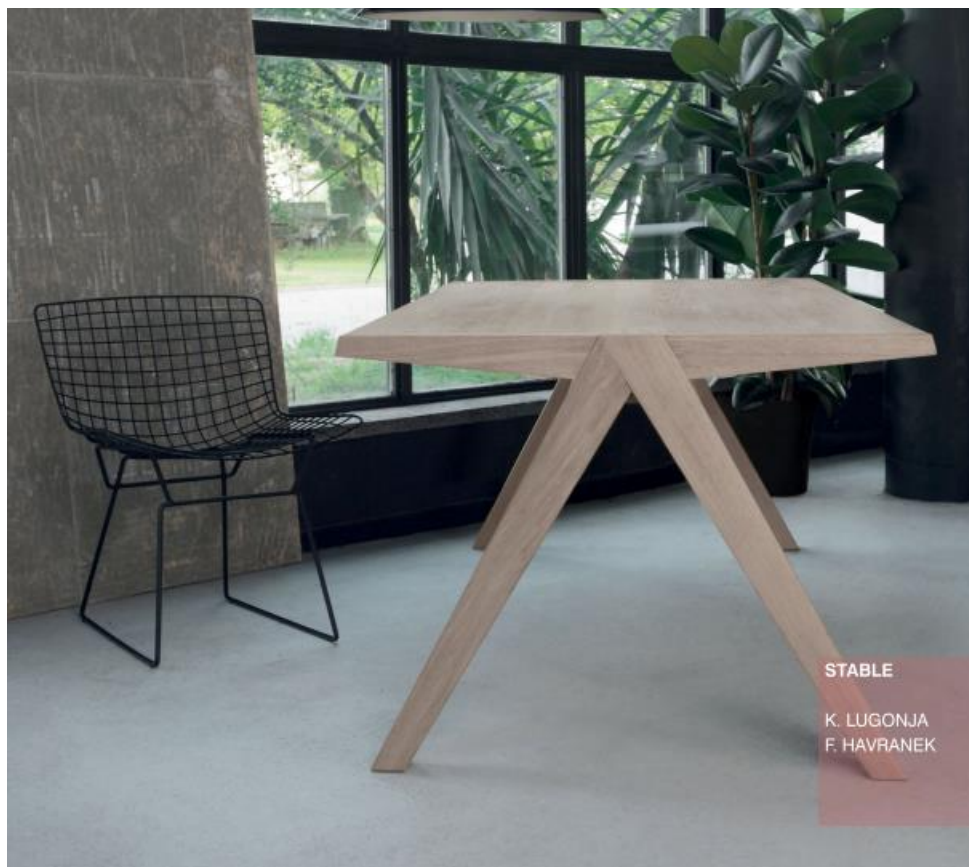
Slika 14: Prikaz namještaja