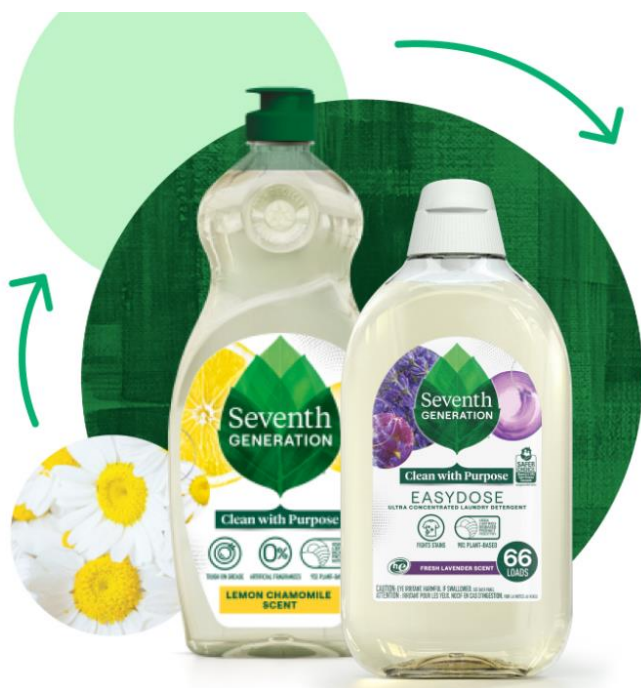
Slika 9: Dizajn proizvoda punog kruga