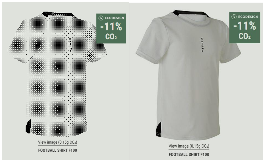
Slika 8: Usporedba slike majice, prije i nakon klika