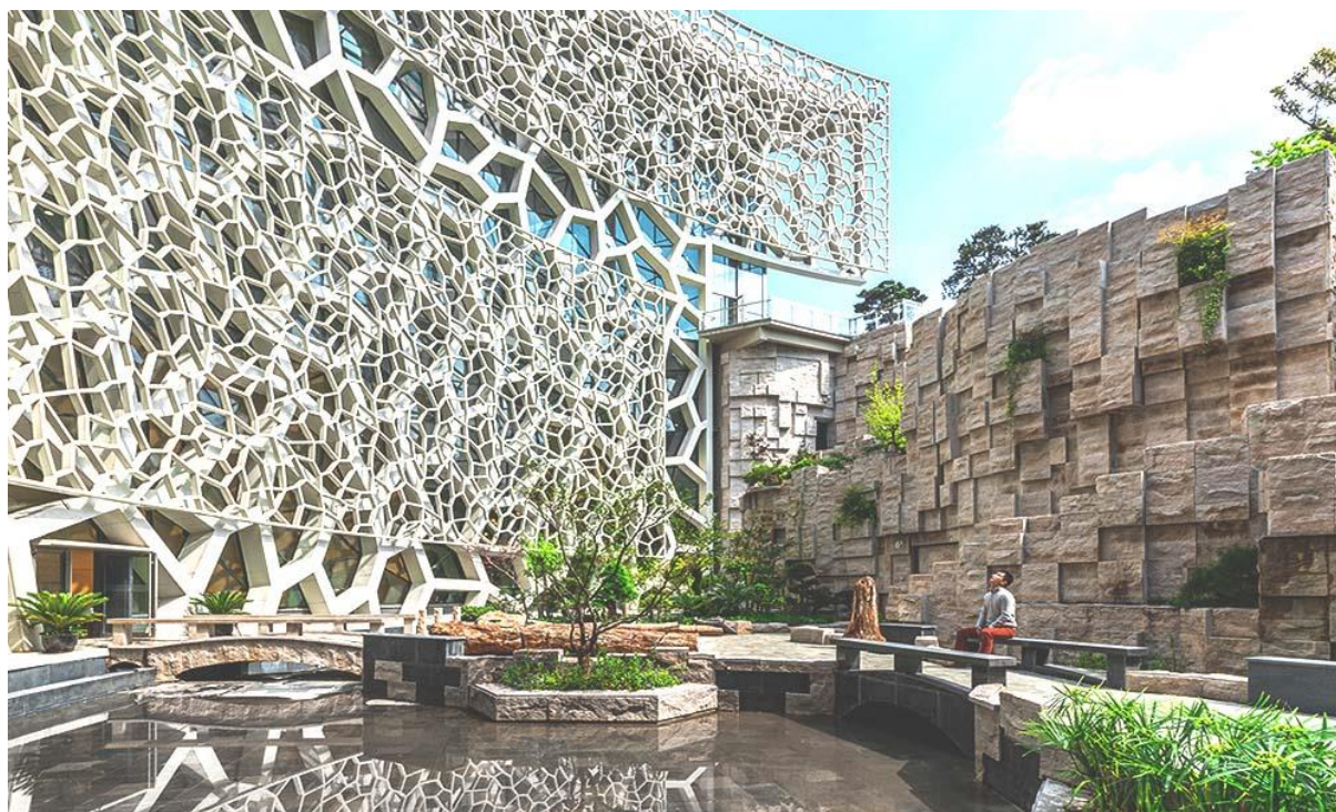
Slika 4: Muzej prirodoslovlja u Šangaju, Kina