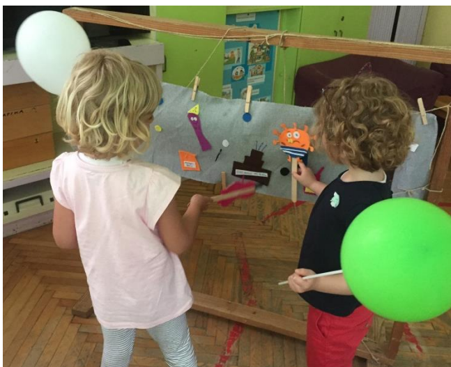
Slika 6. Dramatizacija ispred scene