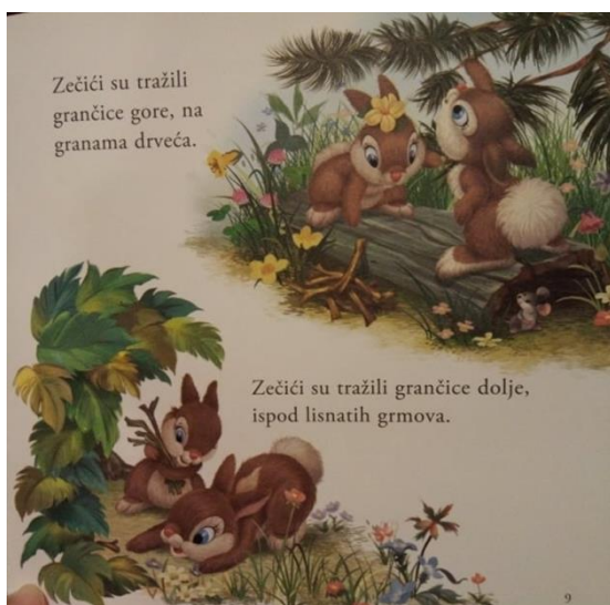
Slika 2. Ilustracija iz slikovnice "Volim vas zečiči moji"