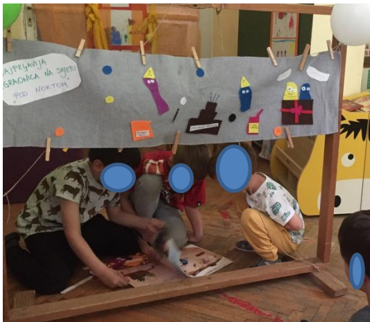
Slika 5. Listanje slikovnice kao podsjetnik

E.I. (4,9) A.I. (4,4,) i L.K. (5,9) stoje po strani sramežljivo gledajući i ne želeći prići blizu. A.I. (4,4) većinu vremena se smije, no nema hrabrosti pristupiti čak ni na poziv druge djece ili odgojitelja. D.L. (4,9) i M.G. (4,6) ometaju djevojčice u dramatizaciji iz razloga što žele sudjelovati pa im žele narušiti igru kako bi što prije stigli na red. N.G. (6,1) primjećuje da za potpunu dramatizaciju nedostaje lutka djevojčice Nore i njezinih prijatelja iz škole pa daje ideju za buduće aktivnosti kako bi više djece moglo biti uključeno.