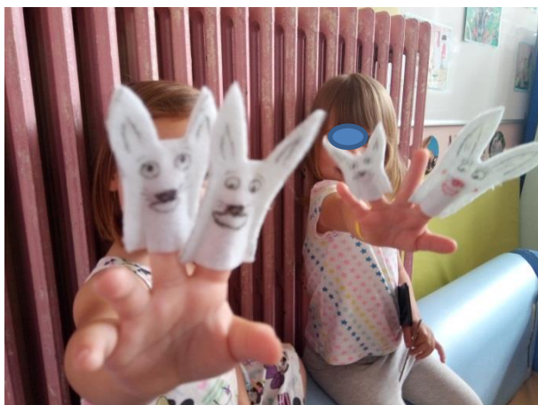
Slika 4. Prstne lutkice "Zečići"