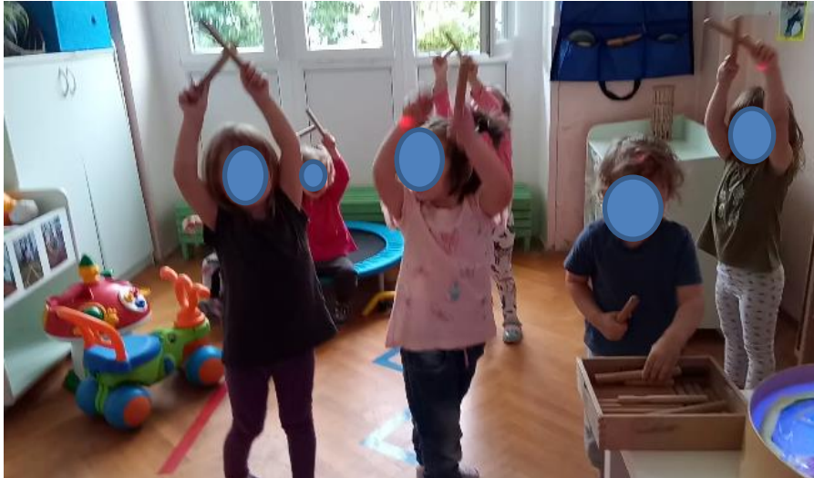
Slika 3. Ponavljanje aktivnosti u manjoj grupi.