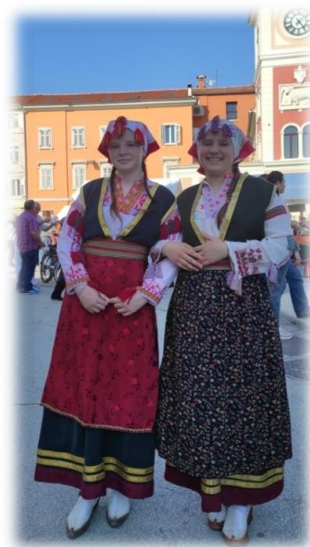
Slika 12. Djevojčice u narodnoj nošnji

Izvor: Autorica rada, fotografirano 10.05.2022., Rovinj