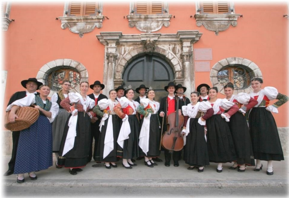
Slika 3. Članovi folklorne grupe Zajednica talijana Vodnjan