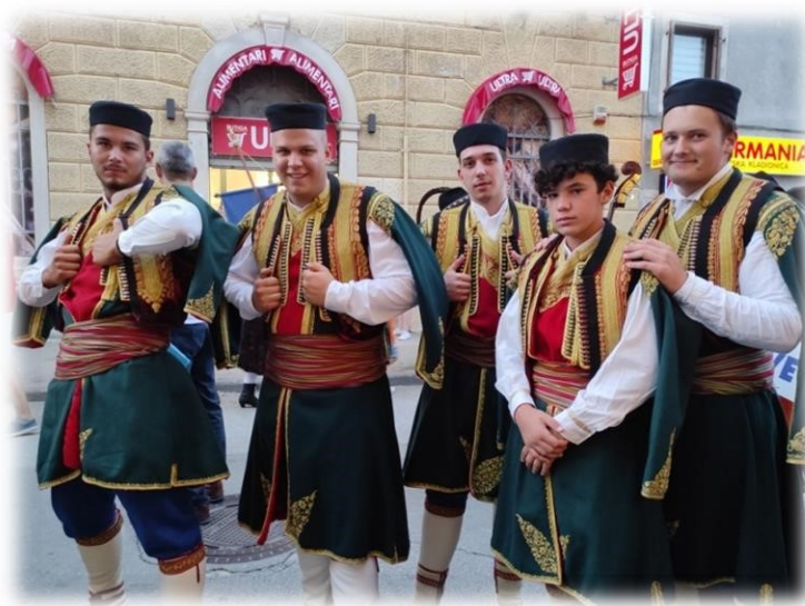
Slika 13. Članovi DPC-a Peroj na nastupu