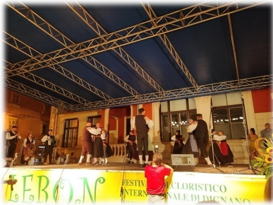
Slika 18. Nastup Folklornog društva Pazin

Izvor: Autorica rada, fotografirano 19. 08. 2022., Vodnjan