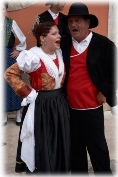
Slika 2. Diskanti pučke tradicije „Bassi“