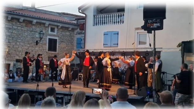
Slika 16. Nastup gostiju iz Vodnjana

Izvor: Autorica rada, fotografirano 23.07.2022., Peroj