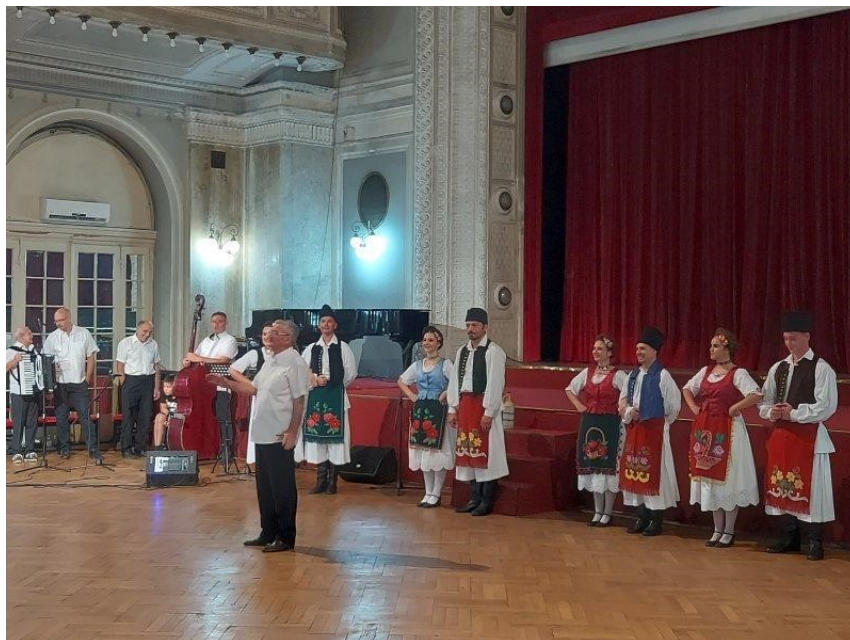
Slika 5. SKD „Prosvjeta“ u Puli