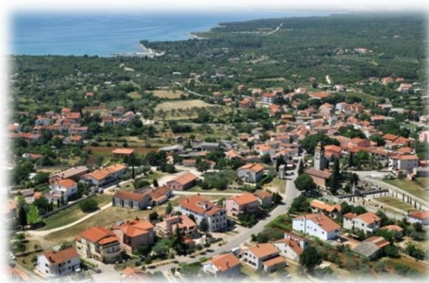
Slika 10. Selo Peroj