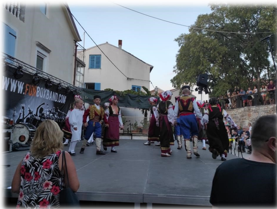
Slika 7. Nastup dječje skupine na Perojskoj fešti 2022.