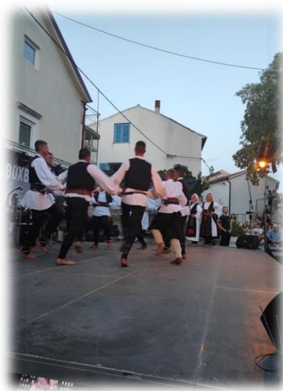
Slika 15. Nastup gostiju iz Vojnića