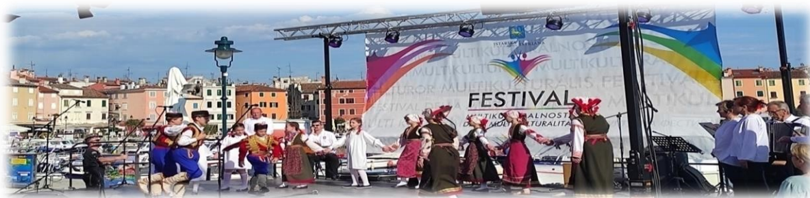
Slika 9. Nastup dječje folklorne skupine „DPC Peroj 1657“