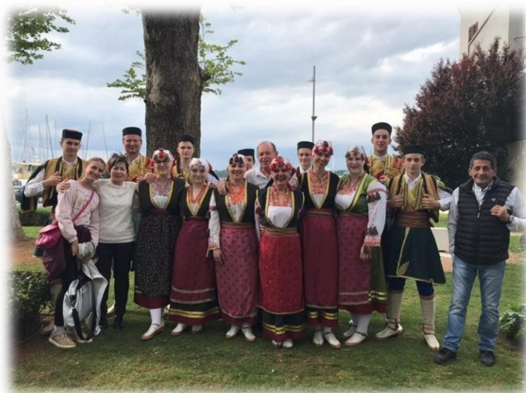
Slika 8. Članovi DPC Peroja na festivalu multikulturalnosti, Pula 2019.