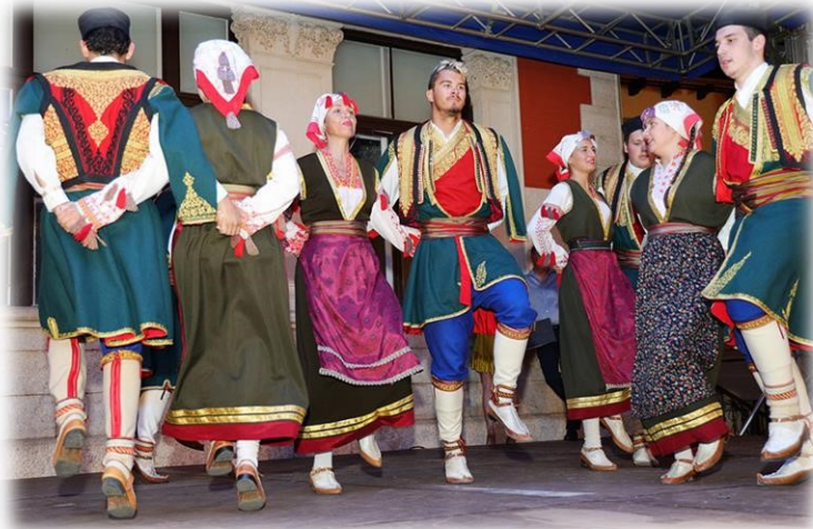
Slika 6. Nastup starije folklorne skupine na Leronu 2022.