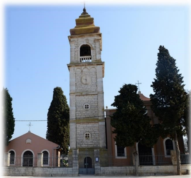
Slika 11. Crkva Sv. Spiridona u Peroju

Župna crkva u Peroju nas svojim zvonikom iz daleka upozorava da to nije uobičajeni istarski zvonik. Zaštitnik župe je Sv. Spiridon.