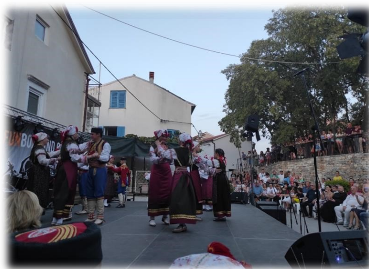
Slika 14. Nastup dječje folklorne skupine na Perojskoj fešti

Izvor: Autorica rada, fotografirano 23.07.2022., Peroj