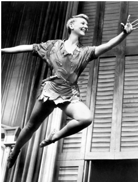
Slika 1.: Glumica Mary Martin u ulozi Petra Pana