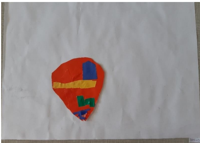
Slika 4.: Davudova čarobna zemlja

Komentar → Borna: Ovo je kućica od Petra Pana, ovo je od Zvončice, i ovo je drvo bombona gdje ja živim.