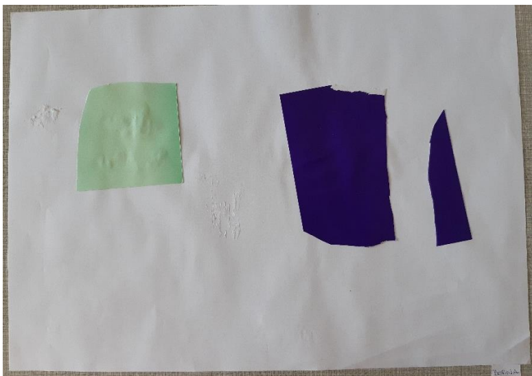
Slika 3.: Bornina čarobna zemlja