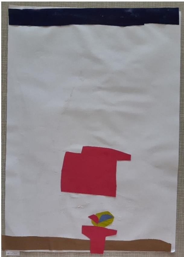
Slika 5.: Leonina čarobna zemlja