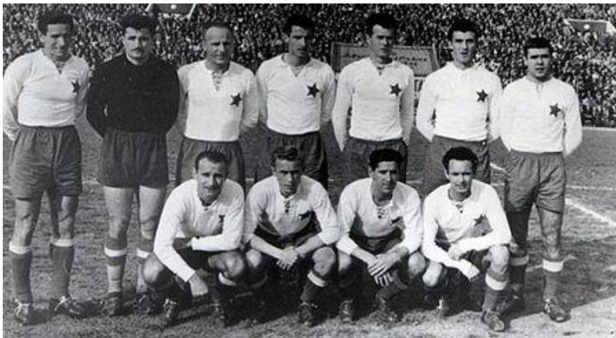
Slika 4: Momčad Hajduka 1954./55. godine

Prvo od dva velika zlatna doba Hajduka počelo je s osvojenim naslovom prvaka 1950. godine. Zvezda je povela, ali golovima Vukasa i Bože Brokete bijeli preokreću i osvajaju prvenstvo bez poraza. Ostali su jedini klub kojem je to uspjelo. Dvije godine kasnije generacija Beare i Vukasa opet je najbolja, a 1953. Nogometni savez Jugoslavije Splićanima je zabranio odgodu dviju utakmica zbog boravka u Argentini, koji je i državni vrh Jugoslavije pozdravio. Zbog tog apsurdna bijeli su morali igrati s juniorima na početku prvenstva, a unatoč nokautima Zvezde i Partizana u Beogradu, nisu uspjeli doći do titule.