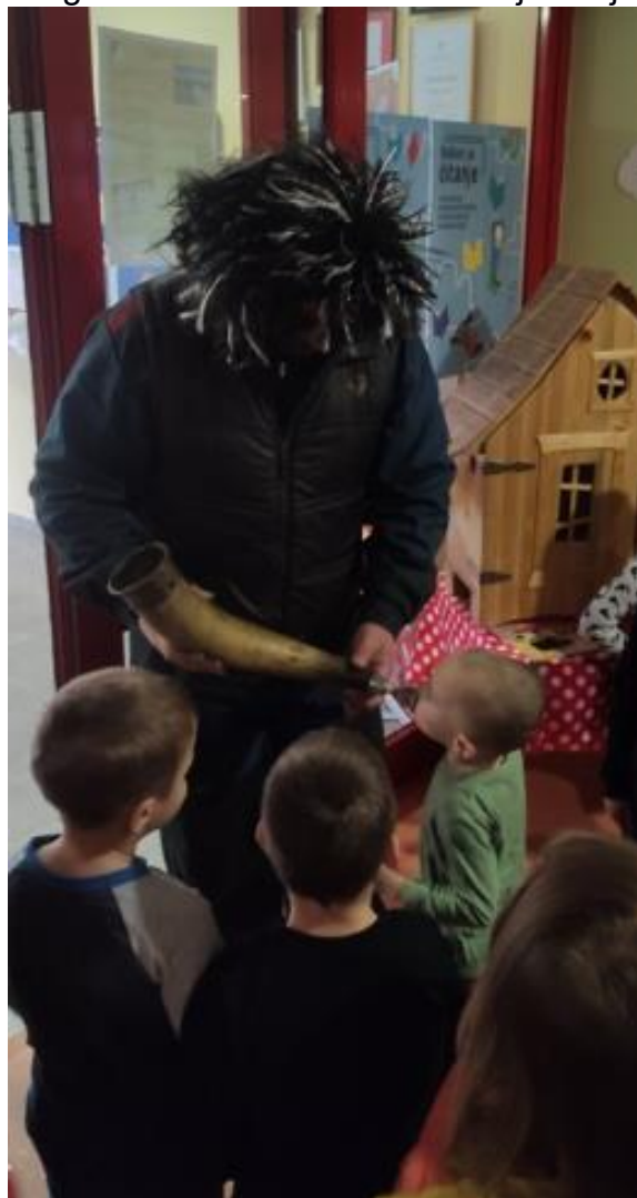
Slika 5. Puhanje u Antonjski rog u Dječjem vrtiću Viškovo.

Bubanj se ubraja među najstarije glazbene instrumente. Nezaobilazan je pratitelj zvončara. Zvuk ovog instrumenta nastaje udaranjem palice po membrani od životinjske kože. Nema pravila kakav se bubanj koristi u zvončarskom ophodu, može biti bilo kakav (Slika 6). Prisutnost bubnja može, također, biti jedan od pokazatelja vojničkog karaktera zvončara. Udarci palice po bubnju stvaraju vibracije koje proizvode određeni zvuk. Sila zvuka koju bubnjevi proizvode trebala bi otjerati sve zlo.