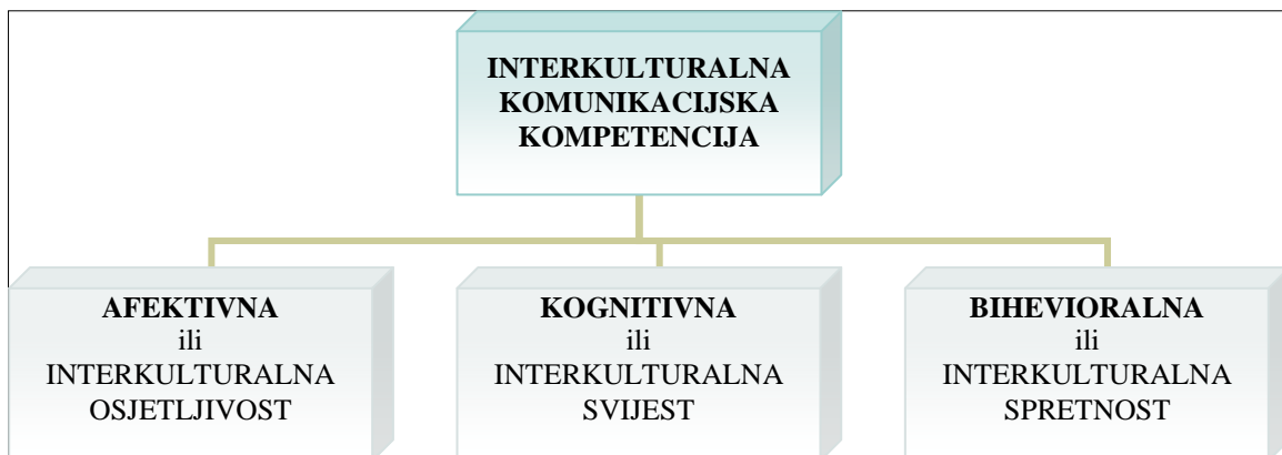
Slika 2. Model interkulturalne komunikacijske kompetencije (prema Chen i Starosta 2004)

Razvijajući model interkulturalne osjetljivosti, Chen i Starosta (2000) su razvili mjerni instrument Intercultural Sensitivity Scale – ISS (Skala interkulturalne osjetljivosti). Autori smatraju da je interkulturalno osjetljiva ona osoba koja je sposobna razviti pozitivne emocije kroz razumijevanje i prihvaćanje kulturnih razlika te promicati prikladna i učinkovita ponašanja u interkulturalnoj komunikaciji. Osim toga, interkulturalna osjetljivost se odnosi i na sposobnost prepoznavanja, priznavanja i poštivanja kulturnih razlika (Drandić, 2014). Kognitivna i afektivna dimenzija omogućuje pojedincu uspješno i učinkovito ponašanje u