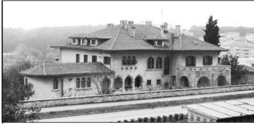
Slika 2. Vila Idola