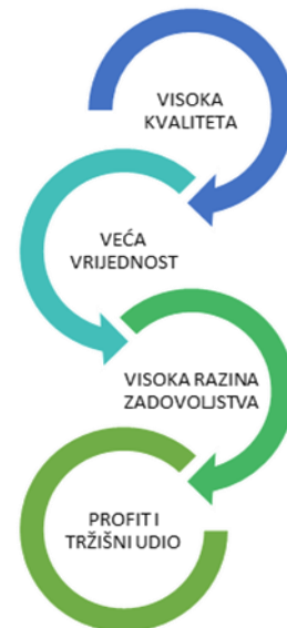
Slika 1: Prožetost marketinga od proizvodnje do stjecanja profita

Pogrešno je marketing vezivati samo i isključivo uz prodaju, već se danas on šire poima kao zadovoljenje potreba potrošača, a to se odvija puno prije samog čina prodaje. Kako bi se proizvod prodao, on se mora proizvesti, a sam čin proizvodnje teče u skladu s potrebama potrošača, stoga marketinški stručnjaci moraju izmjeriti upravo jačinu i intenzitet tih potreba, te utvrditi dovode li one do zarade. Nadalje tijekom cijelog životnog ciklusa proizvoda marketing mora oblikovati proizvod, nalaziti nove potencijalne klijenti, održavati odnose s postojećima, podizat razinu kvalitete i graditi još bolje rezultate prodaje. Prema Druckeru (1973.) smatra se kako se proizvod ili usluga koja poznaje i razumije kupca sama prodaje.