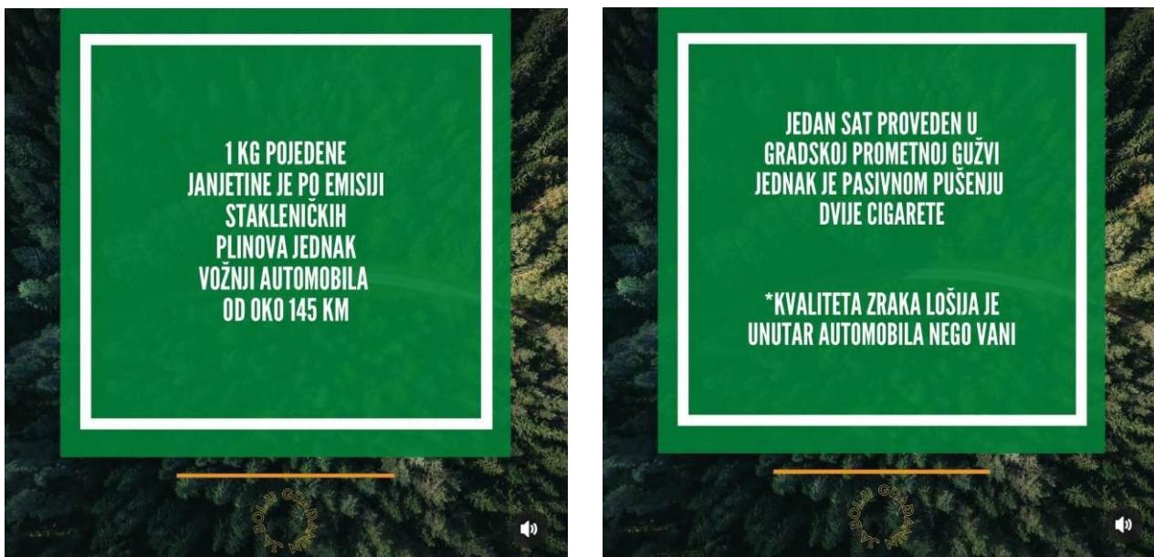
Slika 12: Sadržaj na Instagram profilu inicijative

savjete. Također je ustanovljeno kako metrika u društvu postoji ali ona obuhvaća manji broj zemalja u svijetu, a njeno bi mjerenje trebalo bit gotovo zakonski propisano. Za analizirani slučaj jasno se može zaključiti kako je svatko od nas pozvan poticati i primjenjivati društveno odgovorno ponašanje, pa tako i marketing (bilo da se radi o pojedincu ili organizaciji) u suvremenom i izazovnom okuženju kakvo je 21. stoljeće s ciljem stvaranja najboljeg mogućeg društva i okoliša za sve.