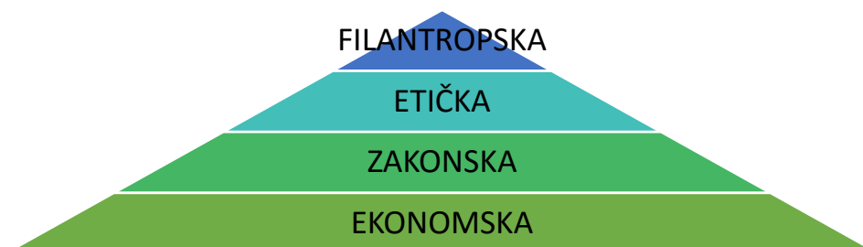
Slika 5: Razine organizacijske odgovornosti

Prema: CARROLL, A.B. (1991.). The Pyramid of Corporate Social Responsibility: Toward the Moral Management of Organizational Stakeholders. Business Horizons, 34(4), 39-48