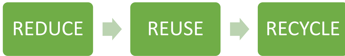
Slika 3: Značenje 3R u zelenom marketingu

Glavne odrednice zelenog marketinga predstavljaju 3R, odnosno: