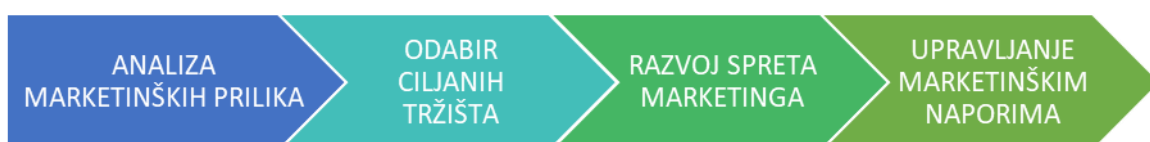
Slika 2: Marketinški proces

Prema Druckeru (1973.) sam marketinški proces odvija se u četiri etape: