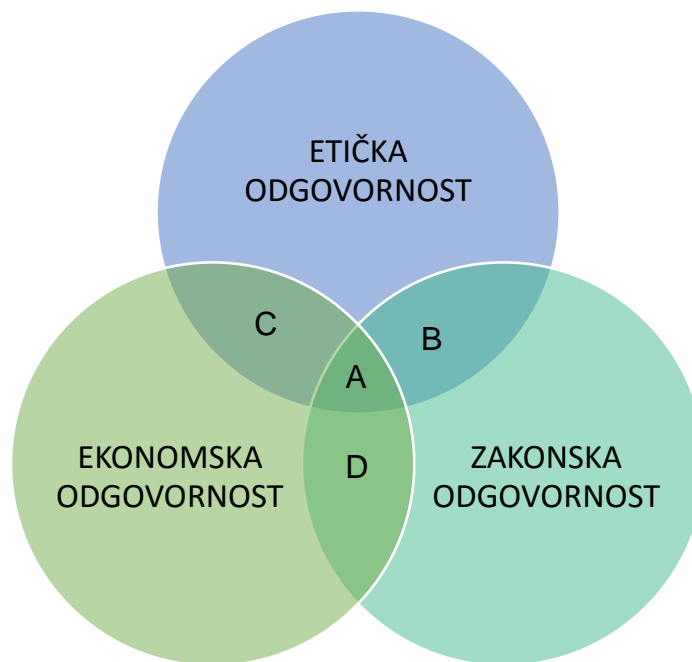
Slika 6: Dijagram etičkog odlučivanja