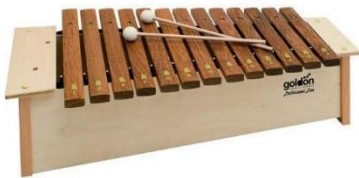
Slika 2. - Ksilofon