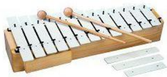
Slika 3. - Metalofon