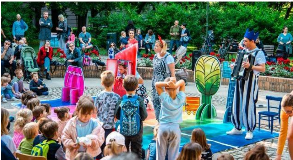
Prilog 4: Atmosfera tijekom predstave Teatra Poco Loco