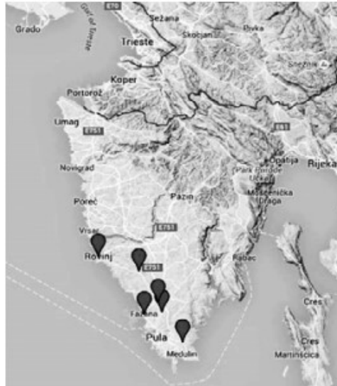
Slika 3. Rasprostranjenost istriotskih govora