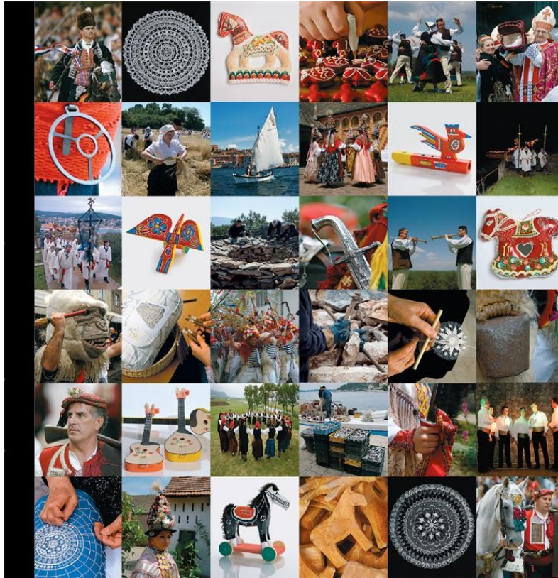
Slika 2. Nematerijalna kulturna baština Republike Hrvatske na UNESCO-ovoj listi

(Izvor: https://min-kulture.gov.hr/izdvojeno/kulturna-bastina/kulturna-bastina-na-unesco-ovim-popisima/17251 )