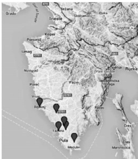
Slika 3. Rasprostranjenost istriotskih govora