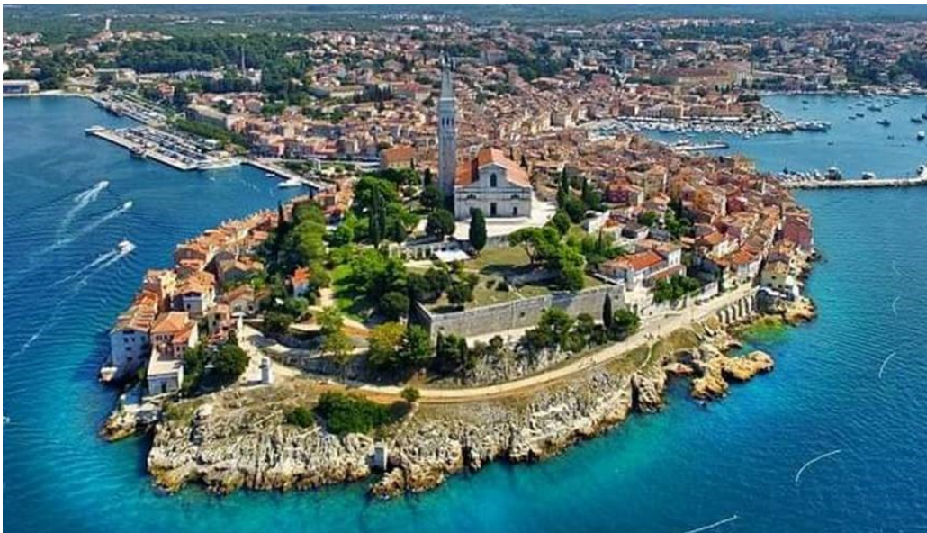
Slika 4. Grad Rovinj - osobitost Istarskog poluotoka