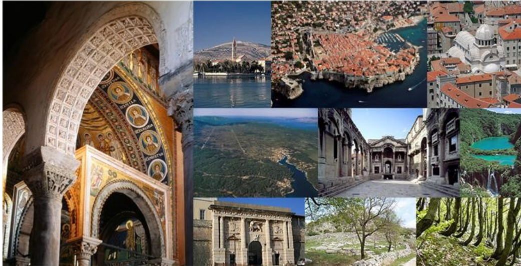
Slika 1. Nepokretna kulturna dobra Republike Hrvatske na UNESCO-ovoj listi