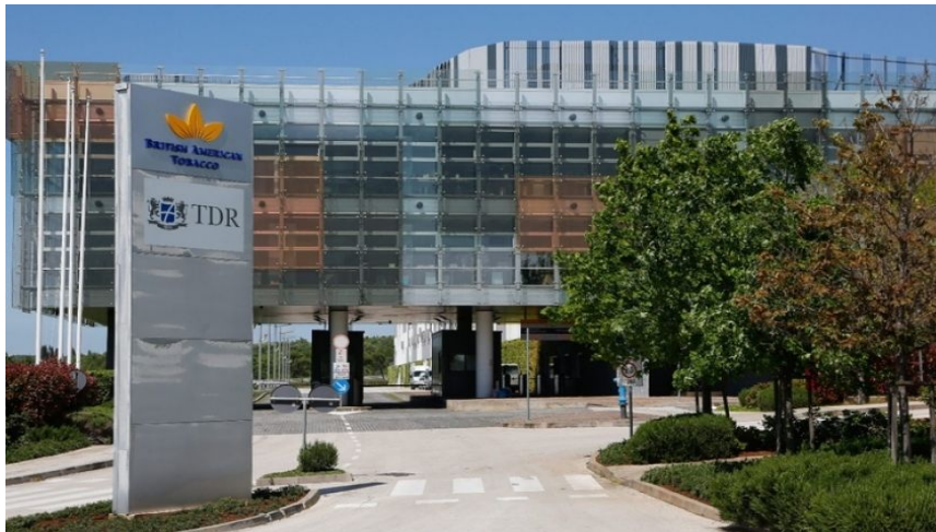
Slika 4. Glavni ulaz u tvornicu duhana TDR d.o.o.uKanfanaru