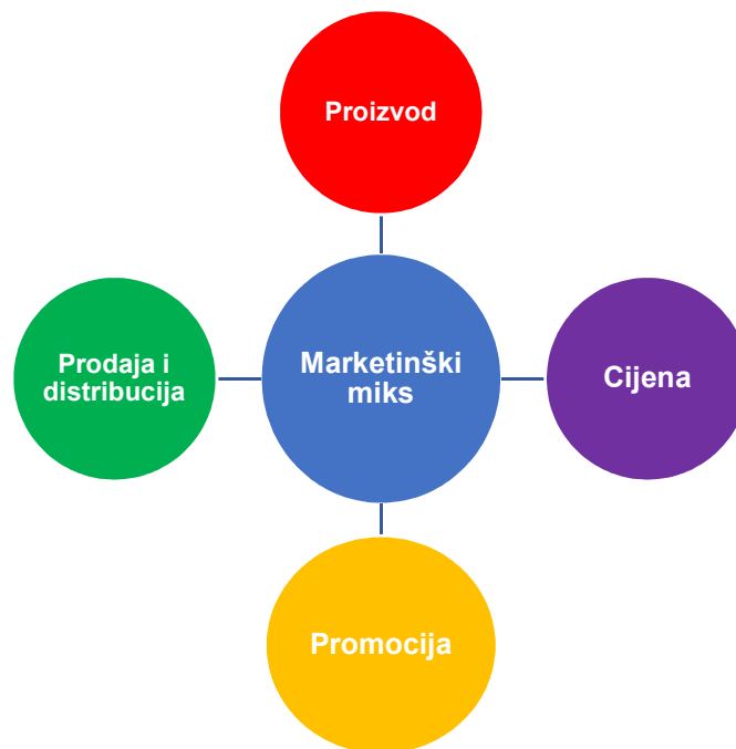
Slika 1. Četiri glavna elementa marketinškog miksa

Odluke o proizvodu se odnose na proizvode u ponudi poduzeća te kako unaprijediti njihova svojstva zbog pružanja odgovarajuće razine koristi potrošačima. Proizvodni miks uključuje izbor broja proizvoda koji će se nuditi tržištu, određivanje njihovih temeljnih tržišnih svojstava, uvođenje novih proizvoda te odbacivanje onih koji ne zadovoljavaju potrebe i želje potrošača.