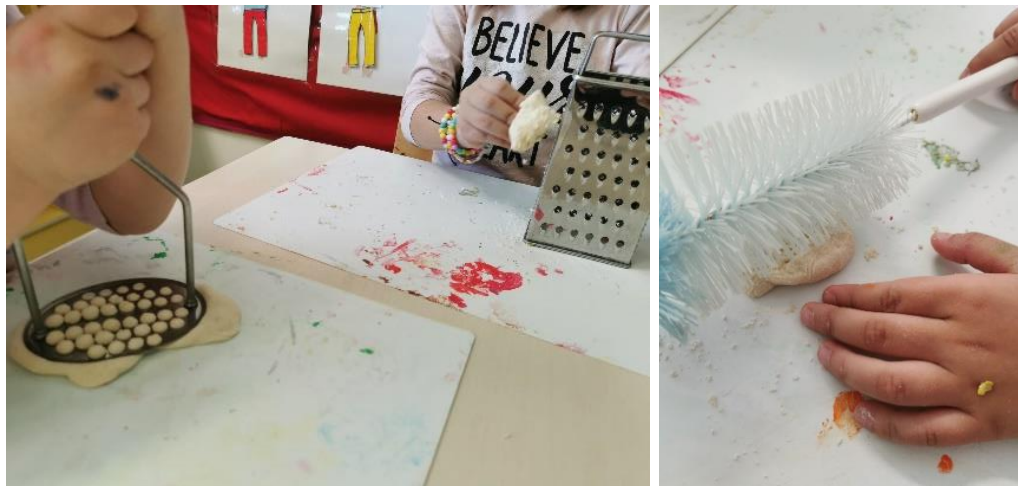
Slika 18. Udublјivanje tijesta posuđem

Djeci se izuzetno svidjelo udublјivanje tijesta raznim posuđem koje im je bilo ponuđeno. Na slici 18. djevojčice su udubile tijesto gnječicom i ribežom. Također su i hrapavu četku za pranje boca pokušale otisnuti u tijesto da vide što će nastati.