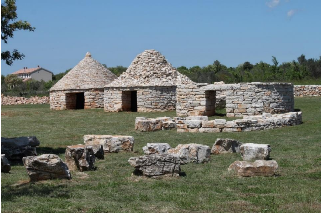
Slika 6. Park kažuna u Istri