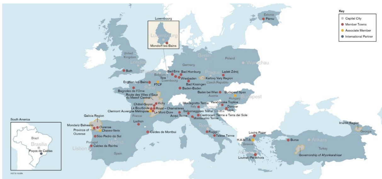
Slika br. 7. Karta mreže članica EHHTA-e

U EHHTA-i postoje dvije glavne kategorije članstva. Termalni gradovi (aktivni članovi), koje zastupa općina ili mjesna uprava, te pridruženi članovi, koji su obično zemljopisne regije ili udruženja. Udruženje svakodnevno vodi mala radna skupina i Znanstveni odbor koji surađuju s Izvršnim vijećem i Općom skupštinom. Aktivni članovi moraju ispunjavati određene kriterije da bi bili primljeni u Udruženje povijesnih termalnih gradova. 57