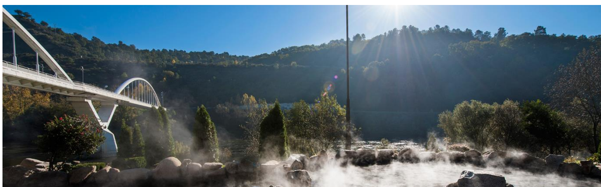
Slika br. 3. Ourense, Španjolska