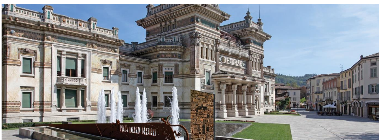
Slika br. 4. Salsomaggiore, Italija