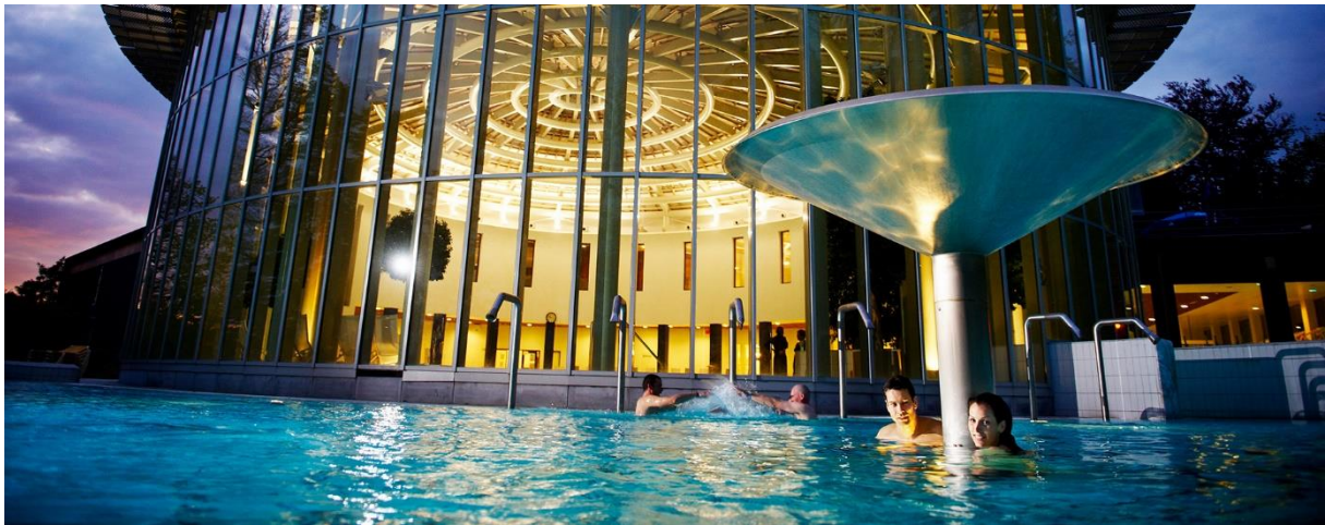
Slika br. 5. Spa, Belgija