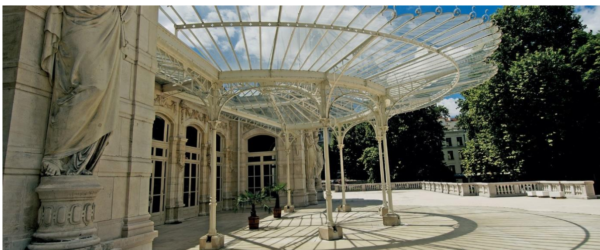
Slika br. 6. Vichy, Francuska