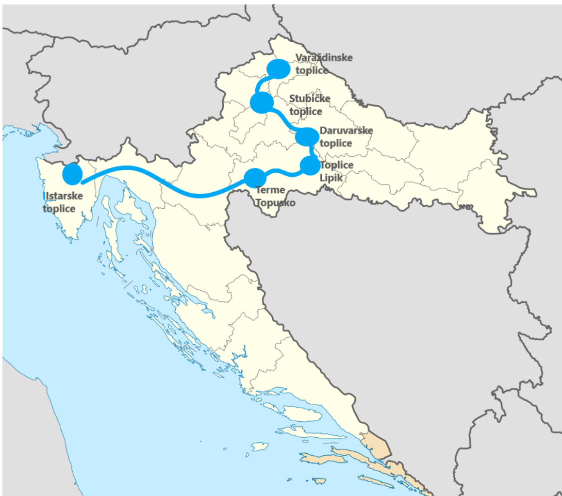
Slika 11. Karta Hrvatske (Kulturna ruta povijesnih termalnih gradova Hrvatske)

Na temelju istraživanja provedenog u sklopu izrade diplomskog rada osmišljena je nova kulturna ruta, odnosno potencijalna hrvatska dionica Europske kulturne rute termalnih gradova. Kulturna ruta vezana uz temu povijesnih termalnih gradova uključuje posjet lječilišnim destinacijama, a to su: Istarske toplice, Terme Topusko, toplice Lipik, Daruvarske toplice, Stubičke Toplice i Varaždinske Toplice, koje promiču zdravstvenu i lječilišnu kulturu življenja. Ova lječilišta su odabrana, jer prema provedenom istraživanju posjeduju najkvalitetniju termalnu vodu. Za svaku destinaciju predloženo je nekoliko dodatnih i popratnih aktivnosti, kako bi posjetitelj mogao boraviti više dana ili samo jedan dan.