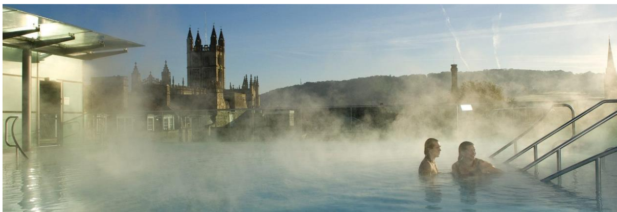
Slika br. 2. Bath, Velika Italija