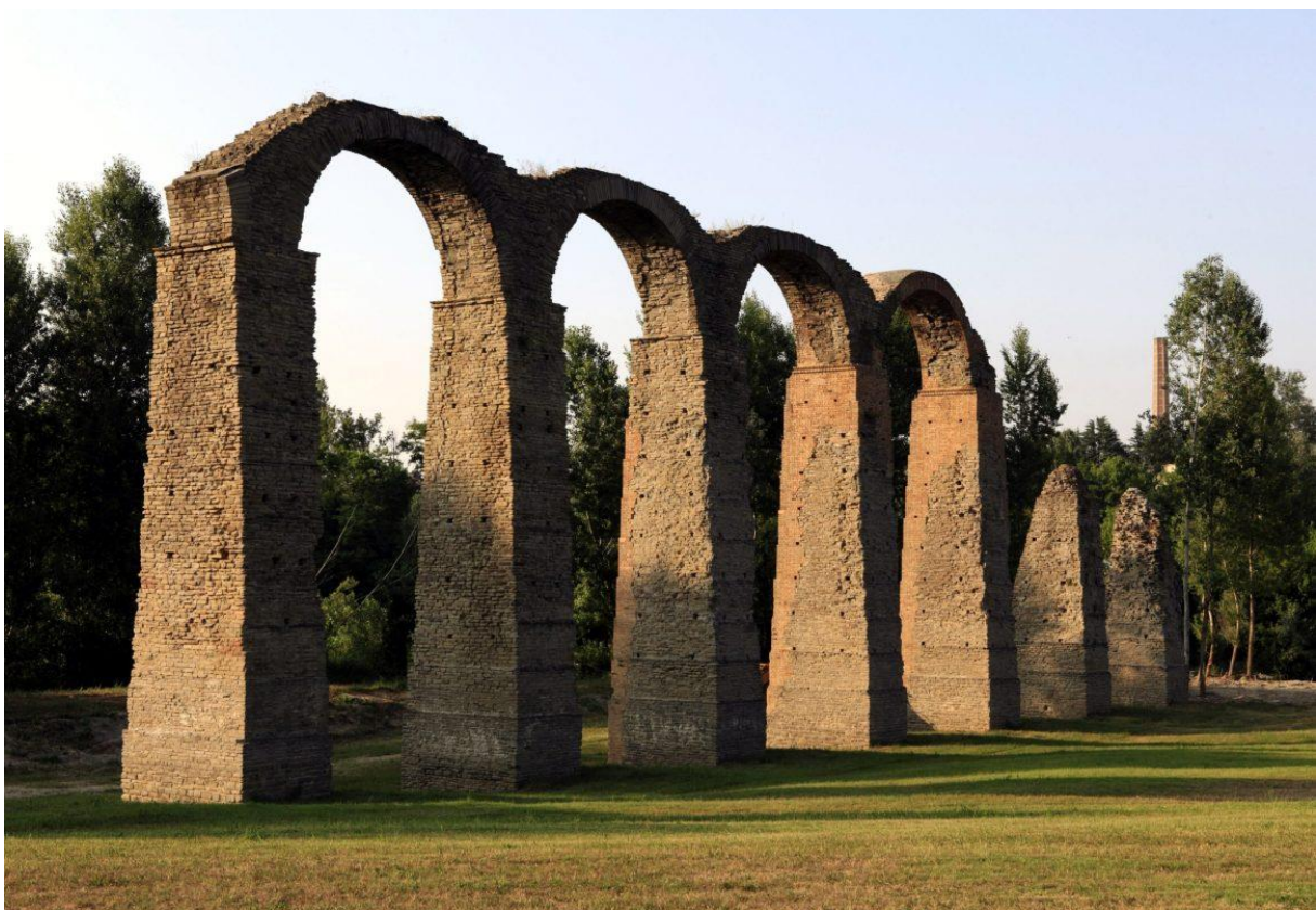
Slika br. 1. Acqui Terme, Italija

EHTTA je neprofitna udruga utemeljena zbog potrebe za poticanjem zaštite i unapređenja termalne, umjetničke i kulturne baštine diljem Europe. Osnovana je 2009. godine u Bruxellesu od strane šest članova osnivača - Acqui Terme (Italija), Bath (UK), Ourense (Španjolska), Salsomaggiore Terme (Italija), Spa (Belgija) i Vichy (Francuska). Mnogi od tih gradova bili su uključeni u trogodišnji projekt suradnje pod nazivom “Thermae Europae” (Program Kultura 2000), koji je imao za cilj valorizirati i očuvati termalnu kulturnu baštinu u Europi, te su željeli nastaviti suradnju uspostavljanjem stalne mreže. 55