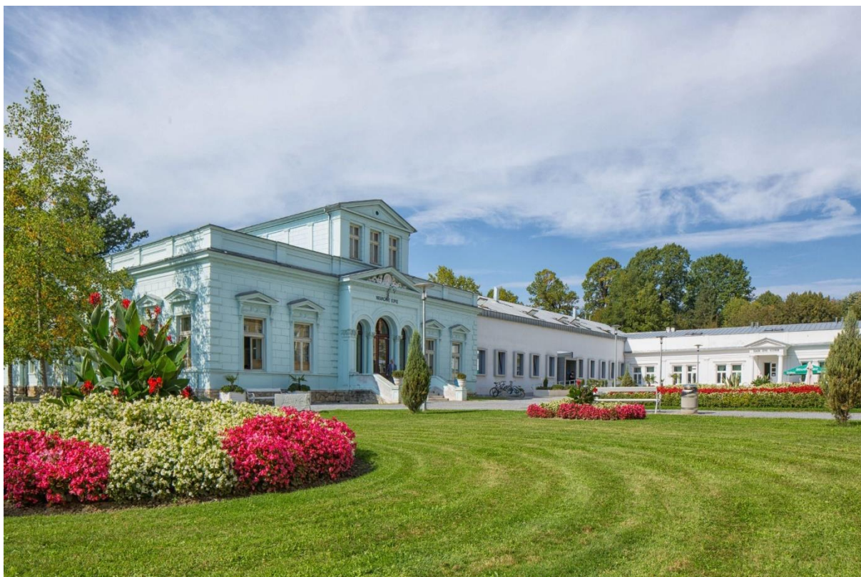
Slika br. 9. Lipik