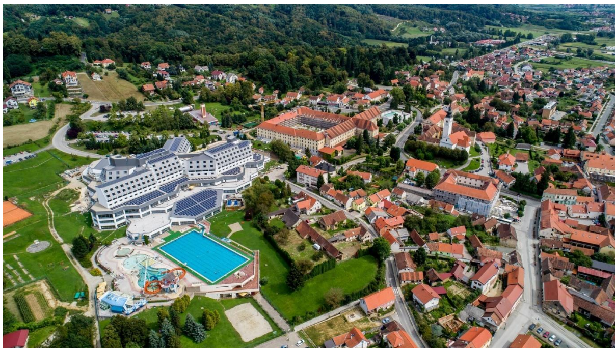
Slika 10. Varaždinske toplice