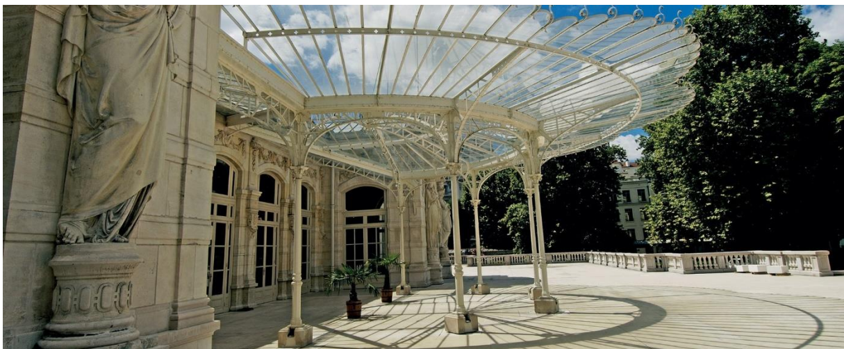
Slika br. 6. Vichy, Francuska