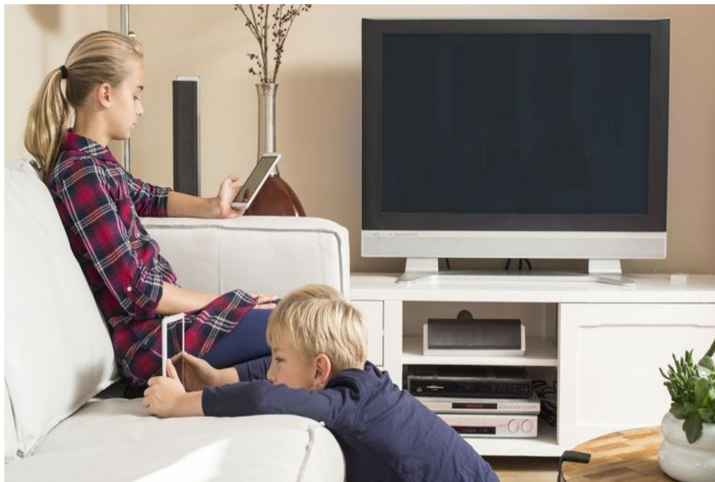
Slika 5. Današnja djeca i slobodno vrijeme

Djeca postaju usamljena, obiteljska se atmosfera pogoršava, a drastično se osjeća i generacijski jaz između roditelja i djece. Opće nezadovoljstvo u obitelji za posljedicu ima sve veći broj rastavljenih brakova. U takvim slučajevima najviše pate upravo djeca, koja se zbog toga okreću „suvremenim“ tehnologijskim igračkama. Na Internetu pronalaze zabavne sadržaje zahvaljujući kojima zaborave na stvarne probleme. Djeci je taj proces još teži jer se tek razvijaju i potrebna im je pomoć, potpora i komunikacija s roditeljima koji će ih znati i moći kvalitetno usmjeriti.