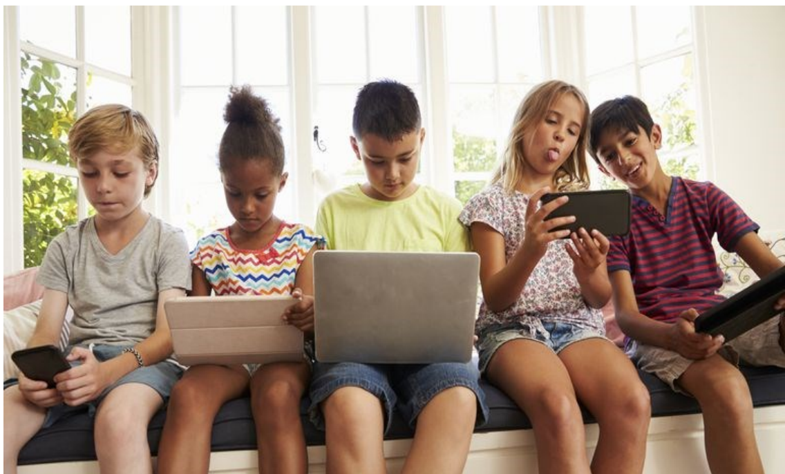
Slika 4. Današnja djeca i suvremene digitalne igračke

Iako je današnje društvo zaista nezamislivo bez mobilnih uređaja, točnije Interneta i tehnologije, s nekim stvarima čovjek valja biti oprezan. Djeca se danas s pametnim telefonima bude, obavljaju svu dnevnu rutinu i aktivnosti, navečer liježu pored svojih pametnih telefona i tako iz dana u dan. Na taj način brzo postaju ovisnici, a ta ovisnost djeluje na njihov cjelokupan razvoj.