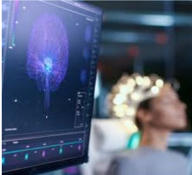
Slika 2. Tehnologija – čitanje misli

Budućnost donosi niz novih promjena poput umjetne inteligencije, uvođenja robota na brojna radna mjesta, virtualnih asistenata, rada od kuće i 3D printera koji doživljavaju snažnu ekspanziju.