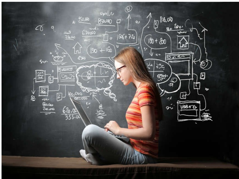
Slika 3. Učenje uz internetsku potporu