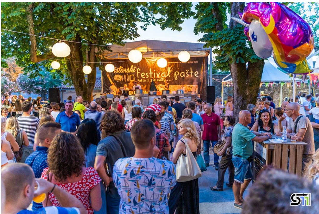
Slika 14. Istarski festival pašte