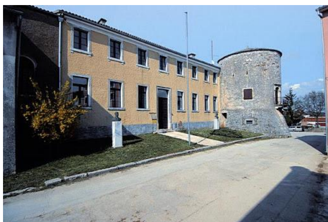
Slika 10. Čakavska kuća