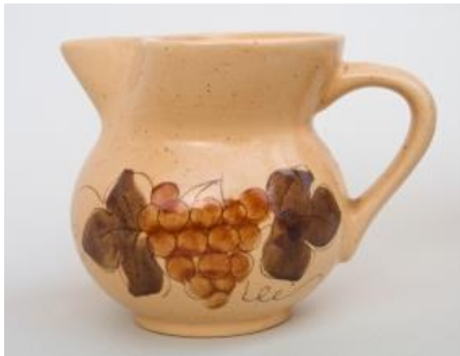
Slika 9. Bukaleta s motivima grožđa