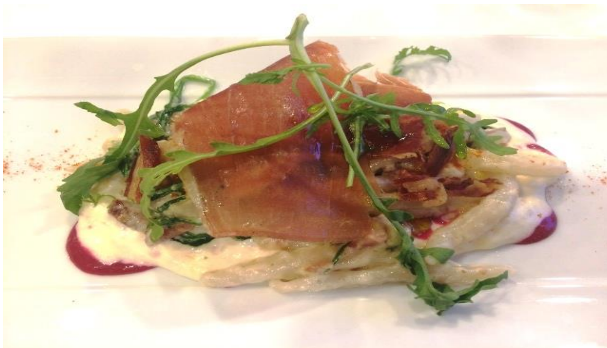
Slika 15. Žminjski pijat