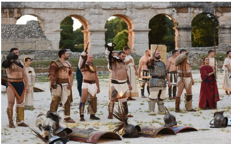
Slika 1. Gladijatorske borbe u Areni