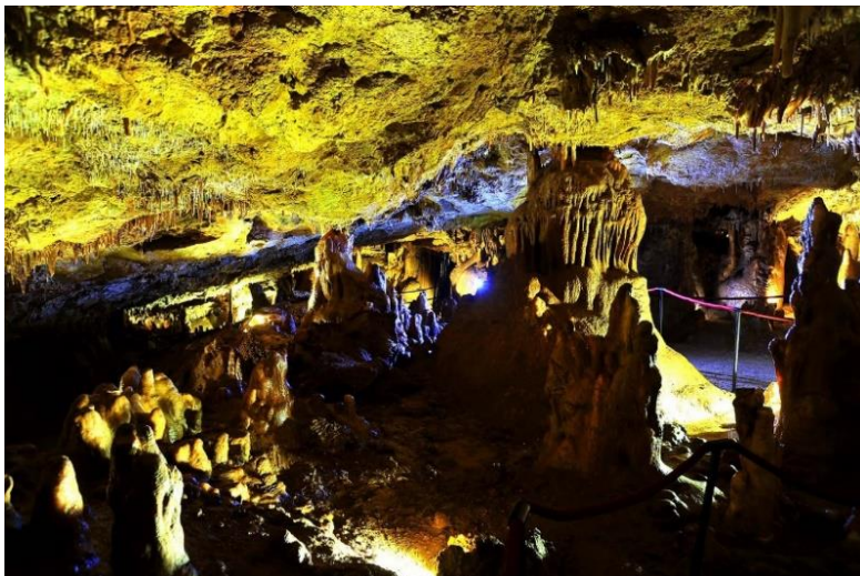
Slika 4. Špilja Feštinsko kraljevstvo