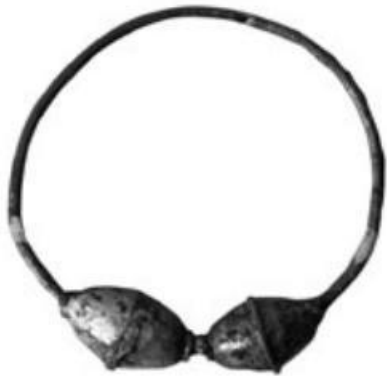
Slika 3. Autohtoni žminjski rićin