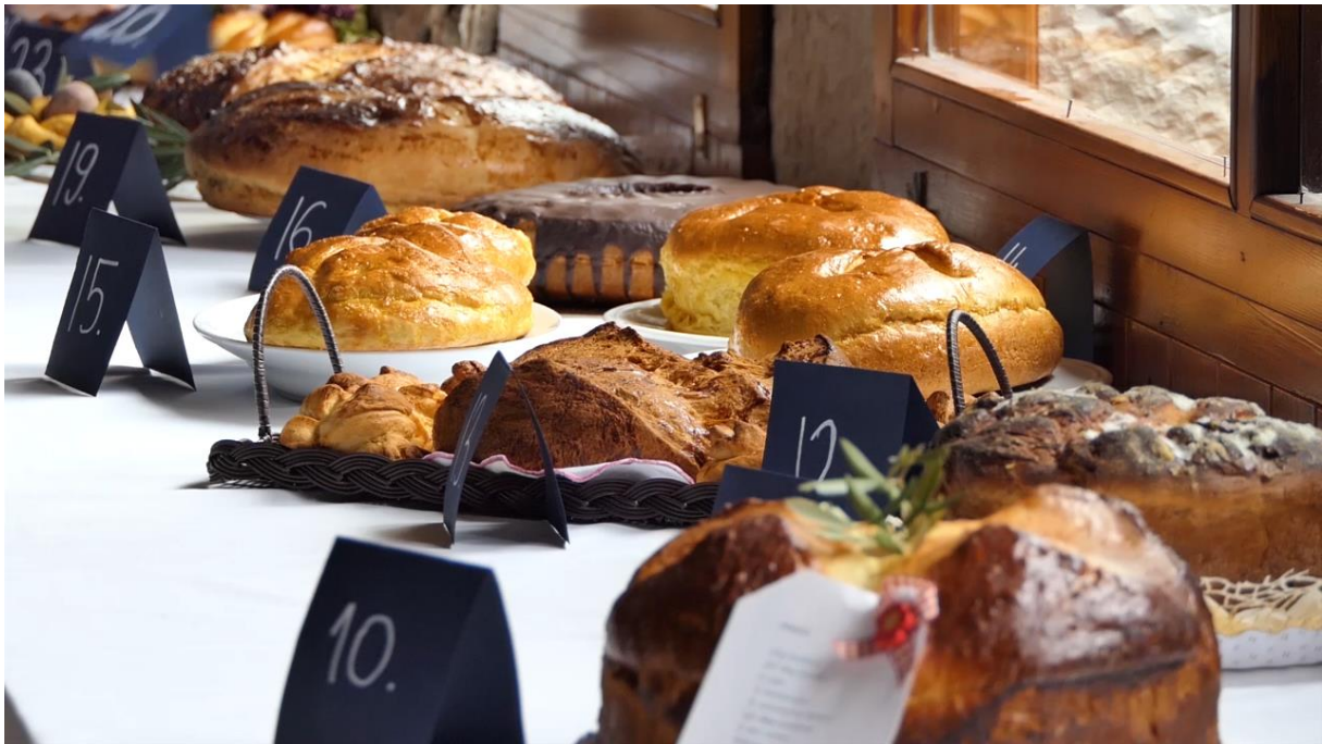
Slika 12. Izložba pinci na manifestaciji