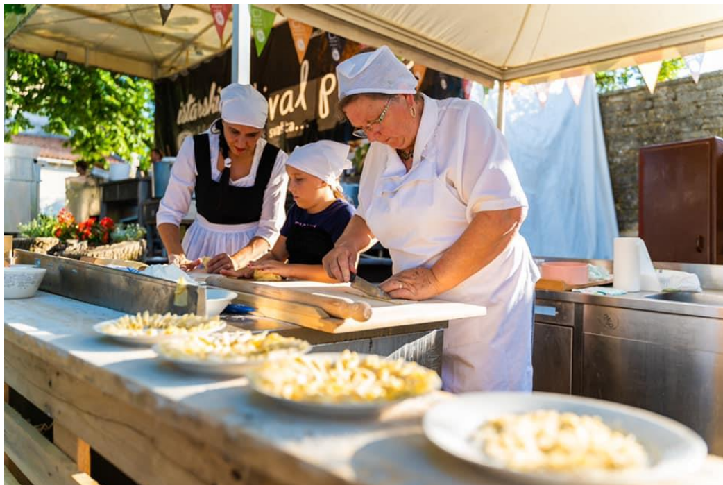
Slika 13. Radionica izrade domaće pašte