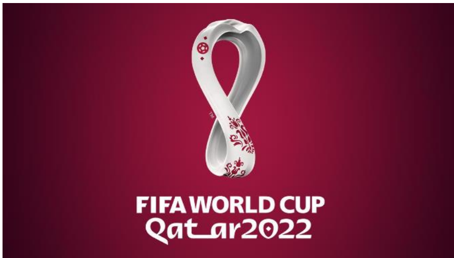
Slika 1. FIFA Svjetsko prvenstvo u Kataru 2022. Logo