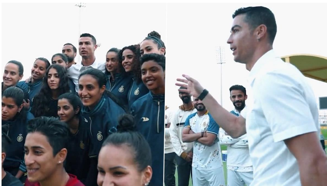
Slika 5. Cristiano Ronaldo i ženska nogometna reprezentacija Al-Nassra