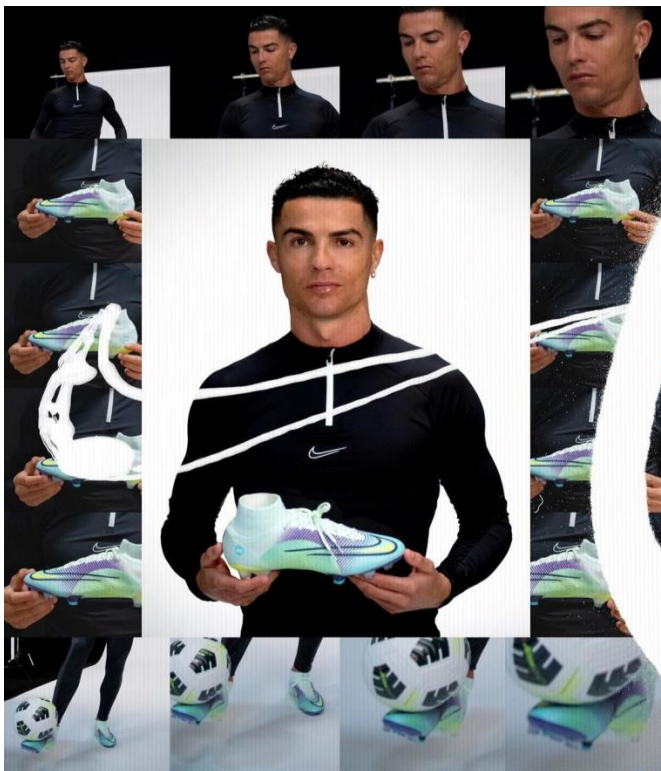
Slika 2. NIKE plaćeno partnerstvo s Cristianom Ronaldom