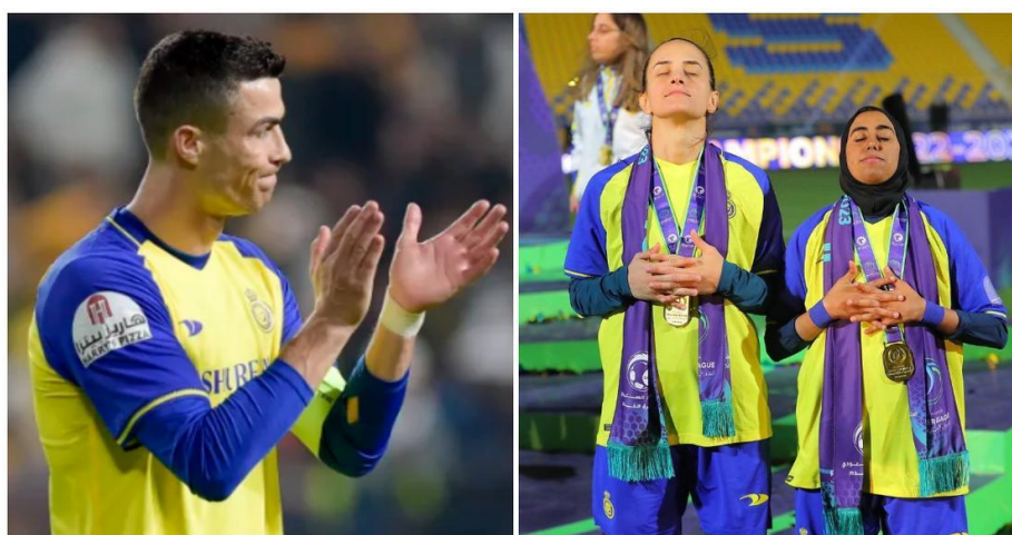
Slika 6. Ženska nogometna reprezentacija kopira Ronaldovo slavlje nakon osvojenog prvog mjesta