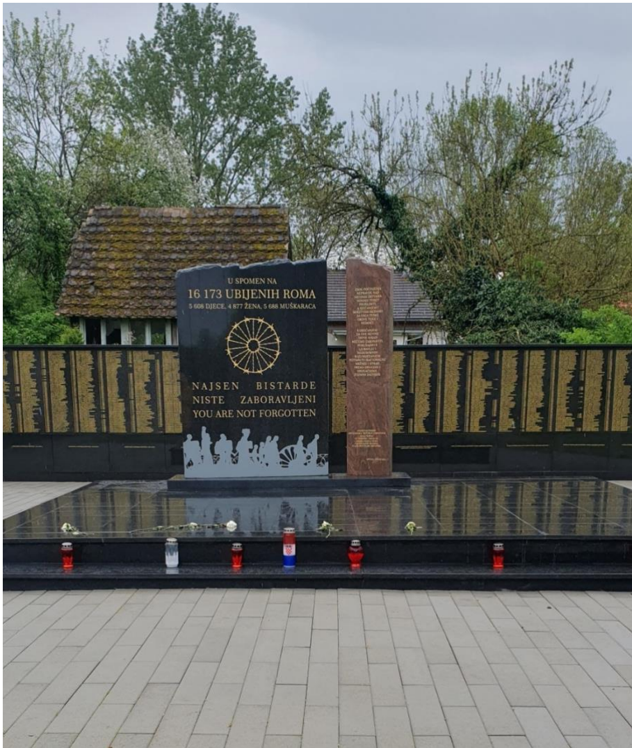
Slika 6. Spomen na ubijene Rome

U nastavku slijedi fotografija spomenika koji se nalazi u dvorištu Romskog memorijalnog centra u Uštici ispred masovnih grobnica u kojoj su pokopane žrtve. Točan broj ubijenih i pokopanih ne zna se, no pretpostavlja se da je broj pogubljenih 16 173, a u selima Uštica i Gradina između 25 000 i 27 000 Roma. 30 Također, na fotografiji iza postavljenog spomenika vidljiv je zid žrtava, s imenima, prezimenima, spolom i godinama života, a velika površina zida žrtava, umjesto napisanih podataka ima „NN“, odnosno osobni podaci nisu poznati.