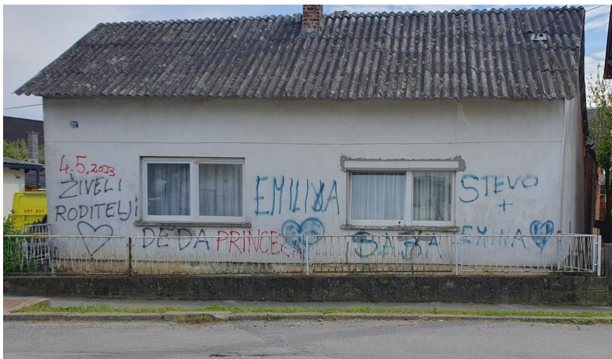
Slika 11. Objava rođenja djeteta u Roma

U nastavku slijedi fotografija kuće u kojoj žive Romi u Bjelovaru. Na fotografiji je prikazan način na koji Romi u Bjelovaru i okolici objavljuju rođenje djeteta.