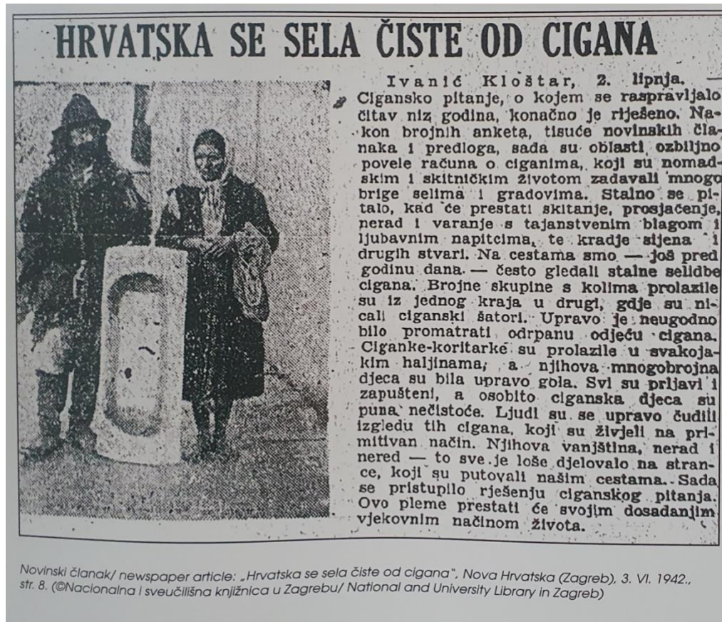
Slika 7. Novinski članak iz 1942.

Osim toga, odvođene Rome ponekad su pod prisilom morali u svojim kolima voziti susjedi i prijatelji ne-Romi. U nastavku slijedi fotografija novinskog članka od 3. lipnja 1942. čiji je naslov „Hrvatska se sela čiste od Cigana“.