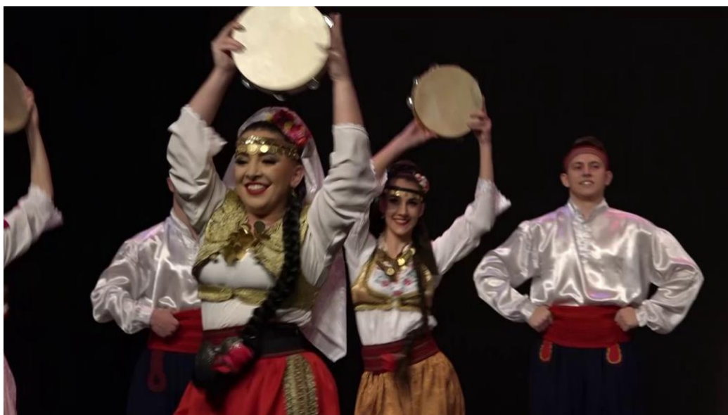
Slika 12. Romski ples čoček