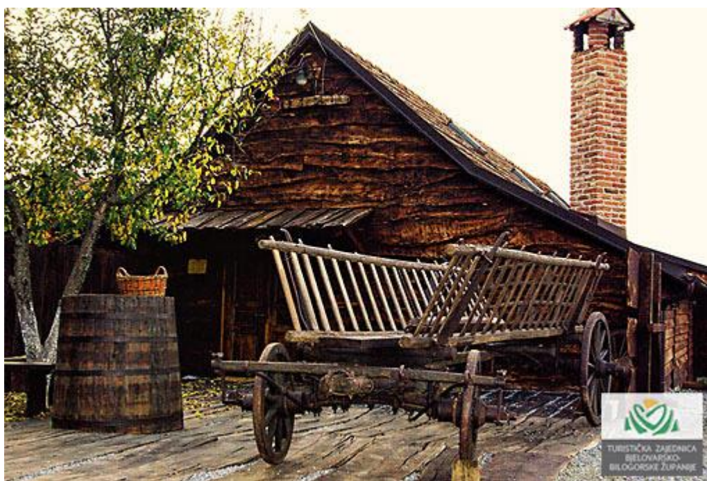
Slika 13. Romska kuća u Maglenči

Projekt „Romska kuća“ posjećeno je turističko odredište, a uz svoje edukativne programe i upoznavanje romske kulture popularan je u školama i brojnim udrugama. S obzirom da je prostor za posjetitelje prostran, u romskoj je kući moguće i održavanje raznih skupova, slavlja, okruglih stolova (...). Budući da je ovo jedina romska kuća u RH, ali i u svijetu, riječ je o jedinstvenom projektu, što je čini još atraktivnijom. U nastavku je slika navedene Romske kuće.