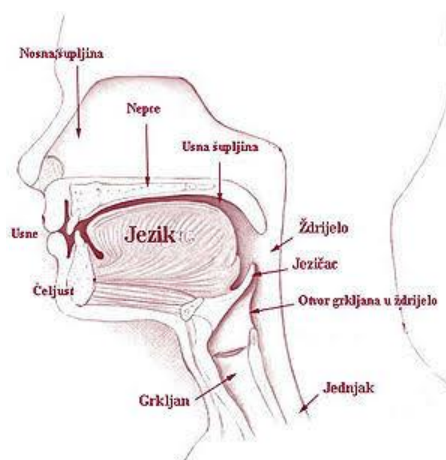
Slika 1. Govorni organi